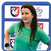
ABC NA SIŁOWNI