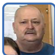
BOKS & K1