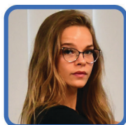
STEP & ABS