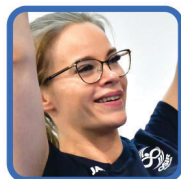
FIT JUNIOR TRAMPOLINY