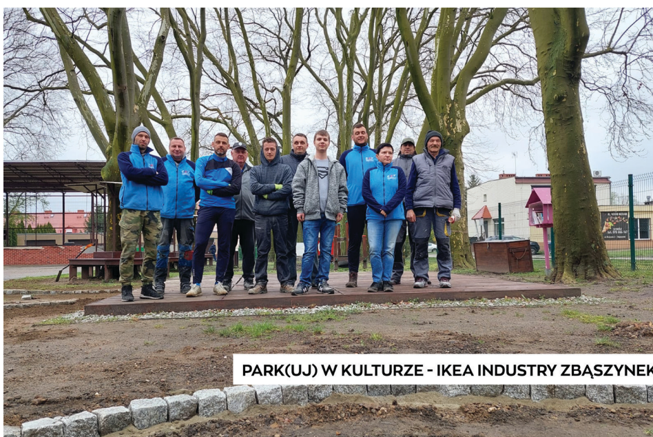
PARK(UJ) W KULTURZE - IKEA INDUSTRY ZBĄSZYNEK

W maju, wspólnie z Urzędem Miejskim zrealizowaliśmy wydarzenie pn. „Militarna Majówka