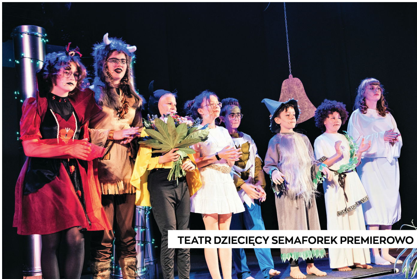
TEATR DZIECIĘCY SEMAFOREK PREMIEROWO

Zachęcam do odwiedzania naszej strony internetowej www.zok.zbaszynek.pl Na stronie znajdują Państwo szczegółowo opisane relacje foto i video z każdej imprezy organizowanej przez Zbąszyński Ośrodek Kultury.