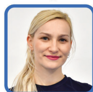
ZAJĘCIA Z POMPONAMI

Dziękujemy Naszym Klubowiczom za ponad 7000 odwiedzin podczas stałych zajęć w sezonie 2021/2022. Dziękujemy Trenerom i Instruktorom za poświęcony czas, zarażanie pasją sportu i współtworzenie Sportowego Zbąszyńka. Do zobaczenia po wakacjach z nową ofertą zajęć sportowych.