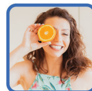
WARSZTATY DIETETYCZNE „SCHUDNIJ DO LATA”