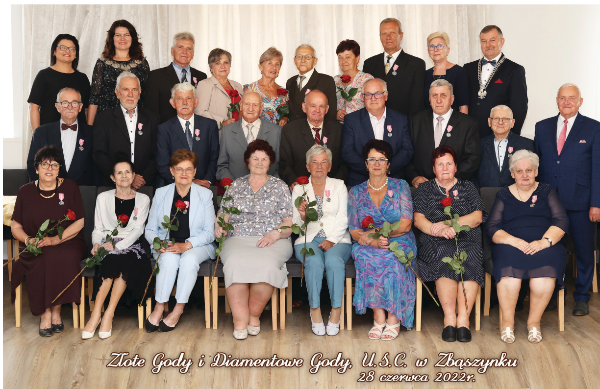
Złote Gody i Diamentowe Gody, U.S.C. w Zbąszynku 28 czerwca 2022r.

że ten ktoś jest. Naszym Jubilatom odśpiewaliśmy gromkie „sto lat” po czym Burmistrz wniósł toast za ich zdrowie i pomyślność. Po uroczystym odznaczeniu wszystkich zaproszono na wspólny obiad i ciasto. Małżonkowie zgodnie podkreślali, że te 50 czy 60 lat minęło zbyt szybko. Jako Urząd, za każdym razem spotykamy się z wielką radością i podziękowaniami od Jubilatów, że jeszcze ktoś pamięta o takich rocznicach w urzędowej oprawie. Jubilatom składamy serdeczne życzenia zdrowia, pogody ducha i dziękujemy za to, że zechcieli z nami podzielić się radością doczekania tak pięknych jubileuszy. Wszystkim parom, które chciałyby w przyszłym roku świętować swoje 50-cio lecie ślubu we wspólnym gronie już teraz przypominamy, że do końca grudnia 2022 r. trzeba złożyć deklarację dotyczącą zgody na wystąpienie do Prezydenta RP o nadanie „Medalu za Długoletnie Pożycie Małżeńskie” gdyż zgodnie z przepisami nie będziemy mogli sami wystąpić z taką inicjatywą. Deklaracje znajdują się na stronie internetowej www.zbaszynek.pl oraz w Urzędzie Miejskim biuro nr 8 (USC). Prosimy samych jubilatów, ich rodziny żeby zaangażowali się i pomogli rodzicom, dziadkom w wypełnieniu i dostarczeniu formularza do Urzędu Stanu Cywilnego. Dzięki temu będziemy mogli uhonorować ich wysiłek i troskę jaką włożyli poświęcając swoje życie małżeństwu i rodzinie.