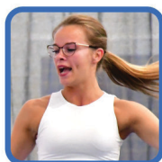
LATINO LADIES STYLING