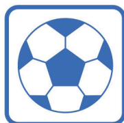
POGRAJ W PIŁKĘ NOŻNĄ