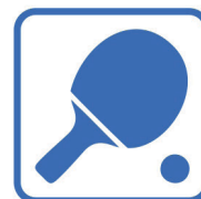
POGRAJ W TENISA STOŁOWEGO