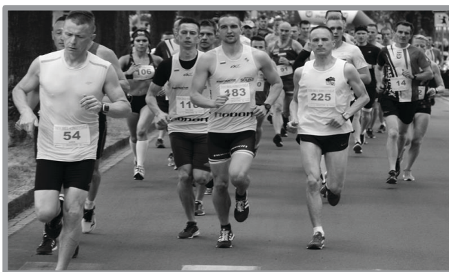
26 BIEG KONSTYTUCJI