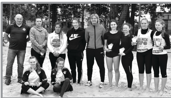
TURNIEJ SIATKÓWKI PLAŻOWEJ O PUCHAR PREZESA SPS ZBĄSZYNEK