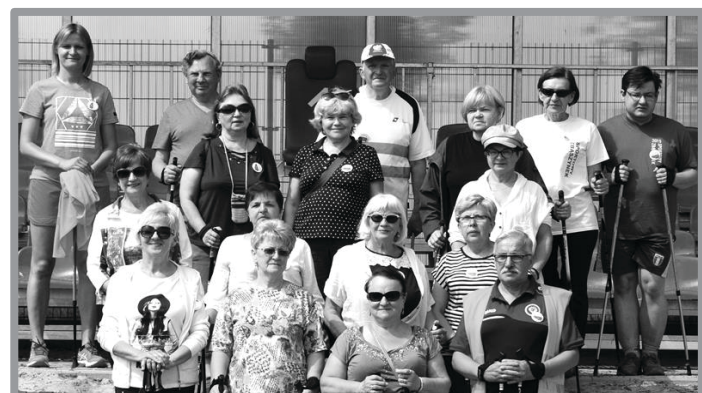
MARSZ STUDENTÓW UTW NORDIC WALKING