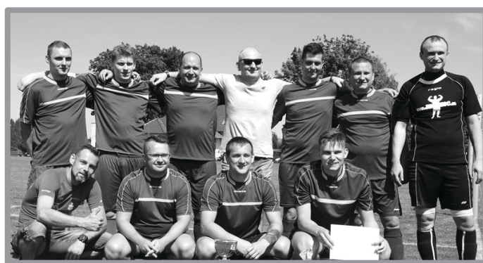
ZAKŁADOWY TURNIEJ PIŁKI NOŻNEJ O PUCHAR DYREKTORA GENERALNEGO IKEA INDUSTRY