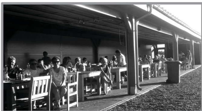
FESTYN SPORTOWO - REKREACYJNY KGW DĄBRÓWKA WLKP. - 55 LECIE ISTNIENIA