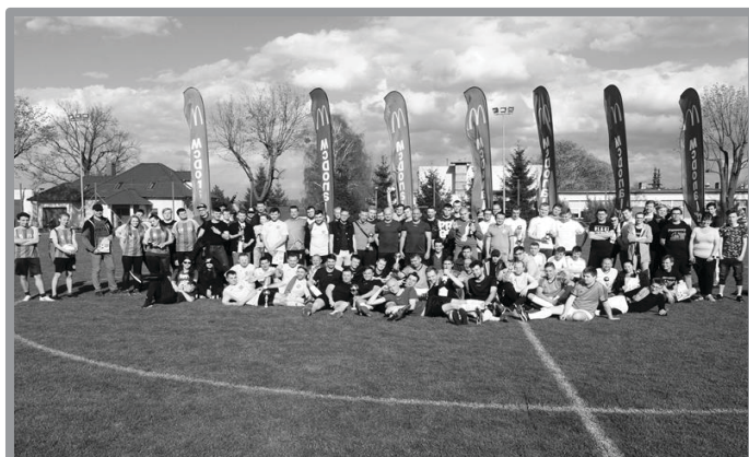
ZAKŁADOWY TURNIEJ PIŁKI NOŻNEJ II ROGO CUP