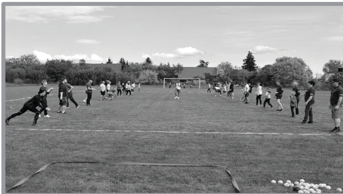
WIELKI TURNIEJ W PALANTA W KOSIECZYNI