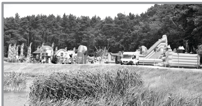
GMINNY DZIEŃ DZIECKA NA SPORTOWO