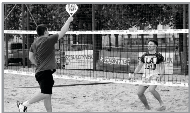
MAJÓWKOWY BEACH TENNIS