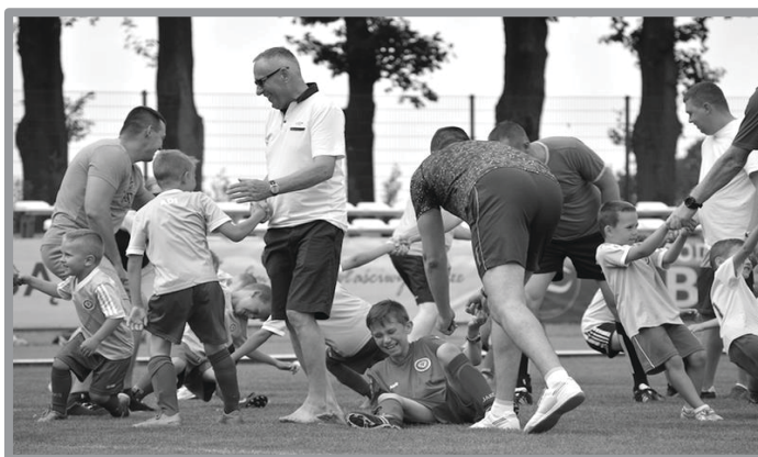
TWIN GAMES CUP IM. ANDRZEJA ŁESZYKA