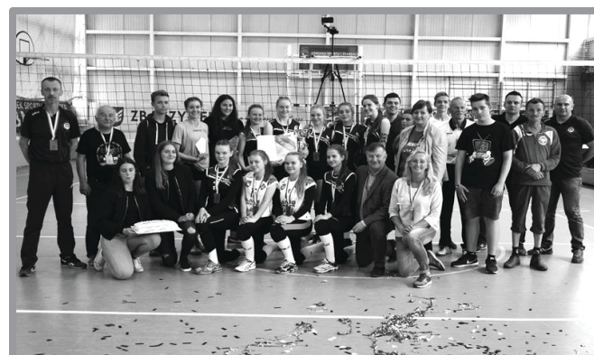
FINAŁ IMS W PIŁCE SIATKOWEJ