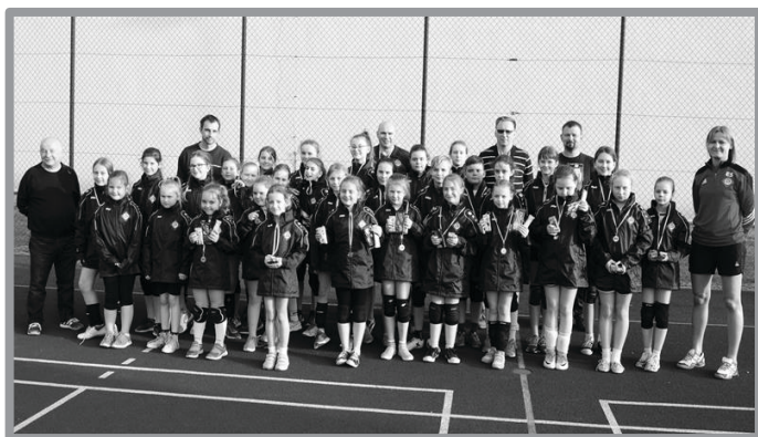
INTEGRACYJNY TURNIEJ MINISIATKÓWKI SPS ZBĄSZYNEK

Działo się dużo, o czym w graficznym skrócie poniżej.