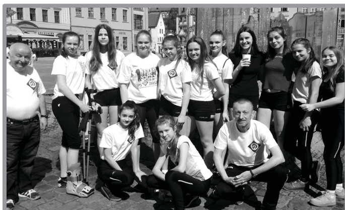
SPS ZBĄSZYNEK W ¼ MISTRZOSTW POLSKI WE WROCŁAWIU