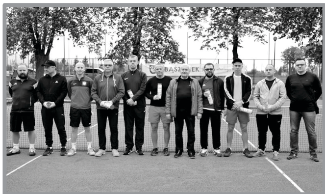
TRADYCYJNY MAJÓWKOWY TURNIEJ TENISA ZIEMNEGO O PUCHAR PRZEWODNICZĄCEGO RADY MIEJSKIEJ