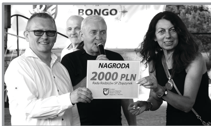
FESTYN SP ZBĄSZYNEK Z AKCENTEM SPORTOWYM