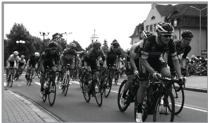
WYŚCIG KOLARSKI „BAŁTYK - KARKONOSZE TOUR”