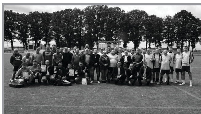
TURNIEJ PIŁKI NOŻNEJ O PUCHAR DYREKTORA ZAKŁADU LINII KOLEJOWYCH W ZIELONEJ GÓRZE