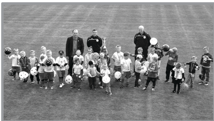
ŁĄBĄDEK CUP O PUCHAR PREZESA ZAP ZBĄSZYNEK