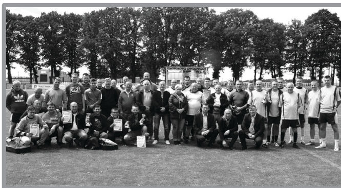
TURNIEJ PIŁKI NOŻNEJ OLDBOJÓW Z UDZIAŁEM TKKF SEMAFOR