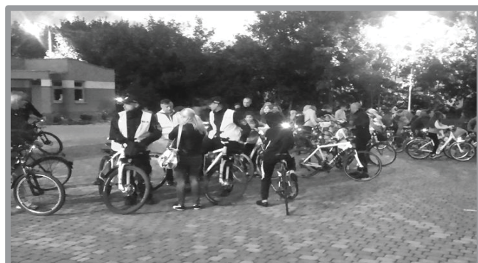
ROWEROWE POWITANIE WAKACJI NOCĄ