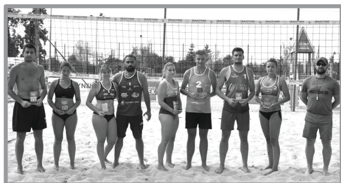
TURNIEJ SIATKÓWKI PLAŻOWEJ Z OKAZJI DNIA PRZYJACIELA