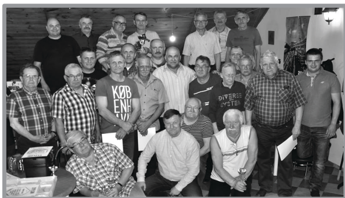
FINAŁOWY TURNIEJ KOPA W DĄBRÓWCE WLKP.