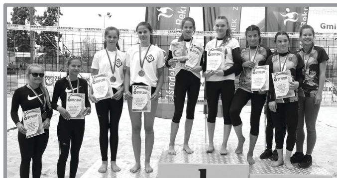
MISTRZOSTWA WOJEWÓDZTWA LUBUSKIEGO MŁODZICZEK W SIATKÓWCE PLAŻOWEJ