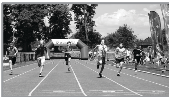
22 MEMORIAŁ LA IM. BOGDANA NIEMCA