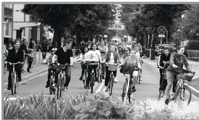
ZBĄSZYNEK NA ROWERY