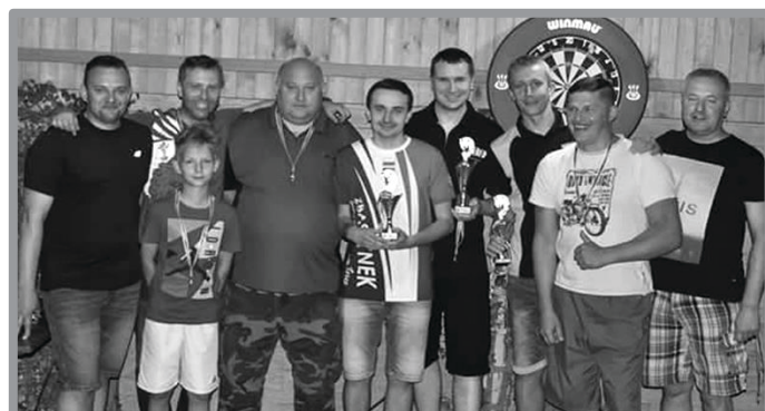
IV OTWARTE MISTRZOSTWA ZBĄSZYNKA W STEEL DARTA