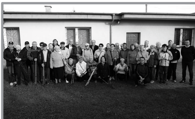
12.10 - SPORTOWY SENIOR 2017 - NORDIC WALKING - WE WSPÓŁPRACY Z OGRODAMI DZIAŁKOWYMI