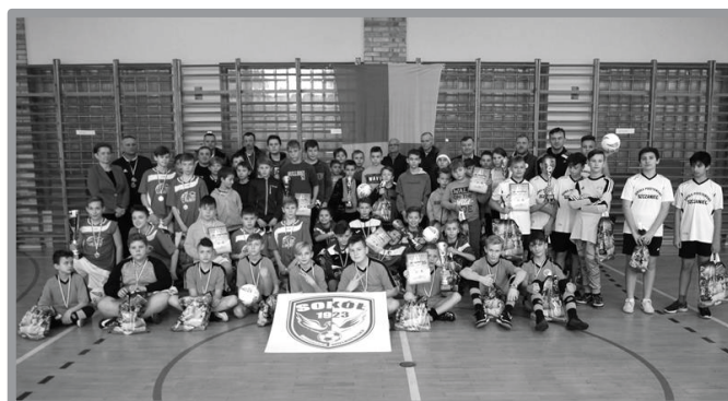
06.12 - MIKOŁAJKOWY TURNIEJ PIŁKI NOŻNEJ SZKÓŁ PODSTAWOWYCH - I MIEJSCE SP ZBASZYNEK