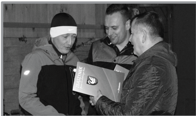
10.11 - BBL ZBASZYNEK - ZAKOŃCZENIE INAUGURACYJNEGO SEZONU