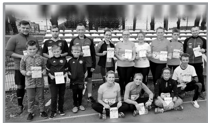
14.10 - TEST COOPERA - BBL ZBĄSZYNEK - KOLEJNA INICJATYWA NASZYCH BIEGACZY