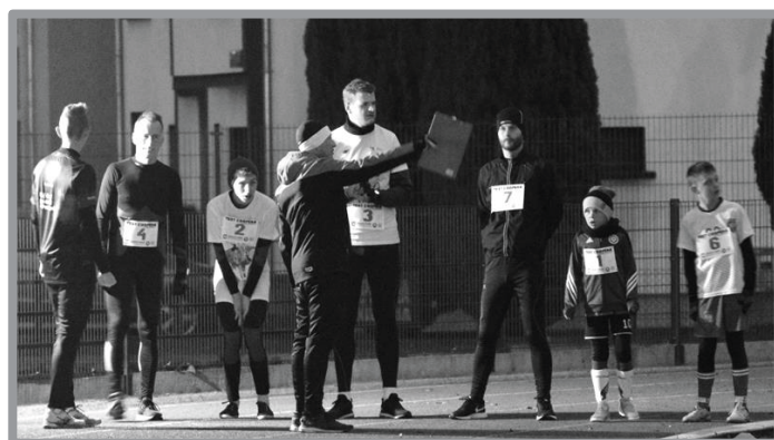
10.11 - SPORTOWY DZIEŃ NIEPODLEGŁOŚCI - TEST COOPERA - JUŻ TRADYCYJNIE W RAMACH ŚWIĘTA NIEPODLEGŁOŚCI