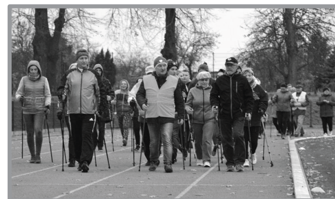
10.11 - SPORTOWY DZIEŃ NIEPODLEGŁOŚCI - NORDIC WALKING - TRADYCYJNIE TRASĄ NOWYCH INWESTYCJI DROGOWYCH