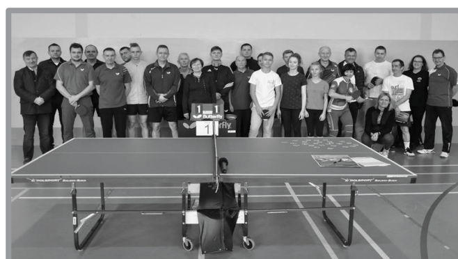
26.11 - XI MISTRZOSTWA GMINY ZBASZYNEK W TENISIE STOŁOWYM O PUCHAR BURMISTRZA - 25 UCZESTNIKÓW NA STARCIE KOLEJNEJ EDYCJI