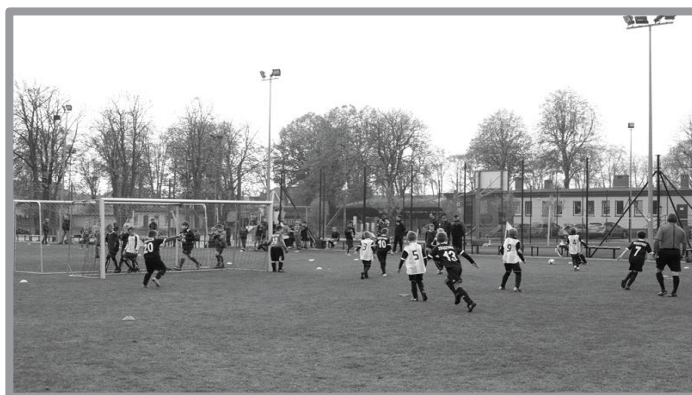
24.10 - POWIATOWE ELIMINACJE TYMBARK - AWANS DO FINAŁÓW WOJEWÓDZKICH DRUŻYN ZE ZBĄSZYNKA