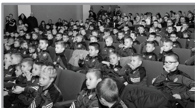
07.12 - MIKOŁAJKOWA AKADEMIA PIŁKARSKA - ŚWIĘTO PIŁKARZY POŁĄCZONE Z MIKOŁAJEM