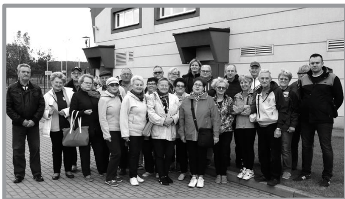
12.10 - SPORTOWY SENIOR 2017 - KRĘGLE - PO RAZ PIERWSZY W BABIMOŚCIE

sportu na terenie Gminy Zbąszynek. O wydarzeniach sportowych w ostatnim kwartale w fotograficznym skrócie.