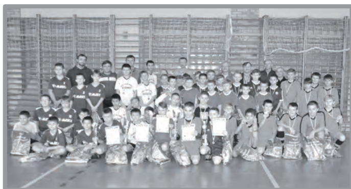
4 GRUDNIA - MIKOŁAJKOWY TURNIEJ PIŁKI NOŻNEJ SZKÓŁ PODSTAWOWYCH - SP DĄBRÓWKA WLKP. ZWYCIĘŻYŁA W TURNIEJU ZORGANIZOWANYM PRZEZ KLUB „SOKÓŁ” DĄBRÓWKA WLKP.