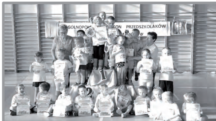
27 PAŹDZIERNIKA - I OGÓLNOPOLSKI MARATON PRZEDSZKOLAKÓW „SPRINTEM DO MARATONU” - KOLEJNA ŚWIETNA INICJATYWA SPORTOWA PRZEDSZKOLA Z KOSIECZYNA