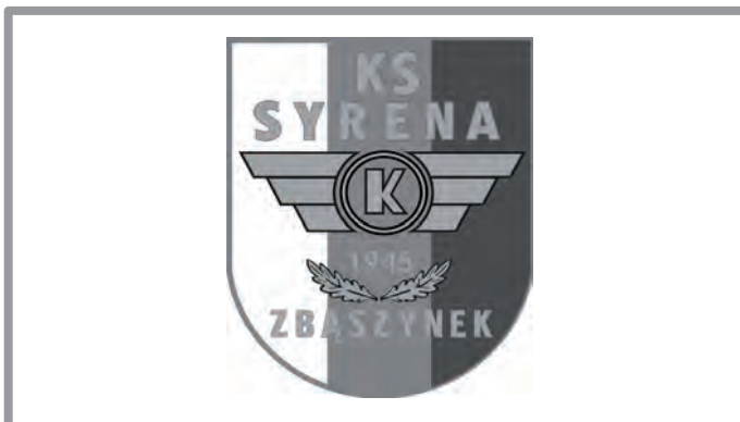
19 GRUDNIA - 70-LECIE POWSTANIA KS „SYRENA” ZBĄSZYNEK - KAMERALNA IMPREZA ŚRODOWISKA PIŁKARSKIEGO ZE ZBĄSZYNKA