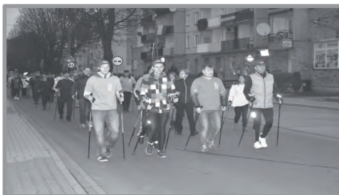
10 LISTOPADA - SPORTOWY DZIEŃ NIEPODLEGŁOŚCI - POŁĄCZENIE MARSZU NORDIC WALKING ORAZ TESTU COOPERA