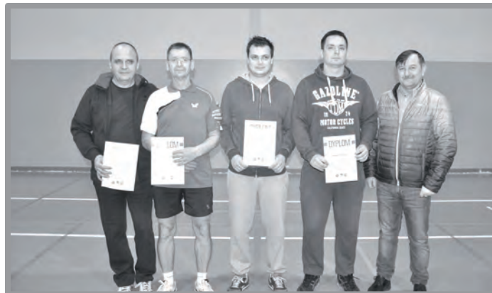
29 LISTOPADA - I TURNIEJ TENISA STOŁOWEGO - W INAUGURACYJNYM TURNIEJU WYSTARTOWAŁO 16 UCZESTNIKÓW