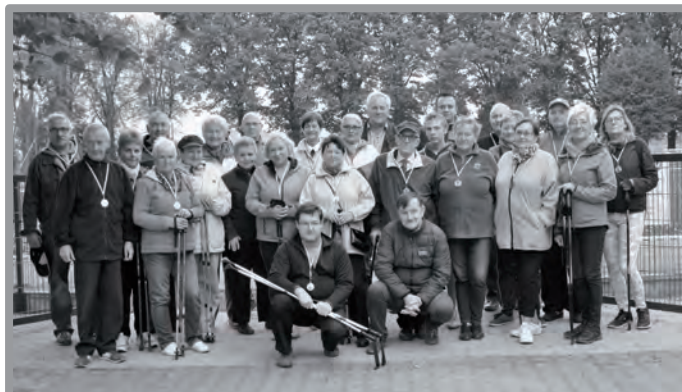
7 PAŹDZIERNIKA - GMINNY MARSZ SENIORA - PONAD 20 SENIORÓW PRZETESTOWAŁO NOWĄ BIEŻNIĘ