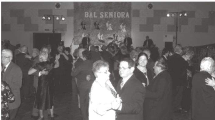
Seniorzy w naszej gminie bawili się wyśmienicie