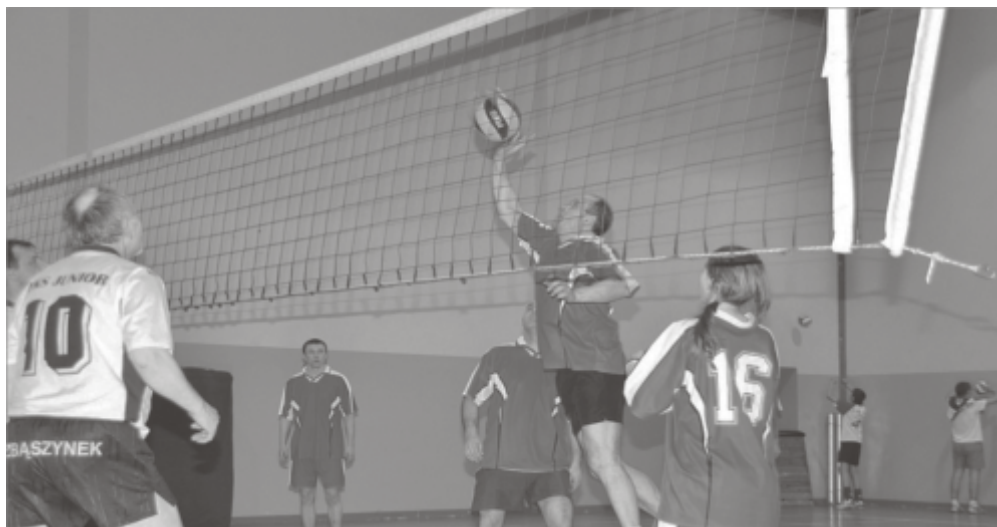
Siatkarze walczyli o każdą piłkę