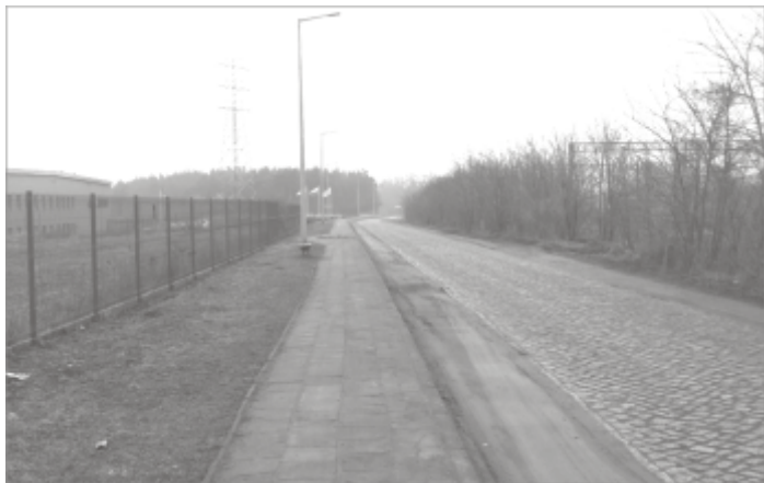
Ulica PCK przed remontem

Kolejnym zadaniem z branży drogowej, które będzie realizowane w bieżącym roku jest przebudowa ulicy PCK w Zbąszynku – Etap II. Przedmiotem projektu jest przebudowa ulicy PCK na odcinku od ulicy Kasprowicza