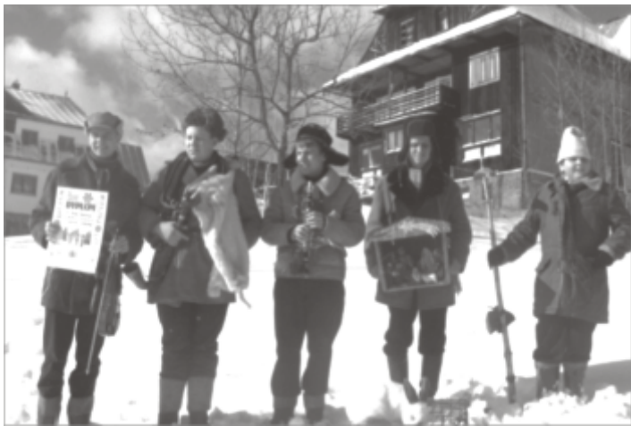
Zespół „Kolędnicy Grocze” z nagrodą

Podczas 39' Karnawału Góralskiego doceniono młodych muzyków z Dąbrówki Wielkopolskiej. Konkurs odbył się w dniach od 9-13 lutego w Bukowinie Tatrzańskiej. Młodzi muzycy tworzący zespół „Kolędnicy Grocze” przedstawili słowno-muzyczną scenkę, za którą zostali nagrodzeni brązową rozetą góralską oraz dyplomem. Zdobyta nagroda jest wielką zachętą dla młodzieży do dalszej pracy i promowania rodzimego folkloru.