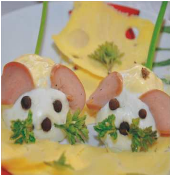
Jedna z dekoracji świątecznych VII Jarmarku z Jajem