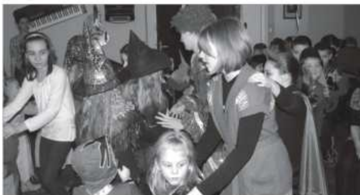
Zabawy z klaunem

magii i iluzji na sali widowiskowej w Domu Kultury. W środę odbył się kolejny wyjazd do Zielonej Góry na basen. W czwartek w bibliotece w Zbąszynku zorganizowano konkurs na logo OKSiRu. Tegoroczne ferie zakończyły się turniejem piłki nożnej w Dąbrowce Wlkp. w którym wzięło udział pięć zespołów, a wygrała drużyna „Jest moc”.