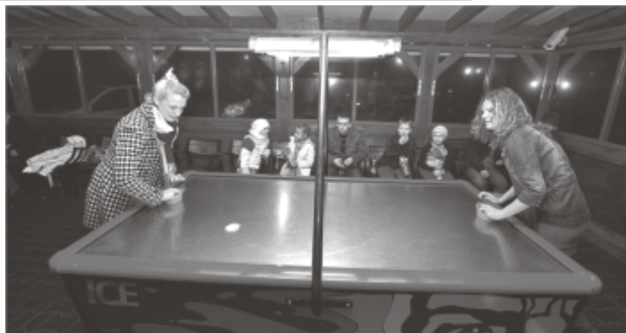
W turnieju w cymbergaja brały udział również kobiety