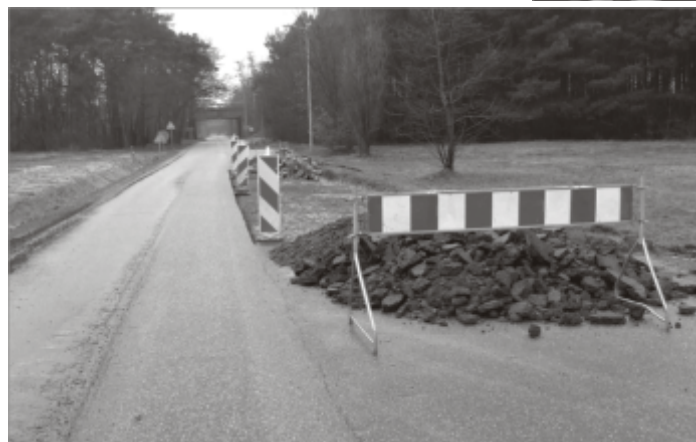
Bieżące prace remontowe

uszkodzenia pojazdów. Obecnie panujące warunki atmosferyczne nie sprzyjają szybkiemu usunięciu wszystkich uszkodzeń nawierzchni dróg, dlatego też remonty tych dróg prowadzone są w miarę jak pozwalają na to warunki pogodowe. W marcu zlecono wykonanie naprawy najbardziej uszkodzonych miejsc, a w kwietniu będą prowadzone dalsze naprawy uszkodzonych nawierzchni dróg i ulic.