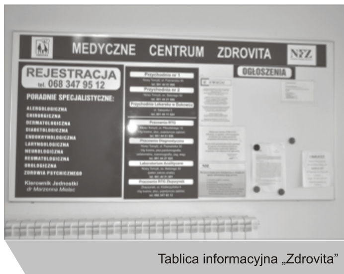
Tablica informacyjna „Zdrovita”

zarządem firmy i nie powinno być już z tym kłopotu. Mamy świadomość, że oferta ta nie zadawała wszystkich pacjentów. Z drugiej jednak strony musimy pamiętać, że jesteśmy małą gminą i trudno jest nam rywalizować z ofertami dużych ośrodków. Pomimo to uzgodniliśmy z Medycznym Centrum „Zdrovita” rozszerzenie oferty na lekarza onkologa i kardiologa. Wszystko zależy jednak od Lubuskiego Oddziału NFZ. Wszystko wyjaśni się po rozstrzygnięciu konkursu na świadczenia specjalistyczne.