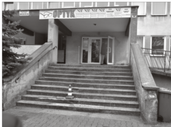
Stan obecny wejścia do przychodni przy ul. Długiej

Gmina Zbąszynek zarządza trzema obiektami, w których świadczone są usługi medyczne. W obiekcie przy ul. Długiej 1 usługi medyczne świadczy pięciu lekarzy podstawowej opieki zdrowotnej, dwóch lekarzy stomatologów, podstacja Pogotowia Ratunkowego, laboratorium medyczne. W budynku przy ul. Kosieczyńskiej 4 na stan obecny działalność prowadzi dwa podmioty gospodarcze. Medyczne Centrum „Zdrovita” oraz NZOZ Ewa-Med. Centrum Rehabilitacyjne. Natomiast w budynku po byłym internacie technikum leśnego w Rogozińcu, Fundacja Pomocy Dzieciom Niepełnosprawnym „Leśna Kraina”