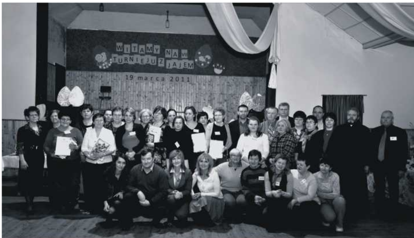
Uczestnicy „Jarmarku z jajem”