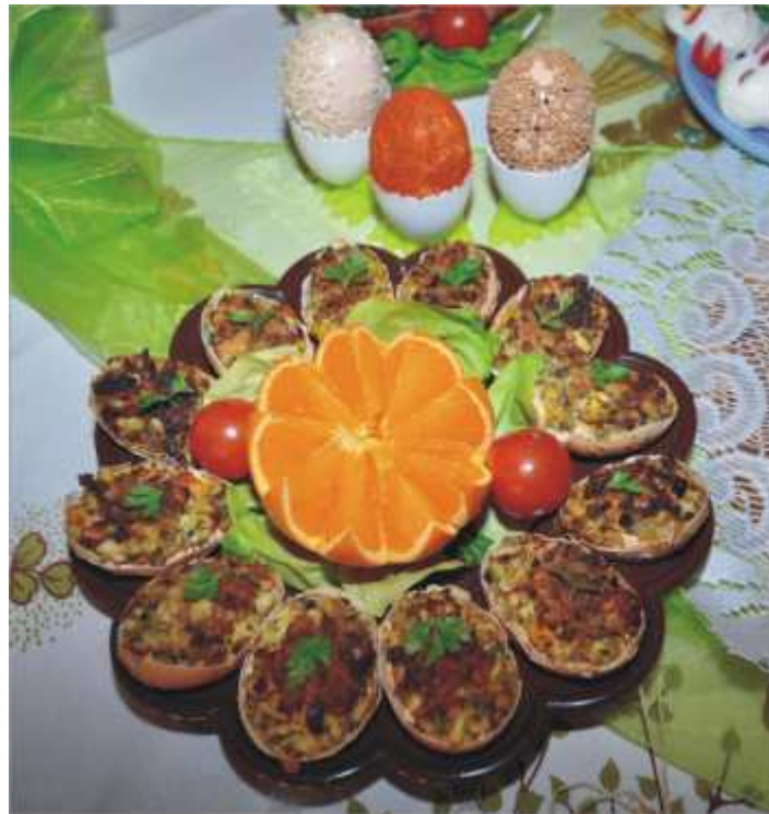
Półmisek jaj faszerowanych przygotowanych przez Koło Gospodyń Wiejskich z Dąbrówki Wilkp.