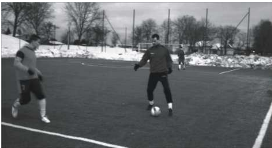
Zawodnik drużyny „Abstynentów” przy piłce

Do turnieju zgłosiło się sześć zespołów – w tym jeden spoza Gminy Zbąszynek. Najlepiej w zawodach poradziła sobie drużyna „ Abstynenci ”, która wygrała wszystkie swoje pojedynki. Drugie miejsce zajął „ Olimp ” Kręcisko , który wyprzedził ekipę „ Wielkie Jo! ”. Tuż za podium znalazły się drużyny „ UKS Junior ”, „ Axxion ” oraz „ Chrobry ” Brójce .