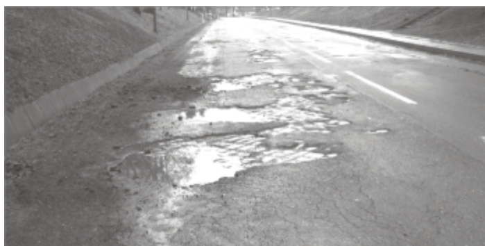
Pozimowe uszkodzenia dróg

Na terenie miasta i gminy Zbąszynek mijająca zima przysporzyła wiele kłopotów i utrudnień mieszkańcom oraz wszystkim użytkownikom dróg. Zima była wyjątkowo uciążliwa, duże opady śniegu w grudniu i niskie temperatury w styczniu nie sprzyjały zarówno pieszym jak i uczestnikom ruchu drogowego. Nawierzchnie dróg i ulic w mijającej zimie uległy znacznemu uszkodzeniu. Bardzo zmienne warunki atmosferyczne spowodowały znaczne ich uszkodzenia, które były i są dużym utrudnieniem dla uczestników ruchu drogowego. Ubytki masy asfaltowej (dziury w jezdni) powstałe w wyniku zmian temperatury w dzień dodatnie przy opadach deszczu ze śniegiem, a w nocy ujemne, były przyczyną wielu uszkodzeń pojazdów samochodowych i niegroźnych kolizji. Kierowcy zmuszeni byli do wzmożonej ostrożności w celu uniknięcia