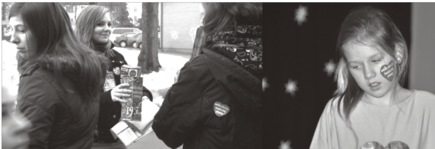
Mieszkańcy tradycyjnie „zagrali dla Orkiestry”

naszego finału było wypuszczenie światełka do nieba. Dziękujemy także wszystkim sponsorom za przekazanie przedmiotów na licytację oraz wszystkim tym, którzy pomogli w zorganizowaniu Finału.