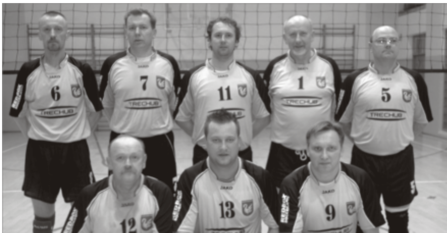
Zwycięska drużyna TRECHUB