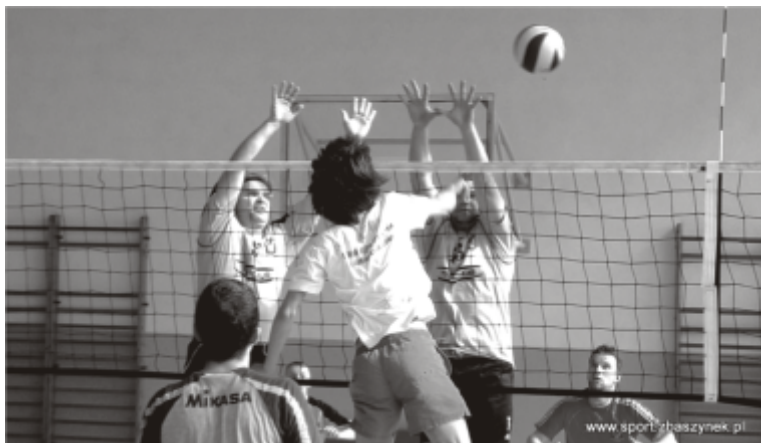
Wysoki poziom zaprezentowali zawodnicy podczas turnieju siatkarskiego Regionu Kozła

13 marca 2011 r. odbył się Turniej Siatkarski Gmin Regionu Kozła. W turnieju wzięło udział sześć drużyn: Zbąszynek, Zbąszyń, Siedlec, Trzciel, Babimost i Miedzichowo.