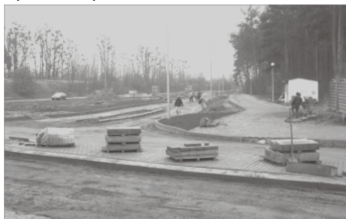
Prace w okolicach cmentarza

warunkach atmosferycznych (ma to związek z procesem wytwarzania surowców niezbędnych do wykonywania robót, oraz warunkami w jakich można je stosować tj. wilgotność gruntu, która badana jest za pomocą specjalnej sondy, a także stopień zamrznięcia gruntu, itp.). Jeśli prace będą realizowane w dalszym ciągu na bieżąco, to w kwietniu będą wykonywane roboty o charakterze typowo wykończeniowym.