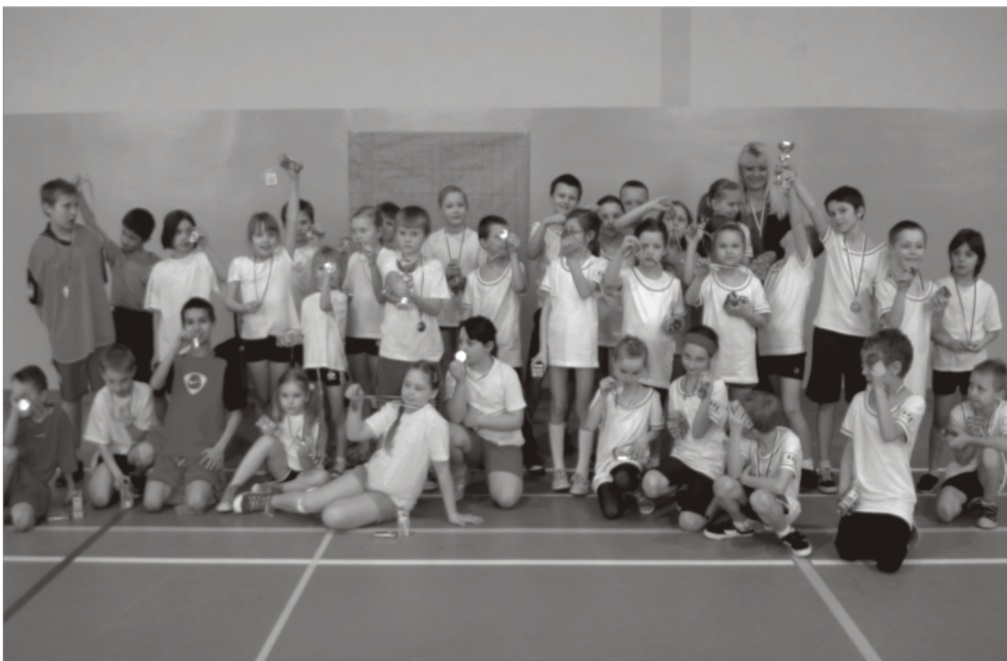
Każdy uczestnik zabawy otrzymał medal i słodki poczęstunek

Konkurencje dostarczyły dzieciom wielu pozytywnych emocji, a po zawodach każdy otrzymał medal i słodki poczęstunek.