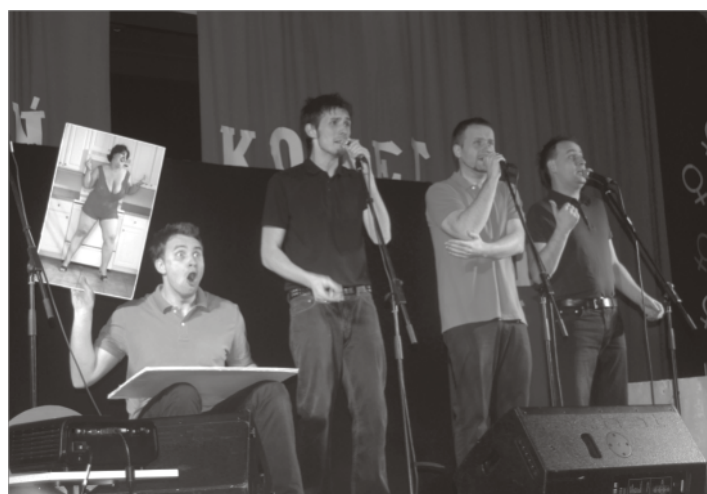
„Kabaret Skeczów Męczących” podczas występu