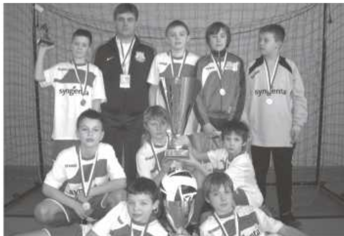
Drużyna UKS Junior wraz z trenerem

UKS Junior Zbąszynek wygrał Ogólnopolski Turniej Piłki Nożnej "SYNGENTA CUP". Najpierw pewnie wygrał w turniejowej grupie, a następnie w półfinałach pokonał rywali dzięki rzutom karnym. W finałowym pojedynku zmierzył się z drużyną „Sparty” Sycewice. Po zaciętym boju nasi piłkarze zeszli z boiska jako zwycięzcy! Dwie bramki więcej od przeciwnika dały nam upragnione zwycięstwo!