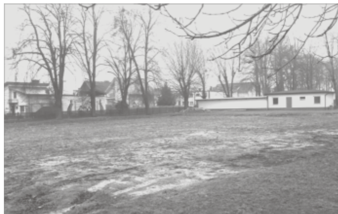
Miejsce w którym powstanie hala sportowa

biurowe, salę szkoleniową itp. W projektowanym rozwiązaniu przewidziano również pokoje z węzłami sanitarnymi pod potrzeby noclegowe. Projekt zostanie przekazany Gminie w terminie do 15 kwietnia br. Następnie będą czynione starania o pozyskanie środków zewnętrznych na realizację inwestycji.