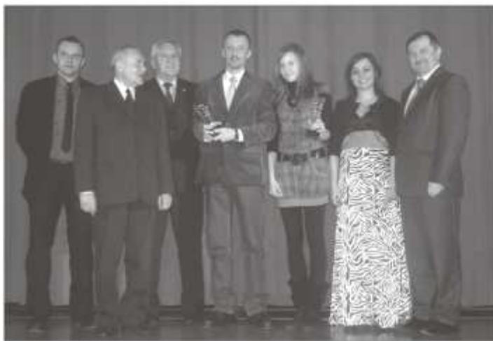
Pamiętkowe zdjęcie po Gali Sportu