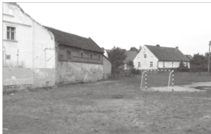
Miejsce budowy kompleksu sportowo-rekreacyjnego