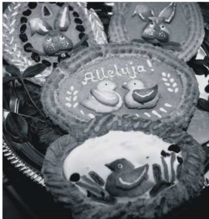
Wypieki prezentowane przez koła gospodyń