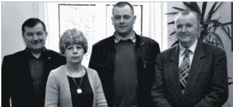
Zwycięzcy krzyżówkowej zabawy