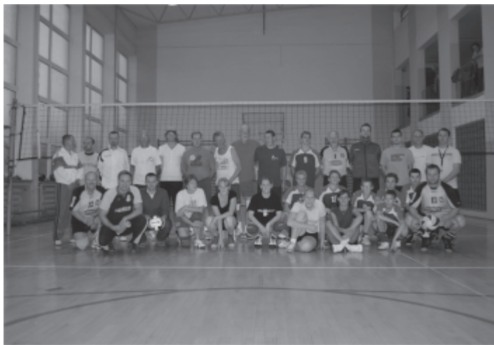
Pamiątkowe zdjęcie uczestników turnieju

W piątek 10 września odbył się towarzyski turniej piłki siatkowej z udziałem zaprzyjaźnionej drużyny z Bedum z