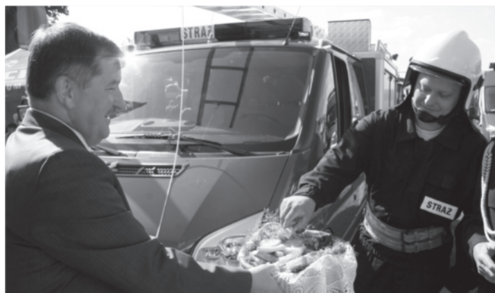
Burmistrz częstuje strażaków chlebem dożynkowym