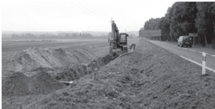
Budowa kanalizacji i wodociągu w Kręcku

Trwają roboty przy realizacji projektu pn. Uporządkowanie gospodarki wodno ściekowej na terenie gminy Zbąszynek – projekt zasadniczy i projekt wsparcia. Roboty są prowadzone na terenie wsi Kręcko, na odcinku