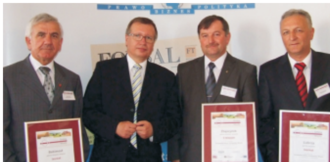
Burmistrz Zbąszynka wśród laureatów Konkursu

Reasumując, jest to więc wielki sukces zbąszyneckiego samorządu , w województwie lubuskim jesteśmy na pierwszym miejscu i jako mieszkańcy Gminy Zbąszynek możemy być dumni z tego osiągnięcia. Jest to także wielka motywacja do dalszej wyłożonej pracy na rzecz rozwoju Naszej Gminy.