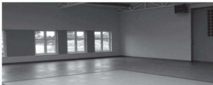
Centrum Kultury i Folkloru w Dąbrówce Wlkp. gotowe do użytkowania