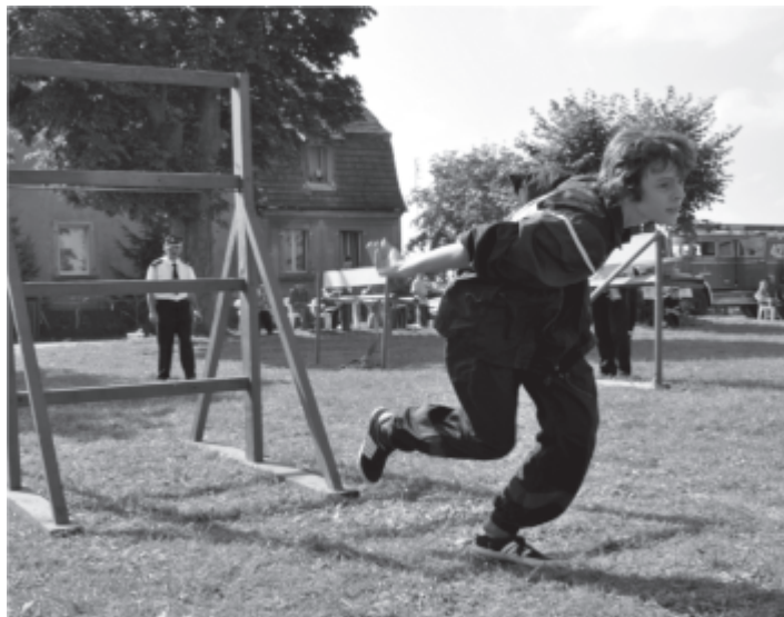
Zawody sportowe - pożarnicze w Kręcku

11 września w Kręcku odbyły się Partnerskie Zawody Sportowo-Pożarnicze Młodzieżowych Drużyn Pożarniczych. W zawodach udział wzięły drużyny z Kręcka, Kosieczyna, Dąbrówki Wielkopolskiej oraz Rogozińca. Wśród dziewcząt zwyciężyła drużyna z Dąbrówki Wielkopolskiej, natomiast wśród chłopców najlepszy okazał się Kosieczyn.