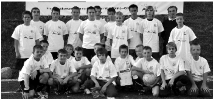
Uczestnicy turnieju o puchar Premiera Donalda Tuska

W dniach 15 – 16 września na kompleksie sportowym „Orlik” w Zbąszynku rozegrano eliminacje gminne w ramach