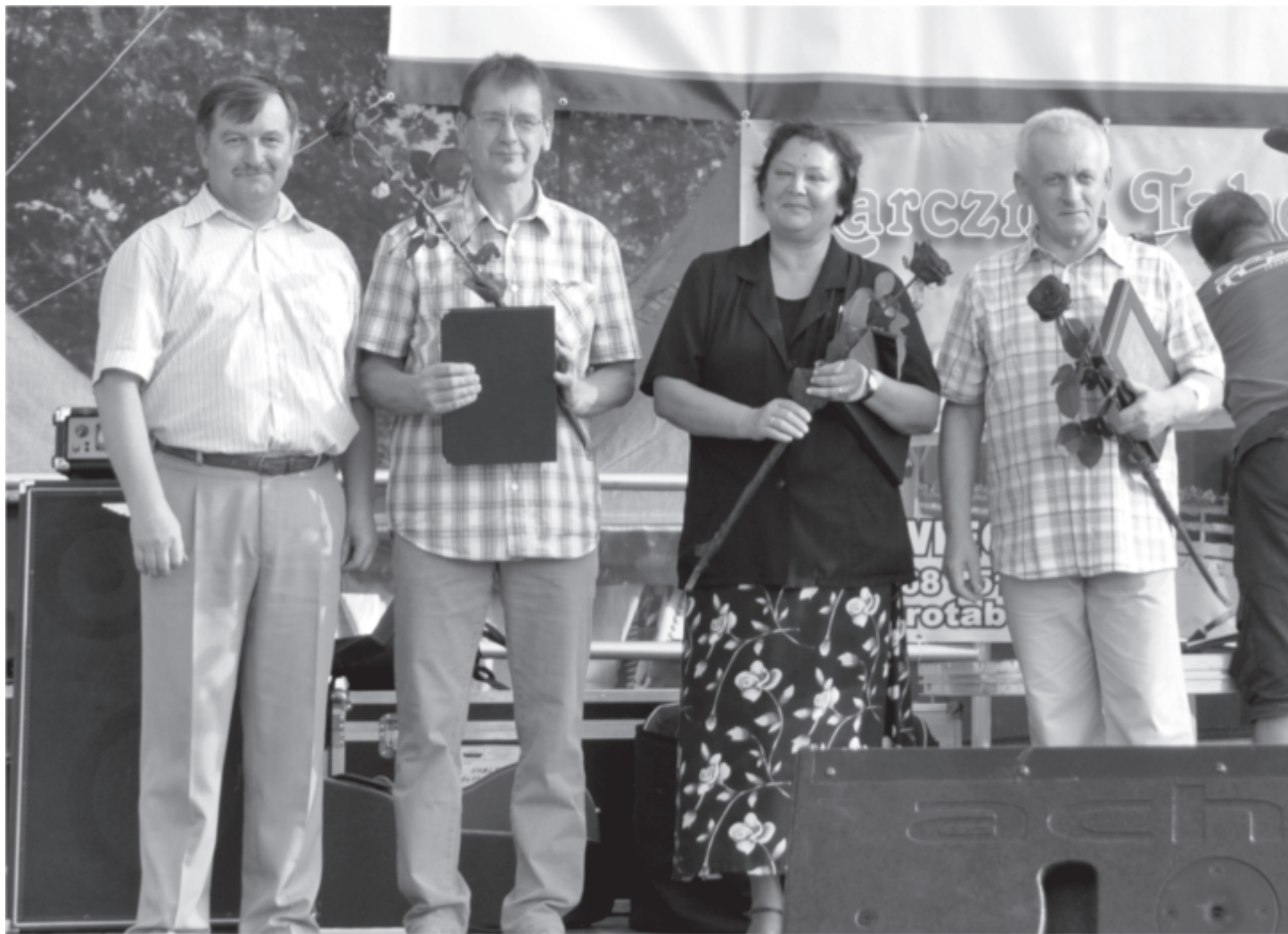
Nowi zasłużeni dla Gminy Zbąszynek

dla Związku Harcerstwa Polskiego. Z pełną treścią Zarządzeń Burmistrza Zbąszynka dotyczących nadania tytułu „Zasłużony dla Gminy Zbąszynek” mogą się Państwo zapoznać na stronie Biuletynu Informacji Publicznej pod adresem: www.bip.zbaszynek.pl w zakładce: Zarządzenia Burmistrza - V kadencja 2006-2010- Rok 2010 – Zarządzenia Numer 43, 44 i 45/2010 z dnia 2 sierpnia 2010 roku.