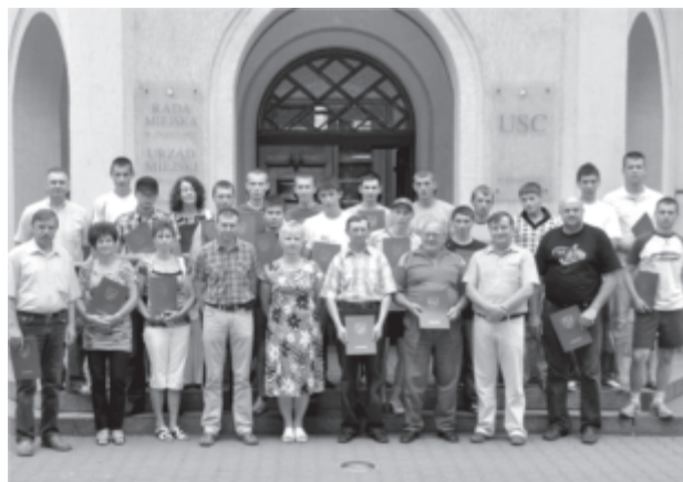
Studenci z Ukrainy - zdjęcie pamiątkowe

Podczas spotkania Burmistrz Zbąszynka wręczył studentom zaświadczenia o ukończeniu praktyk, natomiast osobom goszczącym uczniów w swoich domach, podczas ich 2-tygodniowego pobytu, wręczono pisemne podziękowania za okazaną życzliwość i gościnę. Współpraca z rolniczym koledżem w Stryju trwa od 1996 roku, kiedy to po raz pierwszy Gmina Zbąszynek gościła grupę studentów na praktykach zawodowych. Z roku na rok zawierane znajomości i przyjaźnie pogłębiają się, co pozytywnie wpływa na rozwój współpracy między naszymi miastami.