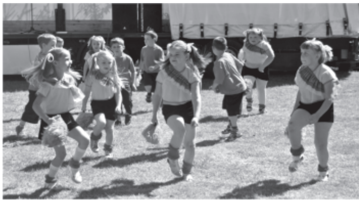
Zespół dziecięcy z Kosieczyna