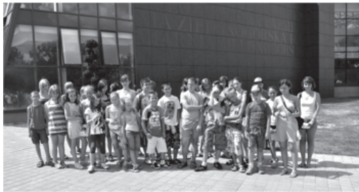
Uczestnicy „podróży marzeń”

Od 05 do 16 lipca odbywały się zajęcia gry na instrumentach muzycznych. Największym zainteresowaniem cieszyła się perkusja, pozostałe instrumenty to gitara i pianino.