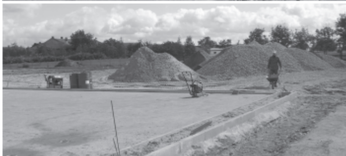
Kompleks sportowy „ORLIK”

wykonano prace związane z odwodnieniem i utwardzeniem powierzchni boisk, ustawiono obrzeża betonowe, rozprowadzono instalację elektryczną do oświetlenia kompleksu, przygotowano miejsca do montażu wyposażenia boisk (m.in. bramek, słupów do koszykówki i siatkówki, itp.).