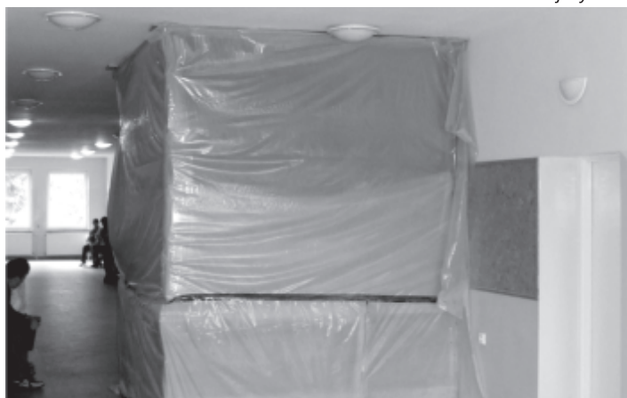
Montaż windy w ośrodku zdrowia