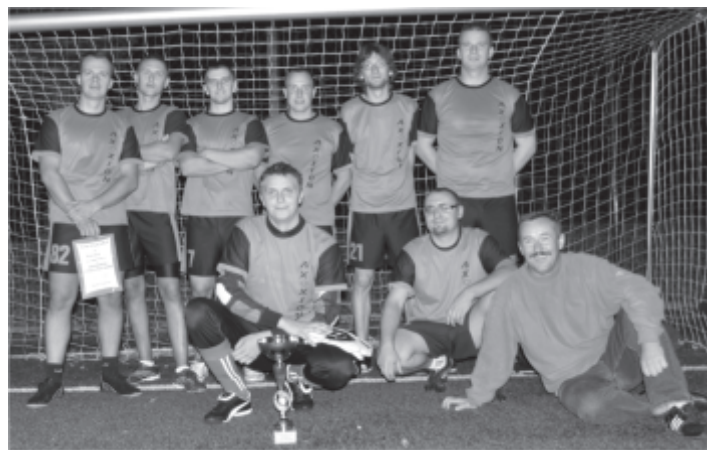
AXXION najlepszą drużyną turnieju

27 sierpnia na kompleksie sportowym „Orlik” w