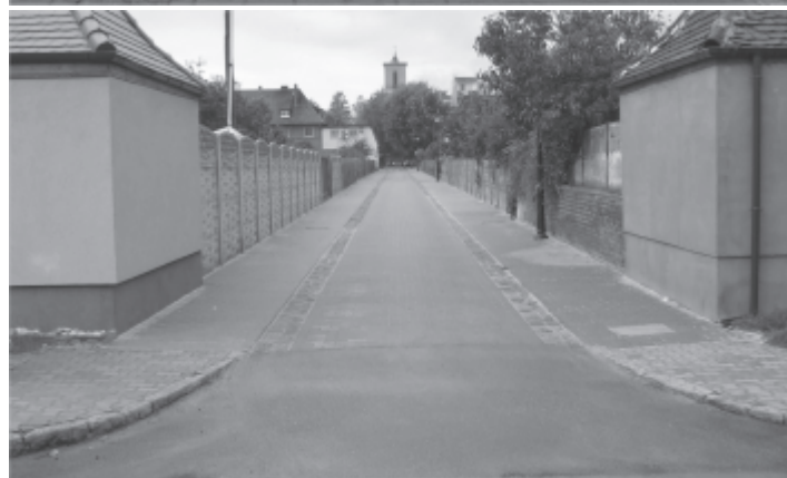
ul. Wąska - po zakończonym remoncie

remontu wykorzystano materiał rozbiórkowy z ulicy PCK i wymurowano z kostki granitowej ciekie wodne na tej ulicy. Wyremontowana ulica zyskała nowy atrakcyjny wygląd, a obecny jej stan znacznie poprawił bezpieczeństwo ruchu drogowego. W miejsce starych słupów oświetlenia drogowego zostały zamontowane nowe estetyczne słupy metalowe, które z pewnością, wraz z nową nawierzchnią ulicy poprawiają estetykę tej części miasta. Kolejna ulica w mieście została wyremontowana i oddana do użytku. Mieszkańcy mogą teraz bezpiecznie i wygodnie poruszać się po tej ulicy.