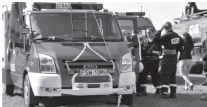
Nowy samochód dla OSP Kosieczyn