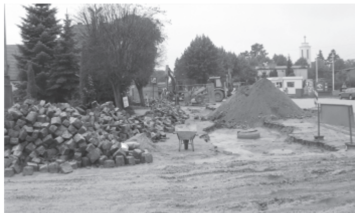
Modernizacja Kanalizacji oraz nawierzchni ulicy PCK

eksploatowanie tej drogi. Przebudowa ulicy PCK wraz z budową kolektora tłoczno-kanalizacji sanitarnej, od parkingu przy ul. Kosieczyskiej do skrzyżowania z ulicą Kasprowicza, oraz odcinka kanalizacji deszczowej, zbliża się do końca. Niestety długotrwałe opady deszczu znacznie utrudniły prowadzenie tych prac. Dlatego termin zakończenia nieznacznie oddalił się w czasie. Do wydłużenia terminu zakończenia modernizacji tej ulicy przyczyniły się również napotykanne przeszkody, których nie można było wcześniej przewidzieć tj. m. in. nie zinwentaryzowane różnego rodzaju kolejowe instalacje kablowe, oraz różnego rodzaju podłączenia wodne i kanalizacyjne (o których nikt wcześniej nic nie wiedział). Napotkane przeszkody zmusiły wykonawców do prowadzenia wielu wykopów ręcznie. Wykonawcą części drogowej jest firma PRID z Nowego Tomysła, a części sanitarnej firma BRUBET z Międzyrzecza. Prace związane z przebudową tej ulicy znacznie utrudniają ruch drogowy w tej części miasta, ale po zakończeniu całej inwestycji wszyscy mieszkańcy i użytkownicy tej ulicy odczują znaczną poprawę w ruchu drogowym i pieszym, a miasto będzie już wszystkie swoje ścieki sanitarne kierowało do oczyszczalni ścieków. Przebudowana ulica pozwoli w znacznym stopniu zwiększyć bezpieczeństwo uczestników ruchu drogowego w tej części miasta.