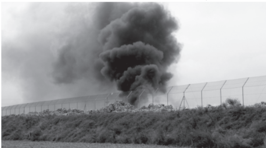
Pożar w firmie „WEXPOOL”