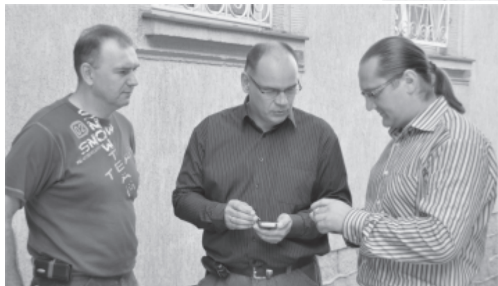
Lider i rachmistrzowie spisowi

W okresie od 8 września do 31 października br. użytkownicy gospodarstw rolnych, którzy wcześniej nie dokonali tzw. samospisu lub nie spisali się poprzez wywiad telefoniczny, są odwiedzani przez gminnych rachmistrzów spisowych. Rachmistrz spisowy musi nosić w widocznym