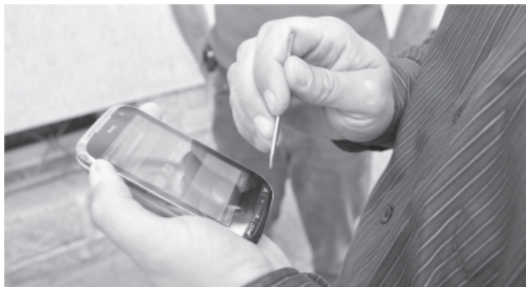
Elektroniczne urządzenie spisowe

Udzielenie odpowiedzi na spisowe pytania ankietowe jest obowiązkowe. Obowiązek ten wynika z § 1 Rozporządzenia Parlamentu Europejskiego i Rady (WE) Nr 1166/2008 z dnia 19 listopada 2008 r. w sprawie badań struktury gospodarstw rolnych i badania metod produkcji rolnej oraz uchylające rozporządzenie Rady (EWG) nr 571/88. Obowiązek udzielania odpowiedzi wynika również z ustawy o powszechnym spisie rolnym, przywołanej w § 1, ust. 1, pkt 2. Użytkownicy gospodarstw rolnych osób fizycznych, a w razie ich nieobecności inne pełnoletnie osoby w gospodarstwie domowym, obowiązani są do udzielenia ścisłych, wyczerpujących i zgodnych z prawdą odpowiedzi na pytania zawarte w formularzu spisowym. Udzielenie odpowiedzi niezgodnych ze stanem faktycznym oraz odmowa udzielenia odpowiedzi pociągają za sobą skutki prawne przewidziane w przepisach art. 56 i 57 ustawy o statystyce publicznej. Ze swej strony proszę wszystkich o przychylnie przyjęcie w swoich domach rachmistrzów oraz udzielenie im wyczerpujących odpowiedzi.