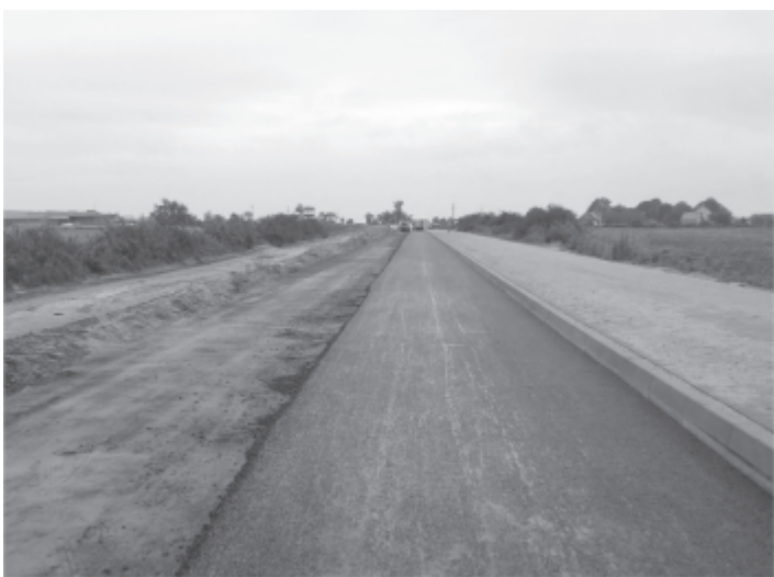
Północna Obwodnica Zbąszynka - etap I

zadeklarował, że roboty drogowe zostaną zakończone jeszcze w tym roku. Obecnie trwają prace polegające na zakończeniu budowy ciągu pieszo-rowerowego na całym odcinku budowanej obwodnicy, wykonaniu podbudowy pod budowaną częścią jezdnią drogi w celu położenia pierwszej warstwy masy bitumicznej. Wykonawca robót został również zobowiązany do zakończenia prac drogowych w okolicy cmentarza do końca października, w celu umożliwienia w miarę bezpiecznego i wygodnego dojazdu do cmentarza jeszcze przed 1 listopada. Wszystkie prace prowadzone są zgodnie z wcześniej przyjętym harmonogramem. Wszystko wskazuje na to, że inwestycja zostanie zakończona przed wcześniej ustalonym terminem i drogę przekazać będzie można do użytkowania. Nowo wybudowana obwodnica w bardzo znacznym stopniu poprawi bezpieczeństwo ruchu drogowego i odciążą ulice Zbąszynka od ciężkiego transportu samochodowego. Będzie główną drogą dojazdową do terenów inwestycyjnych i zakładów produkcyjnych.