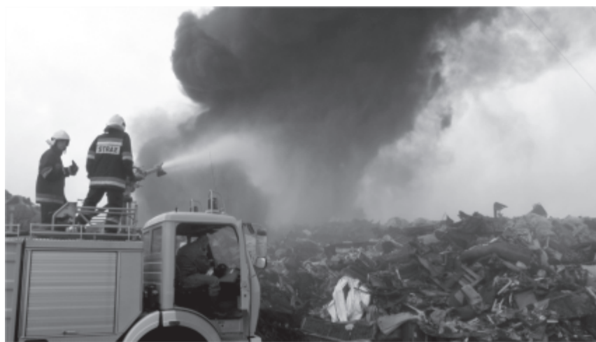
Strażacy OSP w akcji

W historii powiatu świebodzińskiego były to najdłuższe i najbardziej nietypowe działania gaśnicze, angażujące 60 strażaków Państwowej Straży Pożarnej oraz 227 strażaków-ochotników. Wykorzystano 72 samochody strażackie, w tym 52 Ochotniczych Straży Pożarnych z terenu województwa lubuskiego. Środkami gaśniczymi były: woda i środek pianotwórczy w ilości ok. 950 m 3 . W gaszeniu pożaru czynnie uczestniczył zakład WEXPOOL, udostępniając ciężki sprzęt transportowo-załadunkowy, obsługiwany przez pracowników firmy oraz zapewniając wyżywienie i pomieszczenia socjalne uczestnikom akcji. Produkcję wznowiono 3 września, umożliwiając przystąpienie do pracy 64 pracownikom.