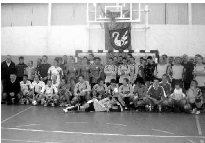
Halowy Turniej Piłki Nożnej o Puchar Prezesa KS Syrena

16 stycznia zainaugurowano obchody 65-lecia istnienia klubu sportowego „Syrena” Zbąszynek w ramach Projektu Syrena 1945-2010. Na zaproszenie Klubu w Halowym Turnieju Piłki Nożnej o Puchar Prezesa KS „Syrena” wystąpiły piłkarskie zespoły z terenu Gminy Zbąszynek. 8 zespołów (łącznie około 50 uczestników) rozgrywało spotkania w dwóch grupach systemem „każdy z każdym”. W spotkaniach ćwierćfinałowych Sokół I zwyciężył Znicz I 4:1, w takim stosunku Syrena pokonała TKKF, w trzecim ćwierćfinale Sokół II pokonał UKS Junior 2:1, a ostatnim półfinalistą okazał się zespół Znicza II pokonując Olimp 4:2. W spotkaniach półfinałowych Sokół I pokonał Sokół II 3:1, a Syrena zwyciężyła Znicz II 4:1. W meczu o trzecie miejsce Sokół II pokonał Znicz II 2:1, natomiast w pojedynku finałowym Sokół pokonał Syrenę 3:2. Patronat Honorowy nad Jubileuszem objął Burmistrz Zbąszynka Wiesław Czyczerski. Organizatorem turnieju był Ośrodek Sportowo – Rekreacyjny OKSiR oraz MKS Syrena Zbąszynek.