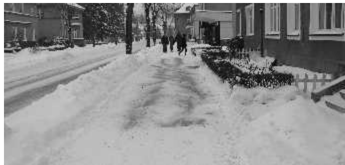
Zima 2009 / 2010

że jeżeli wszyscy będziemy się poczuwali do nałożonych na nas ustawowych obowiązków, to żadna zima nie będzie dla nas zbyt trudna do przeżycia.