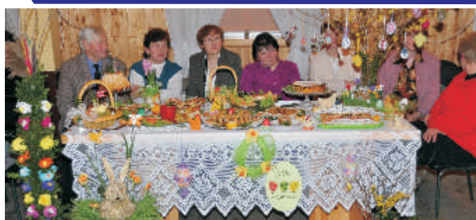
Stół Wielkanocny przygotowany przez KGW Ojercyze