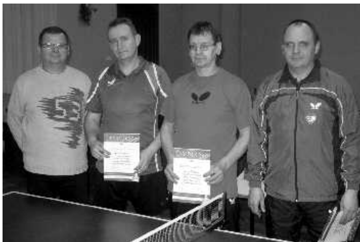
Tenis stołowy Kosieczyn styczeń 2010