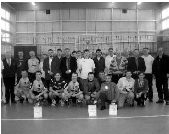
Turniej Piłki Siatkowej z okazji 65-lecia Syrena