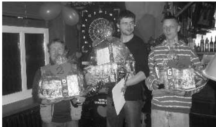
Zwycięscy turnieju DARTA

otrzymali puchary, dyplomy i nagrody rzeczowe ufundowane przez właścicieli Bodo. Dodatkową atrakcją był specjalny ekran, na którym uczestnicy mogli oglądać rozgrywane pojedynki.