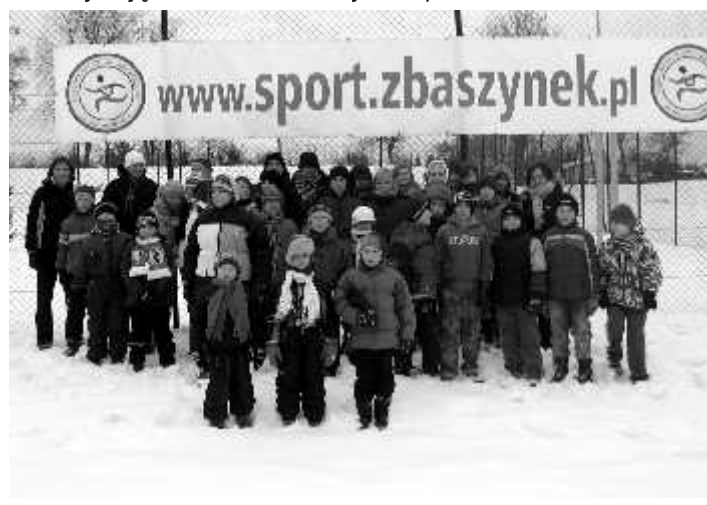
Projekt Sportowe Ferie

W okresie od 18 do 21 stycznia realizowano Projekt Sportowe Ferie . Na terenie szkół całej Gminy w godzinach popołudniowych odbywały się zajęcia sportowe, natomiast popołudniami na terenie Ośrodka Sportowo-Rekreacyjnego wszyscy chętni mogli skorzystać z szerokiej oferty gier planszowych. Największą atrakcją ferii był kulig połączony z ogniskiem i smażeniem kiełbasek. Dzięki dofinansowaniu ferii przez Burmistrza oraz Gminną Komisję Rozwiązywania Problemów Alkoholowych wszystkie zajęcia były nieodpłatne. Podziękowania należą się również Dyrektorom Szkół za udostępnienie sal. Organizatorem ferii był Ośrodek Sportowo-Rekreacyjny OKSiR oraz UKS Junior Zbąszynek. Z oferty zajęć codziennie korzystało ponad 50 uczestników.