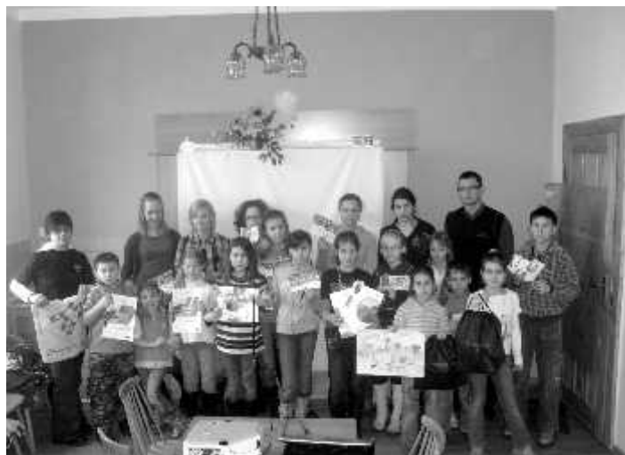
Ferie z Kulturą w Zbąszynku