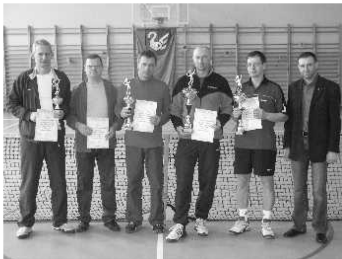
Uczestnicy I Wiosennego Turnieju Tenisa Ziemnego

Gminy zawodnicy mogli po raz pierwszy spróbować swoich sił w rozgrywkach halowych. Gratulujemy wszystkim uczestnikom.