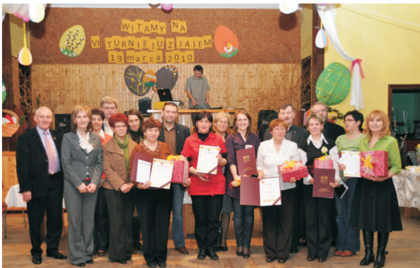
Pamiątkowe zdjęcie uczestników VI Jarmarku Wielkanocnego