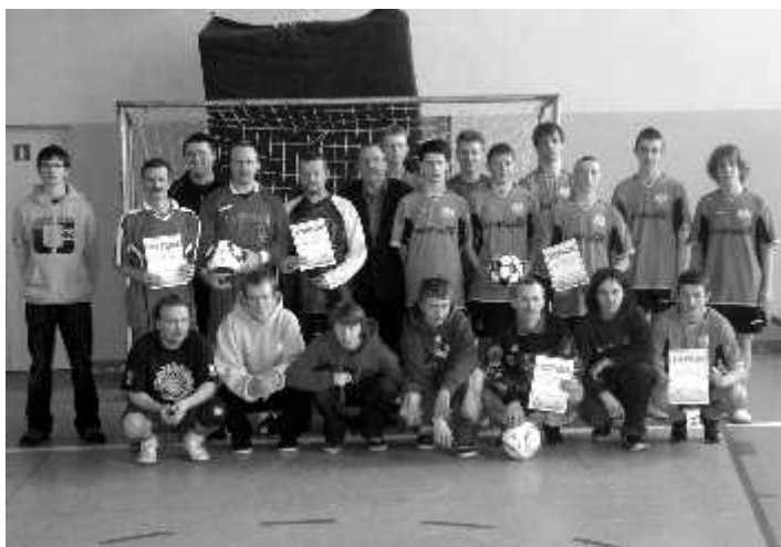
Walentynkowy Turniej Piłki Nożnej

13 lutego w Kosieczynie rozegrano I Walentynkowy Turniej Piłki Nożnej . Na zaproszenie organizatorów LZS Znicz oraz Rady Sołeckiej z Kosieczyna wystąpiło 5 zespołów z terenu Gminy Zbąszynek. Najlepszy okazał się zespół UKS Junior Zbąszynek.