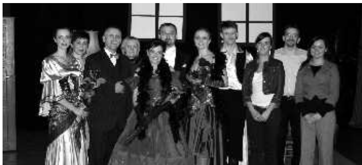
Pamiątkowe zdjęcie z zespołem Aquartet z Katowic