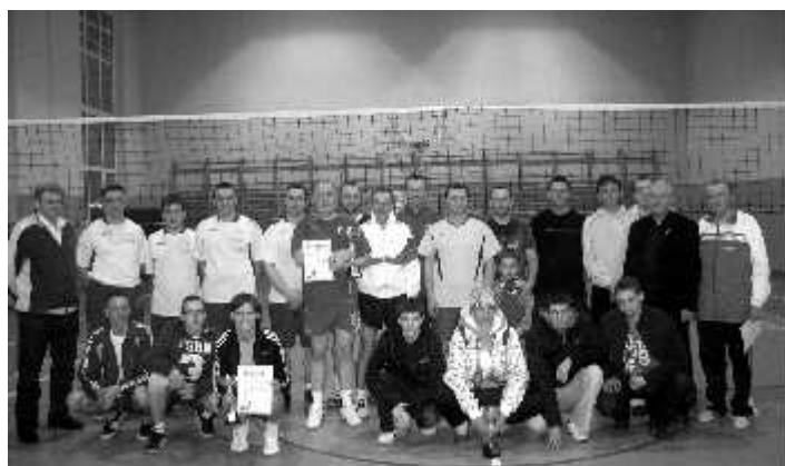
Turniej Siatkówki o Puchar Przewodniczącego Rady Miejskiej