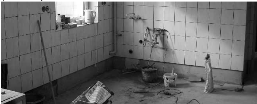
Remont zaplecza kuchennego sali wiejskiej w Kręcku

Trwa remont sali wiejskiej w Kręcku. W ramach prac remontowych zostaną odnowione pomieszczenia zaplecza kuchennego. Zakres obejmuje wymianę okien, drzwi wejściowych, wymianę instalacji elektrycznej, ułożenie glazury na ścianach i podłogach. Zostaną odmalowane powierzchnie ścian i sufitów oraz zamontowane będą nowe grzejniki elektryczne. Zakończenie prac planowane jest na koniec marca br.