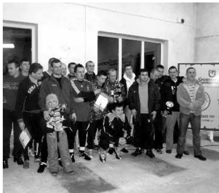
Sylwester Turniej Piłki Nożnej