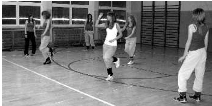
Zespół FLOW ze Zbąszynka