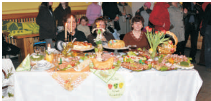
Stół Wielkanocny przygotowany przez KGW Nowe Kramsko