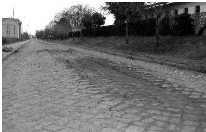
Zniszczona nawierzchnia na ulicy PCK

Nawierzchnia ulicy PCK w Zbąszynku w drugiej połowie lutego i później w II połowie marca została w bardzo dużym stopniu zdeformowana i zniszczona w związku z niesprzyjającymi warunkami atmosferycznymi i dużym natężeniem ruchu samochodów ciężarowych. W jednym momencie ulica ta stała się nieprzejezdna i kilka samochodów uległo uszkodzeniu. Zmuszeni byliśmy w trybie pilnym wykonać naprawę tego odcinka ulicy, mimo iż planowana jest jej całkowita przebudowa. W maju br. na ulicy tej prowadzona będzie inwestycja pn. Przebudowa ulicy PCK wraz z budową kanalizacji burzowej i kolektora kanalizacji sanitarnej. Wartość całej inwestycji to ok. 4 mln zł. Zadanie to będzie dofinansowane ze środków Narodowego Programu Przebudowy Dróg Lokalnych 2008 – 2011. Zakończenie całej inwestycji planowane jest do końca III kwartału 2010 r. Inwestycja ta przyczyni się do znacznej poprawy bezpieczeństwa ruchu drogowego, oraz uporządkowania gospodarki sanitarnej miasta Zbąszynka.