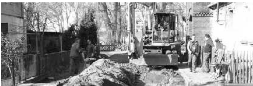
Prace przy budowie kanalizacji i wodociągu w Kręcku

Trwają roboty przy realizacji projektu pn. Uporządkowanie gospodarki wodno ściekowej na terenie gminy Zbąszynek – projekt zasadniczy. Roboty są prowadzone na terenie wsi Kręcko i na odcinku od Zbąszynka do Dąbrówki Wlkp. w zakresie budowy wodociągu. Podpisano również umowę z Przedsiębiorstwem Robót Inżynieryjno – Budowlanych „HYDRAD” z siedzibą w Pile na zakres prac ujętych w tzw. „Projekcie Wsparcia”. Rozpoczęcie prac nastąpi w miesiącach wiosennych.