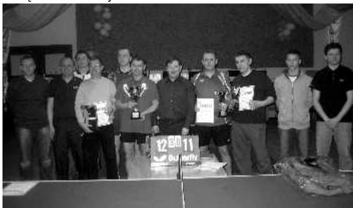
Finał tenisa stołowego o Puchar Burmistrza Zbąszynka