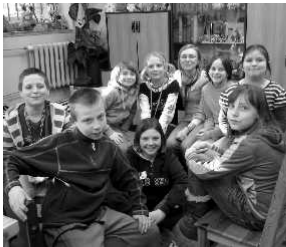
Uczestnicy Programu „Odnaleźć siebie”

Ośrodek Pomocy Społecznej w Zbąszynku rozpoczął realizację trzeciej edycji projektu „Odnaleźć siebie” - aktywna integracja w OPS Zbąszynek współfinansowanego ze środków Unii Europejskiej w ramach Europejskiego Funduszu Społecznego. Trzecia edycja projektu unijnego rozpoczęła się 01 stycznia 2010 roku i potrwa do 30 listopada 2010 roku. Tegoroczny projekt skierowany jest do osób z problemami opiekuńczo-wychowawczymi i przeżywającymi kryzysy, zwłaszcza w rodzinach wielodzietnych i niepełnych oraz do osób uzależnionych od alkoholu, objętych działaniami tutejszego Ośrodka i zagrożonych wykluczeniem społecznym. W okresie jedenastu miesięcy Beneficjenci zostaną objęci kompleksowym wsparciem. W ramach aktywnej integracji przeprowadzone będą treningi kompetencji i umiejętności społecznych oraz treningi umiejętności zawodowych. Dla osób i rodzin prowadzone będzie specjalistyczne poradnictwo psychologiczne oraz pedagogiczne. Rodziny zostaną objęte wsparciem asystenta rodziny. Celem działań jest doprowadzenie do poprawy funkcjonowania tych rodzin w społeczności Gminy Zbąszynek.