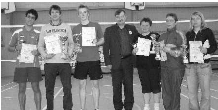
Uczestnicy I Amatorskiego Otwartego Turnieju Badmintonu