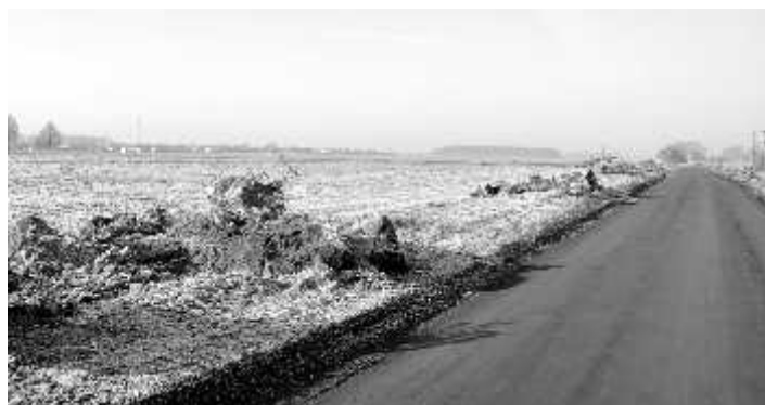
Rozpoczęte prace przy budowie obwodnicy Zbąszynka

Wraz z poprawą pogody ruszyły roboty drogowe i obecnie prace wykonywane są zgodnie z wcześniej przyjętym harmonogramem.