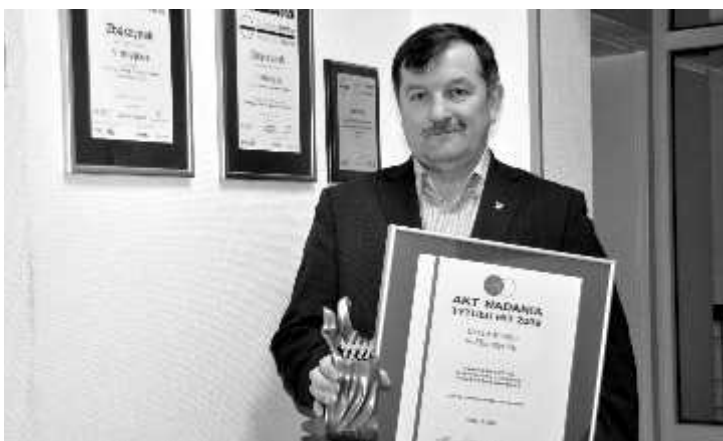
Dyplom i statuetka HIT 2009 dla Gminy Zbąszynek

W 2004 roku Gmina Zbąszynek zdobyła tytuł HIT Ziemi Lubuskiej – za model funkcjonowania gminy