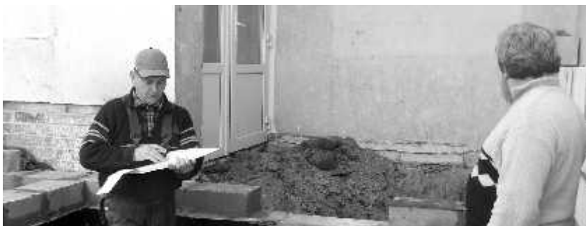
Budowa Centrum Kultury i Folkloru w Dąbrówce Wlkp.