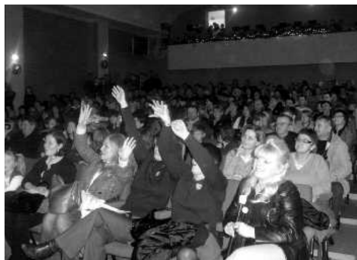
Finał WOŚP w Domu Kultury w Zbąszynku

18. Finał Wielkiej Orkiestry Świątecznej Pomocy odbył się w miejscowym Domu Kultury. Wspaniały koncert połączony z