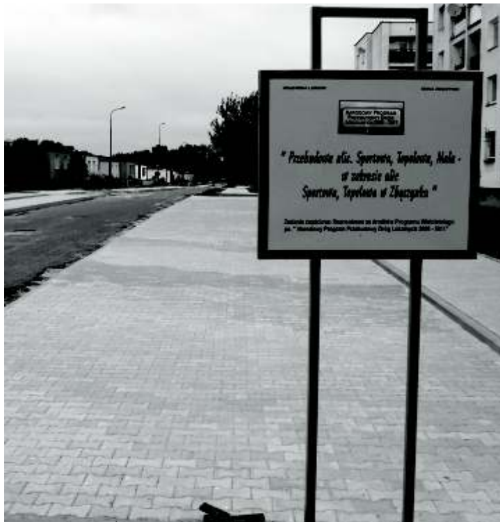
ul. Topolowa w trakcie remontu

Dobiegają do końca prace związane z przebudową ulic Topolowej i Sportowej w Zbąszynku. Wykonawcami robót są: Przedsiębiorstwo Robót Inżynieryjno-Drogowych z Nowego Tomyśla i Keno-Eko J. Ciszewski J. P. Kąka ze Zbąszynia. Planowany termin zakończenia prac to koniec lipca br. Zadanie jest finansowane w 50% z budżetu Gminy Zbąszynek i w 50% ze środków Narodowego Programu Przebudowy Dróg Lokalnych na lata 2008-2011, pochodzących z budżetu państwa. Modernizacja ulic spowoduje w szczególności zdecydowaną poprawę bezpieczeństwa ruchu drogowego, skorygowane zostaną promienie skrętów na skrzyżowaniach, zostaną wyznaczone miejsca dla pieszych, powstaną nowe miejsca parkingowe dla samochodów osobowych a przy