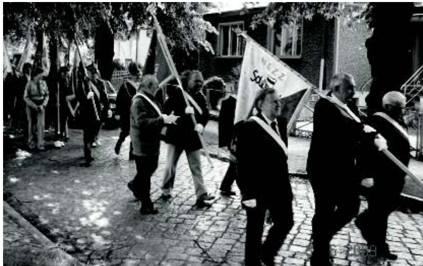
Przemarsz pocztów sztandarowych ulic Ko cieln