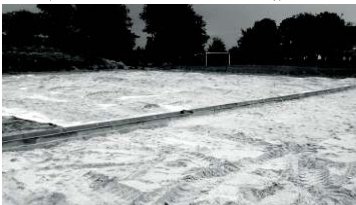
Post p robót budowlanych

Ogólnodost pny, wielofunkcyjny kompleks sportowy: boisko piłkarskie 30m x 62m, boisko wielofunkcyjne 19m x 32m