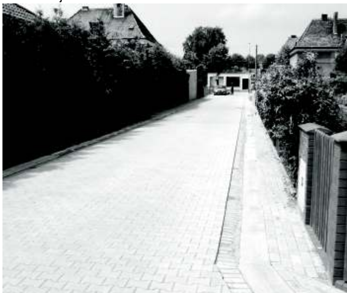
ul. Krakowska po zakończeniu budowy

W kwietniu br. zakończono inwestycje drogowe na ulicach Krakowskiej i Wrocławskiej w Zbąszynku. Ze względu na rodzaj zabudowy, położenie i funkcję wykonano je w układzie ciągów pieszo-jezdnych o nawierzchni z kostki betonowej.