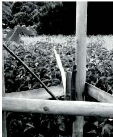
Złamane drzewko przy ulicy PCK

Ostatni taki przypadek miał miejsce na ulicy PCK, gdzie wandalowie połamali nowo nasadzone drzewka.