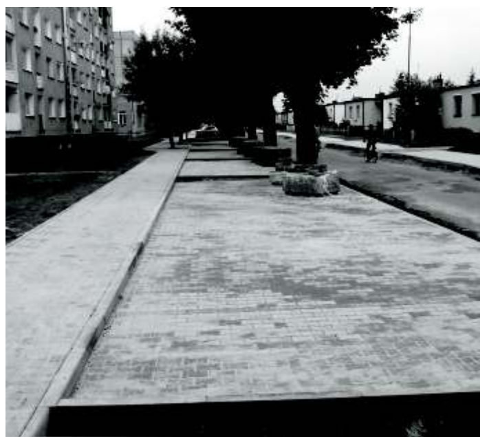
Nowe parkingi przy ul. Topolowej

stadionie również dla autobusów. Skrzyżowanie ul. Sportowej z ul. Długą będzie wykonane jako skrzyżowanie wyniesione, spowalniające ruch samochodów. Zostanie wykonana nowa nawierzchnia ulic z masy bitumicznej, a chodników z kostki betonowej. Na ulicy Topolowej zostaną wykonane dwa miejsca ograniczające prędkość, tzw. zwalniacze. Ogółem długość zmodernizowanych ulic wyniesie 0,84 km.