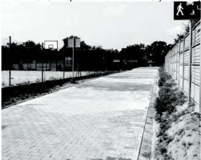
ul. Wrocławska po zakończeniu budowy