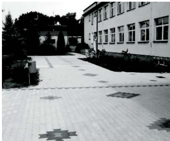
Plac przed szkołą po remoncie