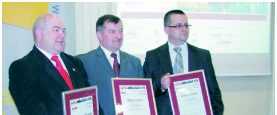
Uroczystość wręczenia wyróżnienia - Wrocław