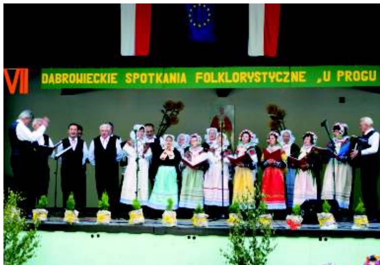
Zespół piewaczy „D browszczanka” z D brówki Wlkp.