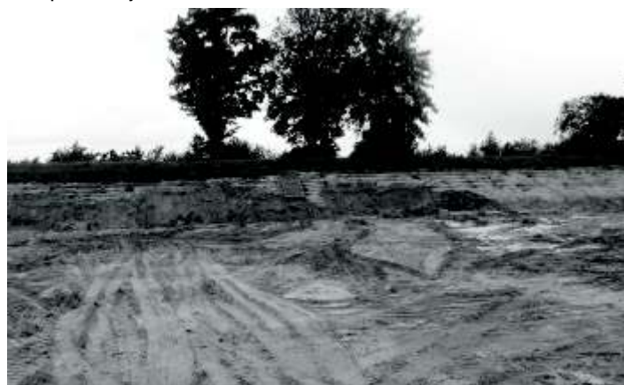
Przygotowany plac pod budow „ORLIKA”

W dniu 29 sierpnia 2008 r. – Gmina Zb szynek deklaruje ch udziału w programie „Moje Boisko – Orlik 2012” w 2009 r. oraz wniesienie niezbd nego wkładu finansowego na realizacj inwestycji. Lokalizacja kompleksu: O rodek Sportowo-Rekreacyjny im. Bogdana Niemca w Zb szynku przy ul. Sportowej 2.