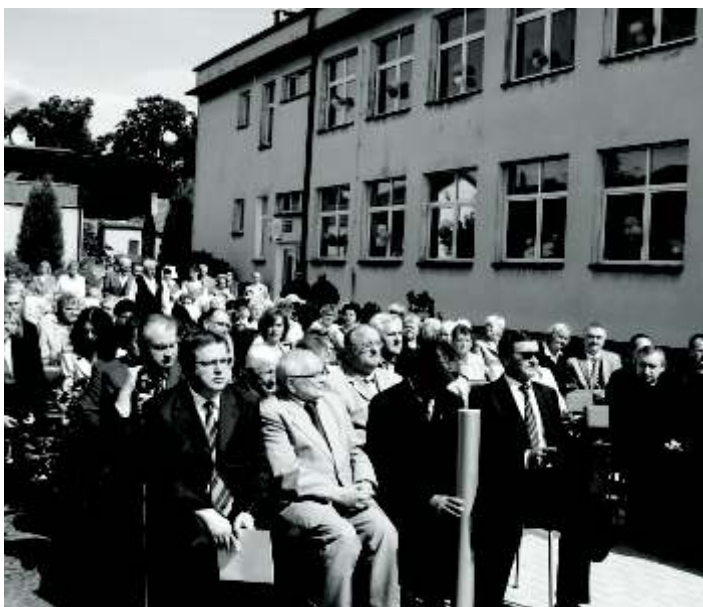
Uczestnicy uroczystości 80-lecia