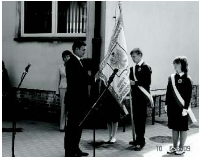
Odznaczenie sztandaru Szkoły

W dniu 10 czerwca 2009 roku odbył się uroczysty obchód 80. rocznicy powstania Szkoły Polskiej w Dąbrowce Wielkopolskiej. Przygotowania do uroczystości trwały od dawna. Zarówno placówka, jak i teren wokół niej zostały