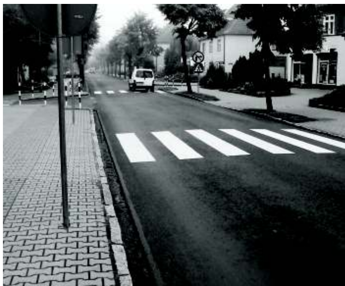
ul. Wojska Polskiego po remoncie

przeprowadzono remont czystkowy nawierzchni polegający na uzupełnieniu jej ubytków. Remont wykonano w możliwie najkrótszym czasie jak na ten porządek roku. Zakładano prace modernizacyjne, polegające na ułożeniu nowej nawierzchni - nakładki z masy bitumicznej. Wykonano również nowe przejścia dla pieszych w okolicach skrzyżowania z ulicą Klubową oraz wstawiono barierki – słupki na skrzyżowaniach, które są elementami poprawiającymi bezpieczeństwo uczestników ruchu. Wykonano również nową nawierzchnię, pozostawiono przy krawężnikach cieki do odprowadzania wód opadowych. Na przejściach dla pieszych zostaną zamontowane kryte cieki wodne. Ich montaż umożliwi sprawne przemieszczanie się osobom na wózkach inwalidzkich i wózków dla dzieci. Wymieniono również oznakowanie pionowe. Inwestycja jest prowadzona przy dofinansowaniu Starosty wiebodzińskiego, który zobowiązał się do pokrycia 50% kosztów realizowanego zadania.