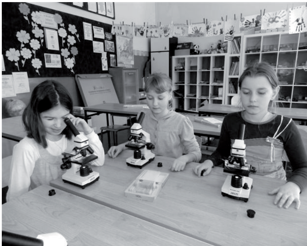
Grupa uczestników projektu