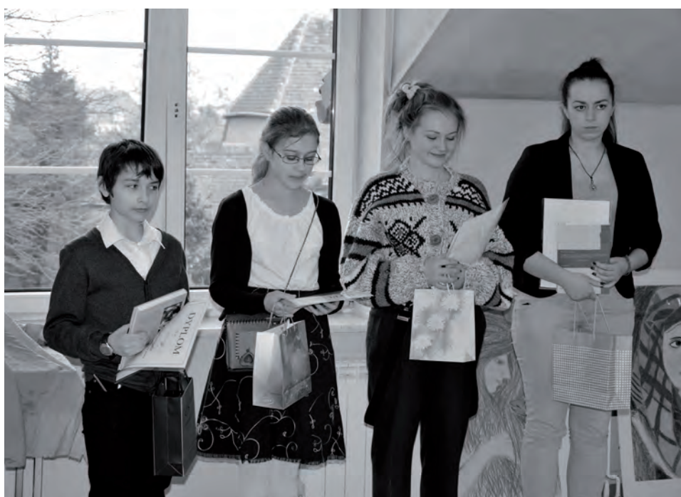
Zwycięzcy I Międzyszkolnego Dyktanda „Połam Pióro”