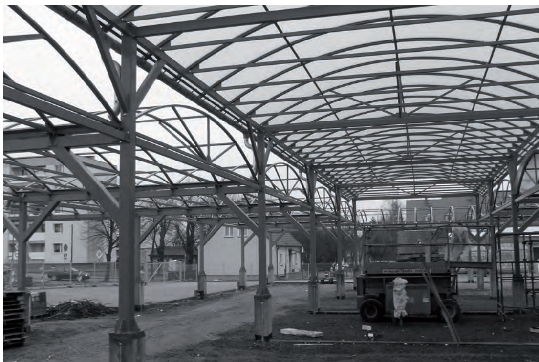
Konstrukcja stalowa zadaszania hali targowej