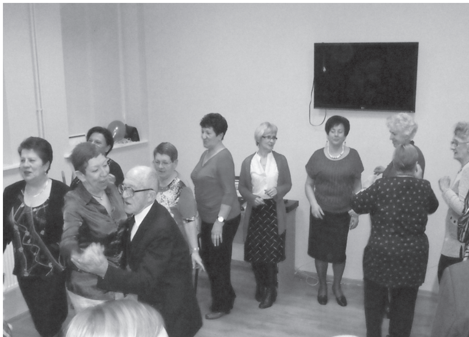
Podkaziątek na Uniwerku

Przyznanie specjalnego zasiłku opiekuńczego jest uzależnione od sytuacji dochodowej rodzin: osoby sprawującej opiekę oraz osoby wymagającej opieki - łączny dochód w przeliczeniu na osobę nie