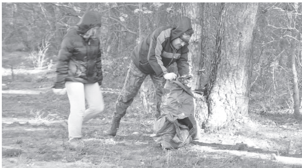
Zeszlortoczna akcja sprzątania przeprowadzona przez harcerzy