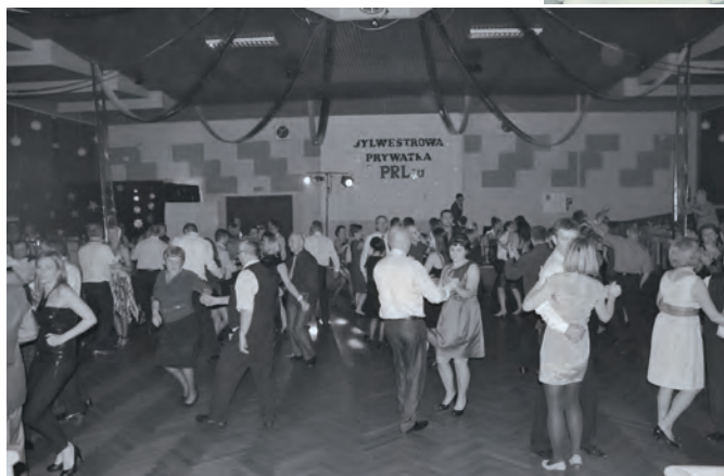
Goście bawili się do białego rana

ny przez Jolantę Kuleszę. Modelki prezentowały bieliznę skrywającą się pod karnawałowymi przebraniami. Pokaz został nagrodzony gromkimi brawami. O północy wszyscy składali sobie noworoczne życzenia. Impreza trwała do 5:00 rano.