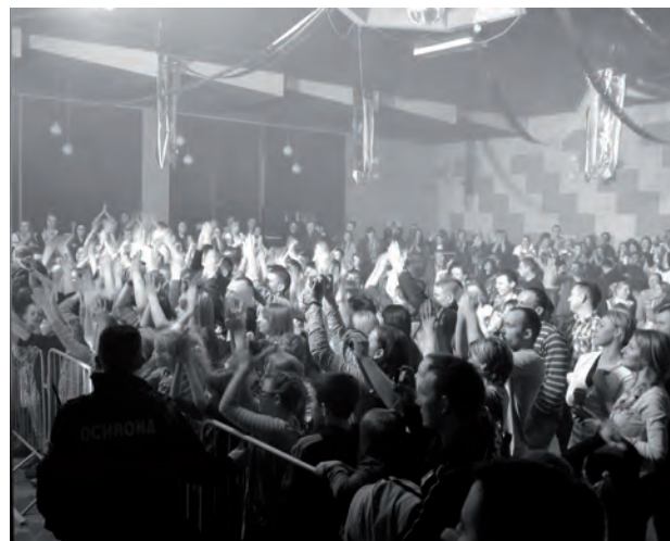
Zespół Weekend przyciągnął fanów z całego województwa lubuskiego

dla mnie” i „ Jesteś z.....” oraz inne piosenki grupy. Charyzmatyczny wokalista nawiązał znakomity kontakt z publicznością, która wspólnie śpiewała słowa piosenek. Zespół bisował dwukrotnie. Po koncercie lider zespołu rozdał autografy, chętnie pozując do pamiątkowych zdjęć.