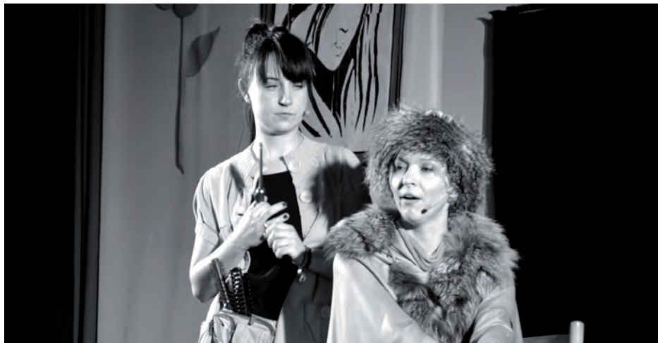
Kabaret Stoiczek Po Cukrze w skeczu „Teściowa i synowa”