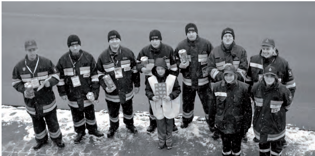
Co roku strażacy z OSP Zbąszynek pomagają w kwestowaniu

XXI Finał Wielkiej Orkiestry Świątecznej Pomocy za nami. W tym roku Sztab w Zbąszynku wspomagało 28 wolontariuszy, w tym także harcerze ze Związku Drużyn ZHP Zbąszynek i ochotnicy z OSP Zbąszynek. Od godziny 14:00 w sali widowiskowej trwał koncert, w którym udział wzięli artyści z gminy Zbąszynek.