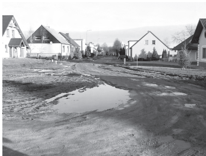
Fragment ulicy Kościelnej - stan obecny

W szkole podstawowej w Zbąszynku trwają prace nad utworzeniem świetlicy dla dzieci. Prace są już mocno zaawansowane. Zakres obejmuje adaptację pomieszczeń po dawnym składzie opału - użytkowanym wcześniej jako magazyn. Po demontażu starych, nieczynnych urządzeń i pracach wyburzeniowych, wykonano nowe posadzki, tynki, zamontowano okna i drzwi. Wykonano nowe instalacje elektryczne, wodno kanalizacyjne, centralnego ogrzewania. Część otworów zamurowano i powstał nowy układ pomieszczeń. Są tam trzy toalety, wejście z przedsionkiem i sala świetlicy o powierzchni ok. 60 m 2 . Obiekt został ocieplony i uzyskała nową elewację. Dzięki świetlicy uczniowie rozpoczynający naukę w szkole jak i do niej uczęszczający będą mogli bawić się, odrabiać lekcje, wyjść na spacer i dowiedzieć się wielu nowych, interesujących rzeczy. Wszystko to przy pomocy osób odpowiedzialnych za przebywające pod ich opieką dzieci.