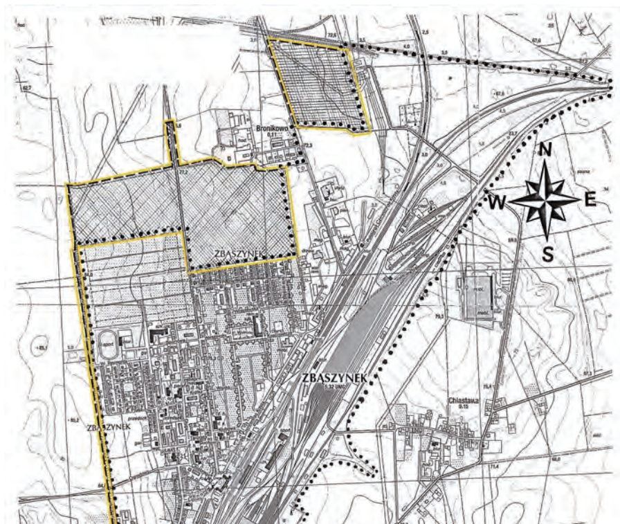
Fragment mapy określającej zmianę granic miasta

sta dla obszaru Dąbrówka Wielkopolska oraz części zachodniej granicy miasta dla obszaru wsi Kosieczyn. Zmiana granic administracyjnych miasta w żaden sposób nie wpłynie ujemnie na infrastrukturę społeczną, ponieważ nie obejmuje terenów zamieszkałych. Obszar proponowanych do włączenia w większość stanowi grunty będące własnością Skarbu Państwa, Agencji Nieruchomości Rolnych, a jedynie niecałe 15% stanowią grunty właściciela indywidualnego. Zmiana granic administracyjnych miasta jest spójna z planowanym zagospodarowaniem obszarów wskazanym do zainwestowania w studium uwarunkowań i kierunków zagospodarowania przestrzennego Miasta i Gminy Zbąszynek. Tereny wskazane w obrębie wsi Kosieczyn obejmują dwie działki drogowe. Włączenie tych działek spowoduje poprawę komunikacyjności na styku obszaru zabudowanego z terenami rolnymi wsi Kosieczyn. Tereny leżące w obrębie wsi Dąbrówka Wielkopolska wskazane do objęcia zmianą przewidziane są pod budownictwo mieszkaniowe, usługi ogólnomiejskie i aktywizację gospodarczą Gminy Zbąszynek.