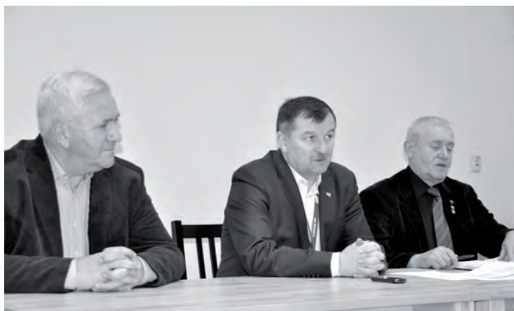
Dom Kultury - spotkanie z mieszkańcami

W dalszej części spotkania głos zabrali mieszkańcy. Pytania dotyczyły głównie tzw. ustawy śmieciowej. Burmistrz omówił szczegółowo procedurę przetargową wyboru firmy obsługującej Gminę, przedstawił koszty wywozu śmieci oraz ich częstotliwość. Pozostałe pytania skupiły się na sprawach porządku i czystości na terenie miasta, planowanej budowie miejsc parkingowych oraz funkcjonowaniu karetki pogotowia. Głos zabrał również mieszkaniec Zbąszynka, który po blisko 15 latach nieobecności powrócił w rodzinne strony. Wyraził swój podziw i zadowolenie z obecnego wizerunku miasta, wprowadzonych zmian, a przede wszystkim z życzliwości jego mieszkańców.