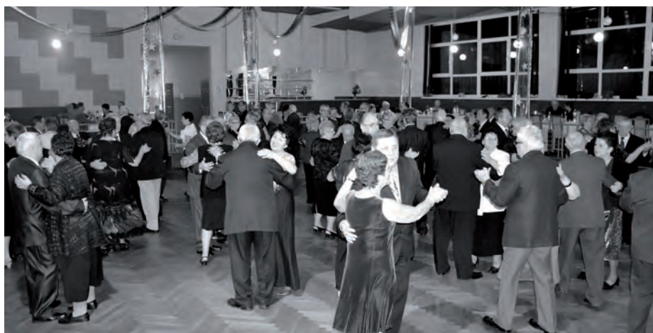
Co roku Bal Seniora cieszy się sporym zainteresowaniem

W sobotę 05 stycznia br. w sali tanecznej odbył się III Bal Seniora. Na balu spotkali się seniorzy i seniorki należące do organizacji i stowarzyszeń oraz chętni mieszkańcy z gminy Zbąszynek i ze Świebodzina. Goście bawili się przy muzyce z dawnych lat.