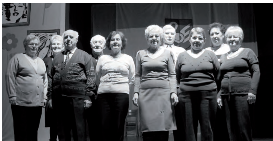
Grupa taneczna Tęcza