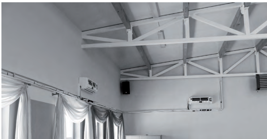
Nowe urządzenia klimatyzacyjne

Na ukończeniu są prace przy montażu systemu klimatyzacji w Sali Centrum Kultury i Folkloru w Dąbrówce Wlkp. Na ścianach sali zostanie zamontowanych osiem urządzeń schładzających, których zadaniem będzie utrzymanie optymalnej temperatury w pomieszczeniu. Wcześniej dużym problemem było nagrzewanie sali w słoneczne dni przez świetlik dachowy. Zadanie realizuje firma „TEKKA” Karolina Bołbot z Zielonej Góry. Koszt inwestycji 57 441 zł brutto. Termin realizacji 28.03.2013r. Projekt jest współfinansowany w 80 % ze środków PROW.