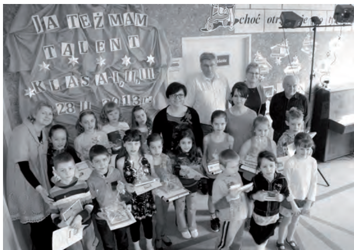
Laureaci konkursu „Ja też mam talent”