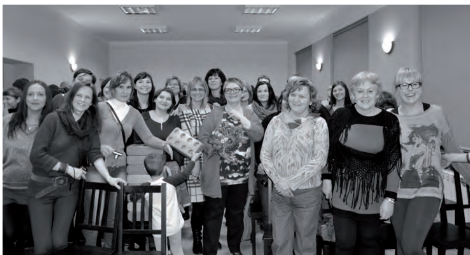
Spotkanie z Super-nianią zakończyło się pamiątkowym zdjęciem

W drugiej części spotkania Super Niania odpowiadała na pytania rodziców. Poruszano tematy niejadków i tych dzieci, które jedzą za dużo. Na koniec Pani Dorota chętnie pozowała do zdjęć i podpisywała swoje książki.