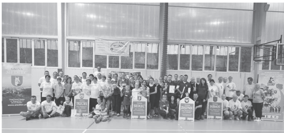
Uczestnicy Turnieju Gmin Regionu Kozła