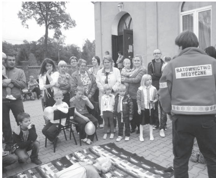
Nauka udzielania pierwszej pomocy - podczas festynu w Kręcku Projekt Odnaleźć siebie współfin. z UE