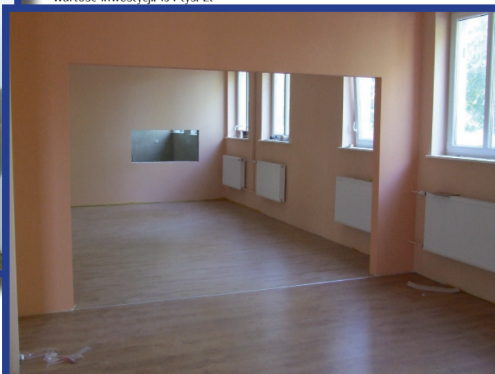
Adaptacja pomieszczeń po przychodni PKP na Klub Seniora w Zbąszynku Termin wykonania: VII-X 2012 r. Wartość inwestycji: 154 tys. zł