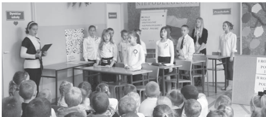
Program artystyczny „Lekcja historii”

Doroczne jasełkowe spotkanie całej społeczności SP w Kosieczynie, zaprzyjaźnionych przedszkoli i zaproszonych gości kolejny raz pozwoliło poczuć niezwykłą atmosferę zbliżających się Świąt Bożego Narodzenia. Rozstając się, życzyliśmy sobie wzajemnie pełnych pokoju i radości Świąt oraz Szczęśliwego 2013 Roku, czego życzymy również wszystkim Szanownym Czytelnikom Zbąszyneckiego Kwartalnika.