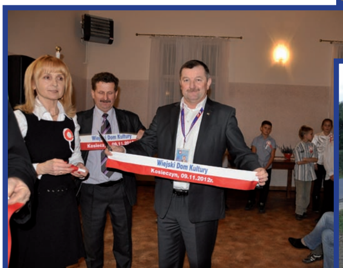
Przebudowa Salii Wiejskiej w Kosieczynie Termin wykonania: III-X 2012 r. Wartość inwestycji: 550 tys. zł