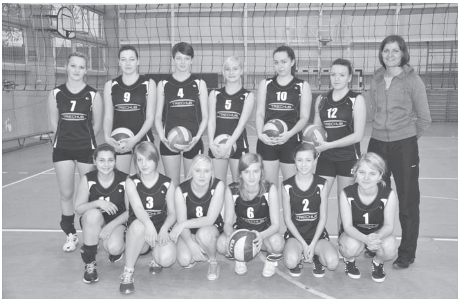
Żeńska drużyna ZST

W ostatnim kwartale tego roku w hali sportowej przy ZST w Zbąszynku odbyły się trzy turnieje siatkarskie. Potwierdza to tezę, że Zbąszynek siatkówką słynie! W październiku odbył się Turniej siatkówki o Puchar Dyrektora ZST w Zbąszynku, w którym wzięły udział trzy drużyny: Zbąszynek, Miedzichowo i Rogoziniec. Gospodarze wygrali turniej, drugie miejsce zajęli goście z Miedzichowa, a trzecie Rogoziniec. Koniec listopada przyniósł nam eliminacje powiatowe drużyn siatkarskich. Najpierw zagrały dziewczęta. Na ich drodze stanęły zawodniczki ZSO Świebodzin i PZSTiZ Świebodzin. Niestety, naszym dziewczynom nie udało się awansować do zawodów rejonowych. Należą się im ogromne brawa za walkę, ambicję i piękny, choć przegrany mecz z ZSO Świebodzin. Następnego dnia grali chłopcy. Walczyli z trzema drużynami: ZSO Świebodzin, PZSTiZ Świebodzin oraz ZSL Rogoziniec. Tym razem turniej zakończył się pomyślnie dla gospodarzy i chłopcy awansowali do finałów rejonowych. Przy ZST w Zbąszynku prowadzona jest dziewczęca sekcja siatkówki UKS „Junior”. Uczestniczą w niej uczennice Gimnazjum