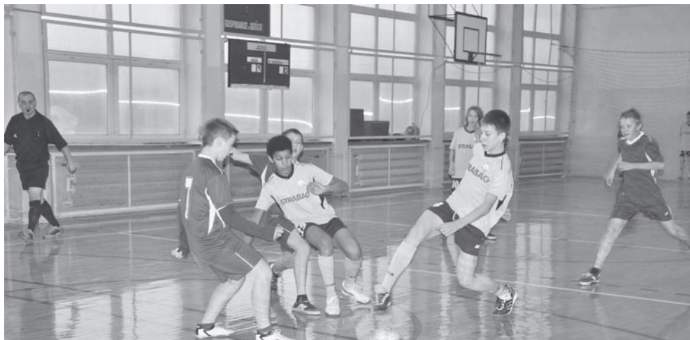
W meczu o pierwsze miejsce Smardzewo wygrało ze Zbąszynkiem

Okazja do rewanżu przyszła bardzo szybko. Te same drużyny wzięły udział w Mikołajkowym Turnieju Piłki Nożnej. A ten odbył się 6 grudnia w Kosieczynie. Pierwsze miejsce zajęła drużyna SP ze Zbąszynka. Na drugim znalazł się ZS Szczaniec, natomiast na trzecim SP Kosieczyn. Drużyny otrzymały puchary, medale i nagrody rzeczowe. Zadanie zostało dofinansowane ze środków Powiatu Świebodzińskiego.