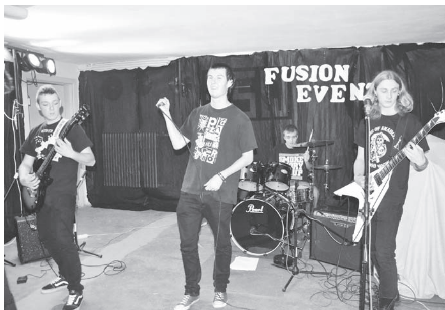
Anarchy Time debiutował na małej scenie

24 listopada br. w Domu Kultury odbyła się impreza muzyczna. Koncert podzielony był na dwie części. W pierwszej zagrały cztery kapale. Anarchy Time debiutował na małej scenie.