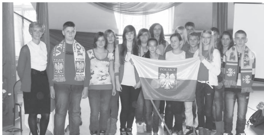
Święto Niepodległości - uczniowie ubrani w barwach flagi narodowej

W dniu 21 grudnia odbyły się wigilie klasowe oraz spektakl przedświąteczny przygotowany przez uczniów w ramach projektu „Jasetka”.