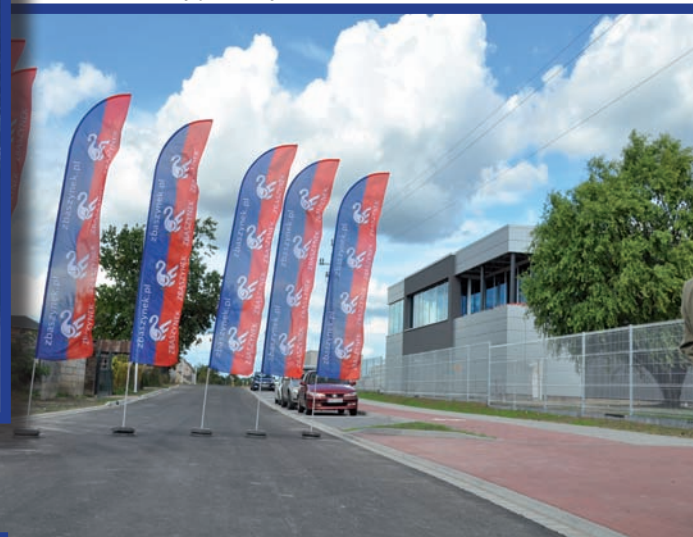
Rozbudowa drogi gminnej - ul. Czarna Droga w Zbąszynku Termin wykonania: III-IX 2012 r. Wartość inwestycji: 1 862 tys. zł