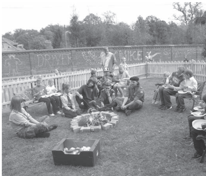
Festyn dla mieszkańców Kręcka - plac rekreacyjny przy sali wiejskiej wykonany przez mieszkańców wsi przy współudziale OPS Zbąszynek - projekt z Unii Europejskiej;