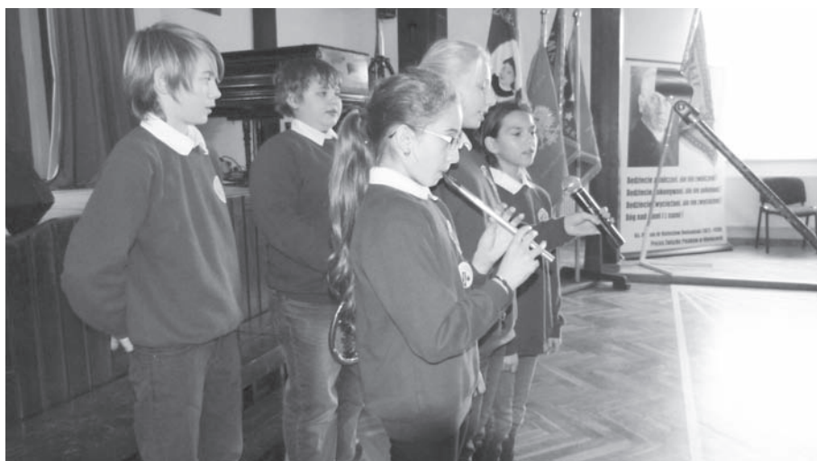
Obchody Święta Niepodległości w SP w Dąbrówce Wlkp.

ganie nadwadze i otyłości dzieci. W ramach tego programu organizowane są dodatkowe działania w klasach mające na celu zniwelowanie złych nawyków żywieniowych. Przygotowywane są II śniadania, surówki, sałatki, młeczne zupy, desery, jogurty, koktajle. Ko-