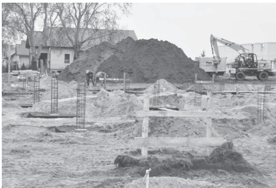
Plac budowy za Urzędem Miejskim

na koniec czerwca 2013r. Wartość projektu wynosi ok. 2,1 mln złotych z czego 1 mln zł pochodzić będzie ze środków Unii Europejskiej. W ramach projektu powstanie nowoczesne targowisko utwardzone nawierzchnią z kostki betonowej. Całość będzie ogrodzona i oświetlona. Od zewnętrznej strony placu powstaną miejsca parkingowe i chodniki. Zostanie wykonane przyłącze do sieci wodno-kanalizacyjnej i elektrycznej. Centralna część placu będzie zadaszona wiatą z poliwęglanu. Zadaszone stoiska zajmować będą ponad połowę powierzchni handlowej. Powstanie również budynek z toaletą i pomieszczeniem gospodarczym. Handel ma być tak zorganizowany, by umożliwić dostęp rolników do punktów sprzedaży w sposób określony w regulaminie targowiska.