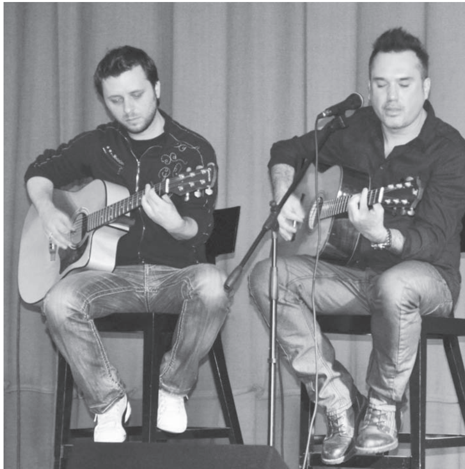
Największe przeboje zespołu Carpe Diem usłyszeliśmy w wersji akustycznej