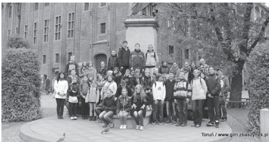
Toruń / www.gim.zbaszynek.pl

W listopadzie odbyły się szkolne etapy konkursów przedmiotowych. Do etapu rejonowego zgłoszono następującą liczbę uczniów: z języka polskiego - 3, z matematyki - 1, z języka angielskiego - 1, z języka niemieckiego - 1, z geografii