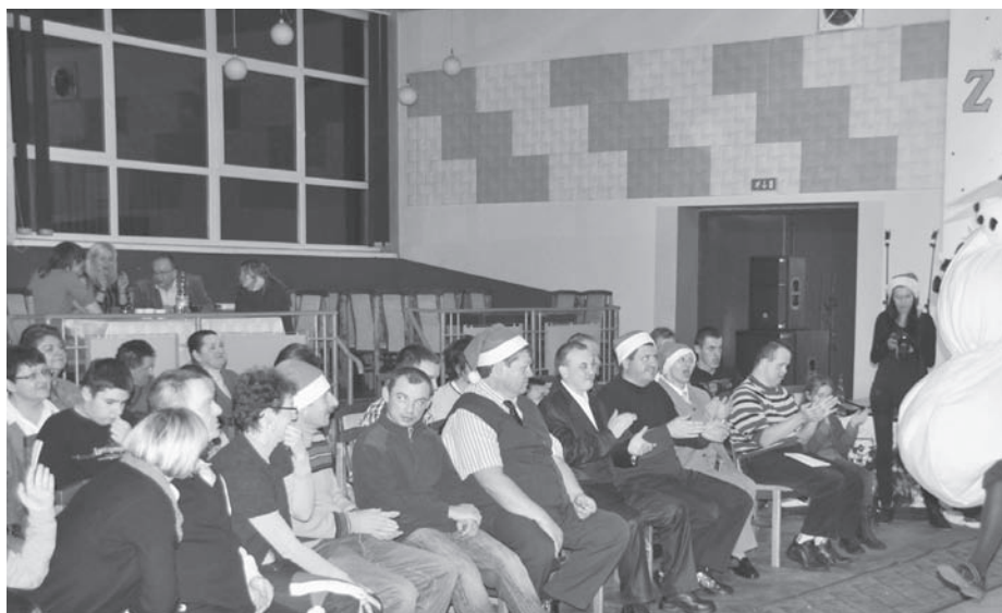
Przedstawienie „Jak mikołaj urwał się z choinki”