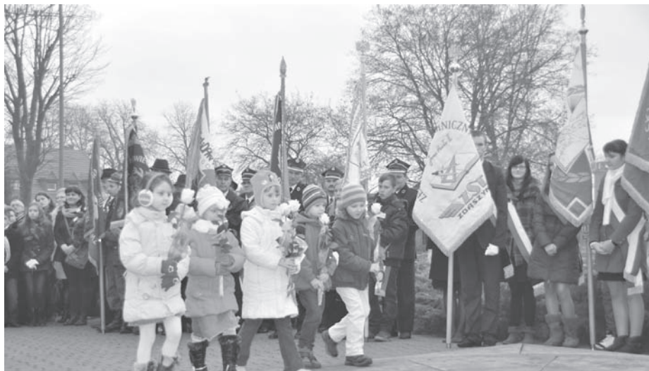
Delegacja dzieci składająca kwiaty pod pomnikiem Chrystusa Króla