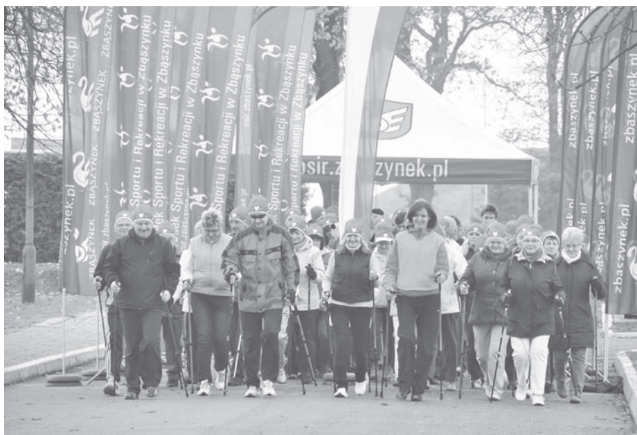
W 3. Marszu Nordic Walking wystartowało prawie sześćdziesięciu uczestników

wzięto udział blisko sześćdziesiąt osób. Przed startem każdy otrzymał pamiątkową czapkę, a po ukończeniu, z rąk Burmistrza pamiątkowy medal. Trasa wyniosła ponad pięć kilometrów. Uczestnicy przeszli ulicami miasta, a także po obwodnicy północnej Zbąszynka. Po marszu wypili gorącą herbatę i usmażyli kiełbaski na ognisku.