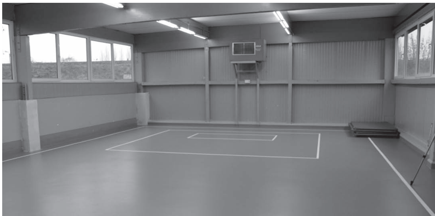
Nawierzchnia salki gimnastycznej po remoncie