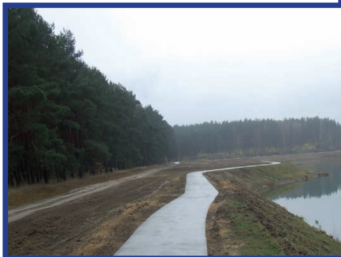
Budowa zbiornika retencyjnego wód burzowych w Chlastawie, wraz z częściowym zagospodarowaniem wokół zbiornika Termin wykonania: X-XI 2012 r. Wartość inwestycji: 235 tys. zł