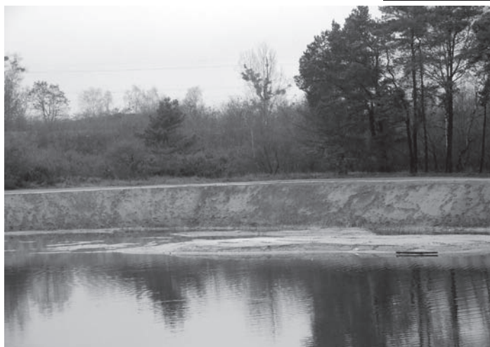
Zbiornik retencyjny w Chlastawie