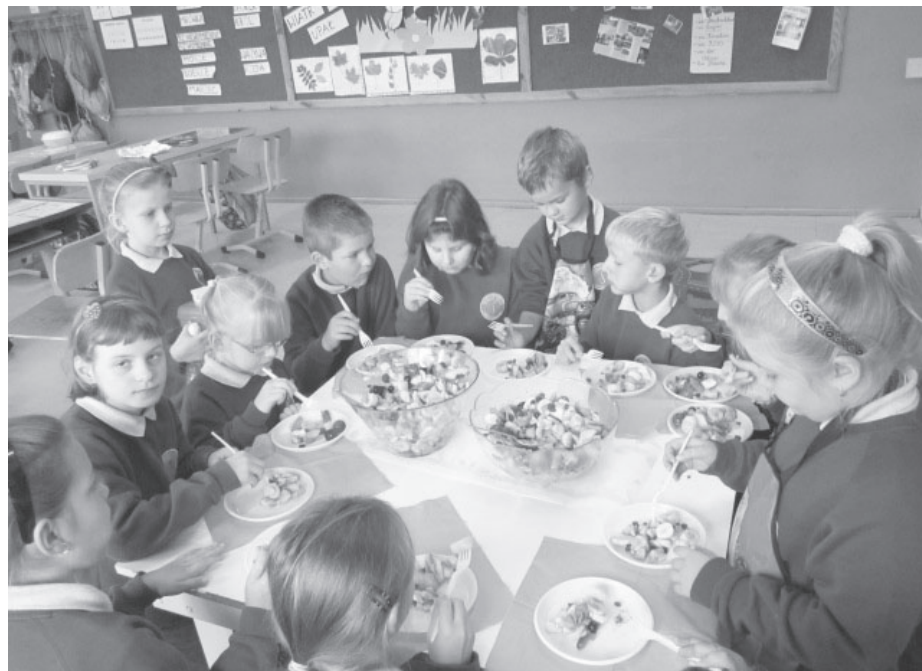
Zajęcia w ramach programu „Zapobieganie nadwadze i otyłości”