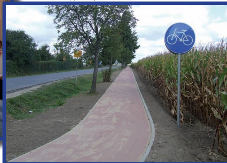
Budowa ścieżki rowerowej łączącej Zbąszyn z obwodnicą Termin wykonania: VII-IX 2012 r. Wartość inwestycji: 65,5 tys. zł