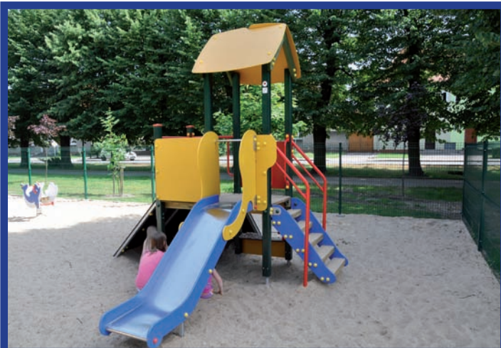
Budowa placu zabaw i chodników w parku na Placu Wolności w Zbąszynku Termin wykonania: IV-VI 2012 r. Wartość inwestycji: 99 tys. zł