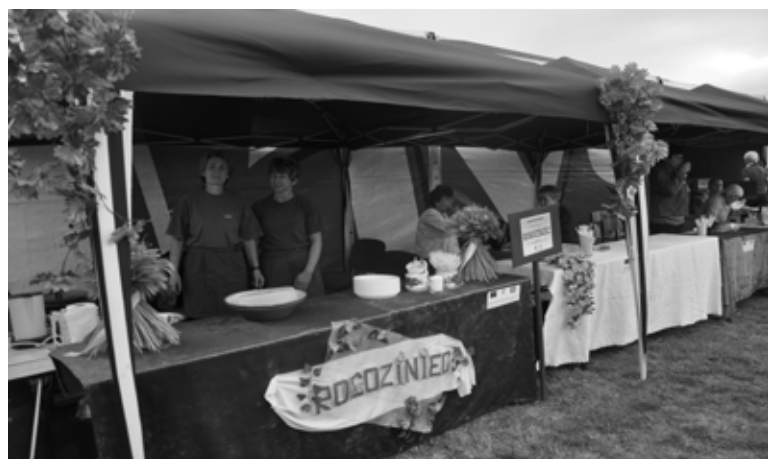
Koła Gospodyń Wiejskich prezentują swoje potrawy

i miejskich, którego celem było zgłębienie wiedzy na temat zwyczajów i kultury polskiej, poznanie tradycji kulinarnych kuchni polskiej i niemieckiej oraz integracja mieszkańców miast partnerskich. W tym roku jedną z atrakcji był