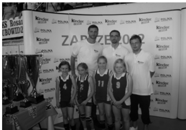
Drużyna z Kosieczyna z reprezentantami Polski

rozgrywek w minisiatkówce dziewcząt na terenie całego kraju przystąpiło prawie 16000 zawodniczek. Patronem medialnym tych rozgrywek jest Fundacja Kinder + Sport przy Polskim Związku Piłki Siatkowej. Finał w Zabrze to jedna z największych siatkarskich imprez dla dzieci w Europie. W tym do-