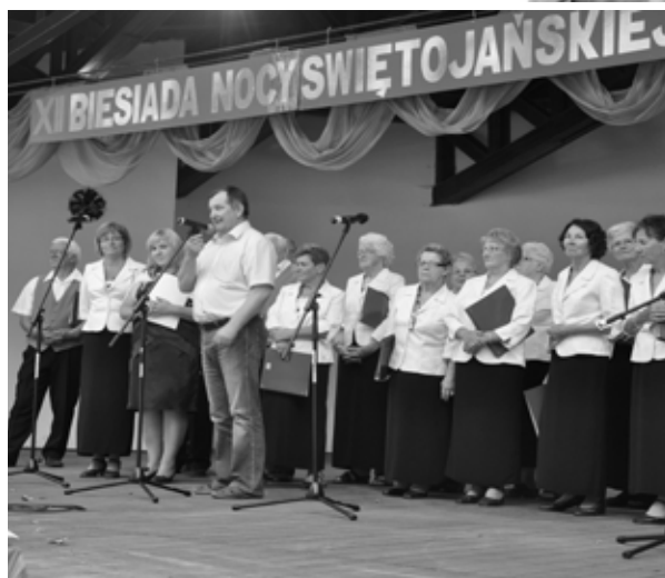
XII Biesiada Nocy Świętojańskiej

ły śpiewacze: chór z Drewitz, Osoria ze Szczañca, Obrzanie z Trzciela, Zbąszyńscy Seniorzy oraz Harmonia ze Zbąszynka. Tradycyjnie wybrano też najpiękniejszy wianek. Po zapadnięciu zmroku korowód prowadzony przez orkiestrę dętą z Dąbrowki Wlkp. wyruszył w stronę stawu, gdzie rozpoczęło się puszczanie wianków. Wieczór zakończył się pokazem sztucznych ogni i zabawą taneczną.