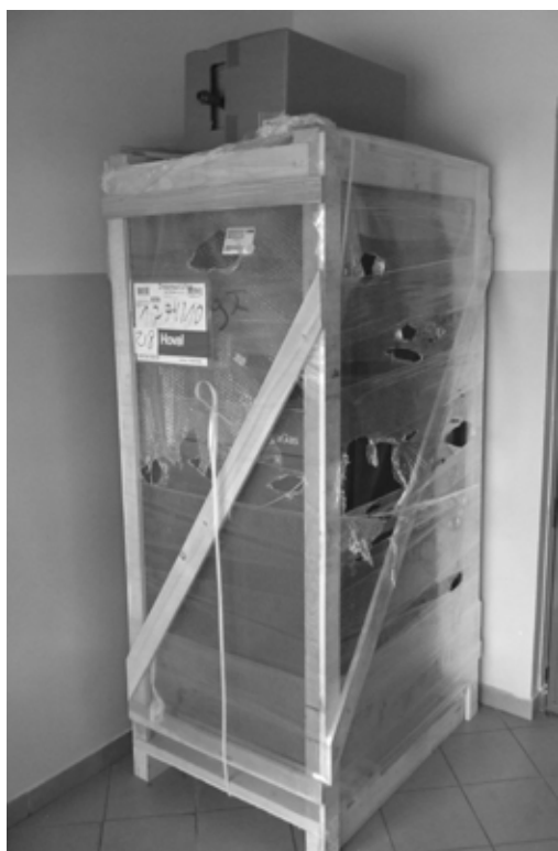
Nowy piec c.o. dla SP w Kosieczynie

Zadaniem priorytetowym, realizowanym w Kosieczynie w ramach Programu Rozwoju Obszarów Wiejskich 2007-2013, jest projekt pn. „Przebudowa świetlicy wiejskiej w Kosieczynie”. Prace powinny zakończyć się w październiku. Obecne zaawansowanie prac to: wykonano pokrycie dachowe, elewację zewnętrzną budynku, system wentylacyjny, instalację centralnego ogrzewania, instalację elektryczną. Wykonano też część robót malarskich, przygotowano podkłady pod posadzki. Prowadzone są prace związane z zagospodarowaniem terenu wokół świetlicy oraz zakupem wyposażenia (sprzęt audio-wideo, nowoczesny sprzęt kuchenny, itp.)