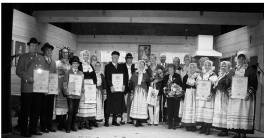
Zespół Śpiewaczy Dąbrowszczanka

Już po raz kolejny nasi lokalni artyści zostali docenieni na konkursie ogólnopolskim. W dniach od 8 do 12 sierpnia br. od-