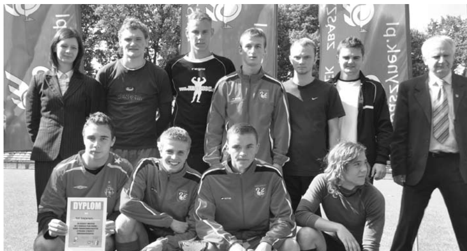
Zwycięska drużyna w Turnieju o Puchar Starosty

Po raz kolejny nasza Szkoła włączyła się w akcję pomocy Hospicjum im. Lady Ryder of Warsaw w Zielonej Górze. Dokonaliśmy zakupu 400 cebulek żonkili, które są międzynarodowym symbolem nadziei i przypominają nam o ludziach cierpiących, oczekujących pomocy i opieki w trudnym okresie odchodzenia z tego świata. Sadzenie Pól Nadziei odbyło się w naszej szkole 24 września.