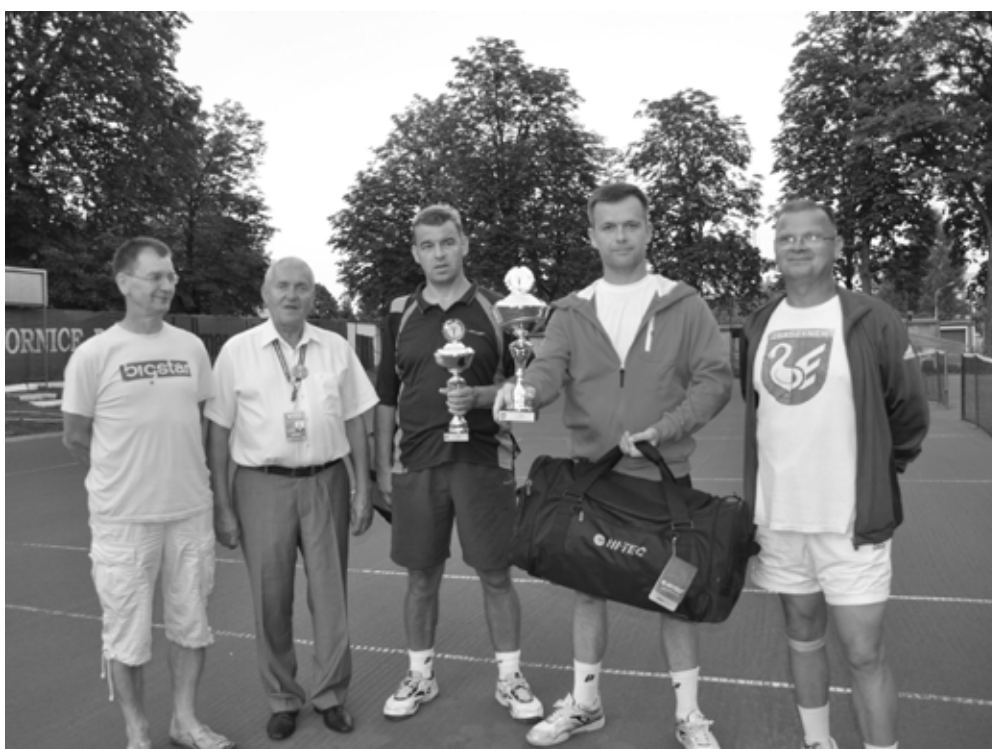
Zwycięcy turnieju tenisa ziemnego

4 sierpnia 2012 r. na kortach tenisowych o Puchar Przewodniczącego Rady Miejskiej w Zbąszynku walczyło 21 zawodników! Przez cały dzień mogliśmy oglądać kosmiczne uderzenia najlepszych rakiet w okolicy.