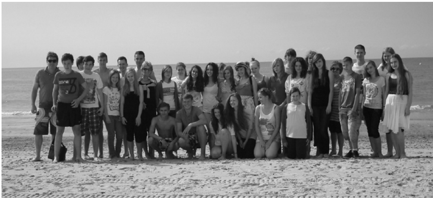
Uczniowie I Gimnazjum wraz z niemieckimi kolegami nad Bałtykiem

storii obu narodów. 3 września 2012r. na placu gimnazjalnym odbyło się uroczyste rozpoczęcie roku szkolnego 2012/2013.