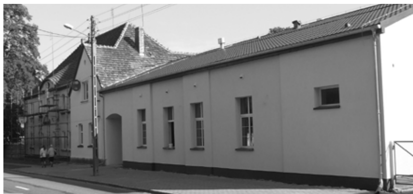
Sala Wiejska w Kosieczynie - końcowy etap remontu