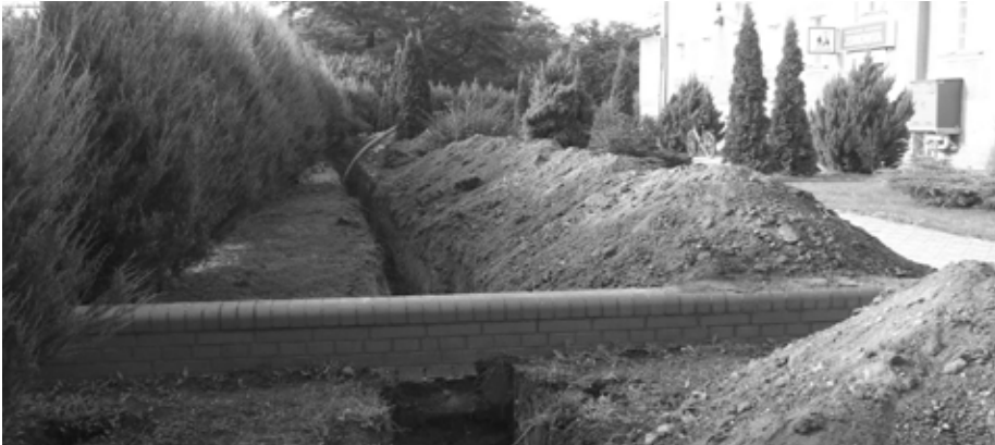
Wykopy pod wodociąg obok budynku CUM

Na piętrze budynku przy ul. PCK nr 2 na ukończeniu są prace remontowo-budowlane. Powstaje tu pięć lokali socjalnych, które będą przeznaczone dla ludzi znajdujących się w trudnym położeniu. Będzie tam jedno mieszkanie dwupokojowe, cztery jednopokojowe, wspólna łazienka, kuchnia i toaleta. Lokale zostaną wyposażone w podstawowe media. Będą miały osobne liczniki energii elektrycznej. Ciepła woda i ogrzewanie z istniejącego pieca gazowego. Wejście do budynku będzie od strony ulicy PCK wspólnym korytarzem i klatką schodową. Prace wykonuje zakład Usługowo Handlowy Jan Janik z Babimostu.