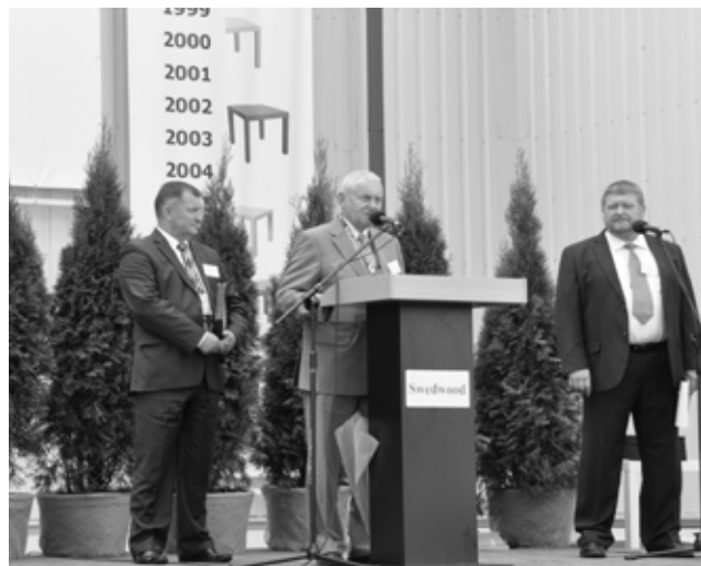
Ceremonia wręczenia tytułu Honorowego Obywatela Gminy