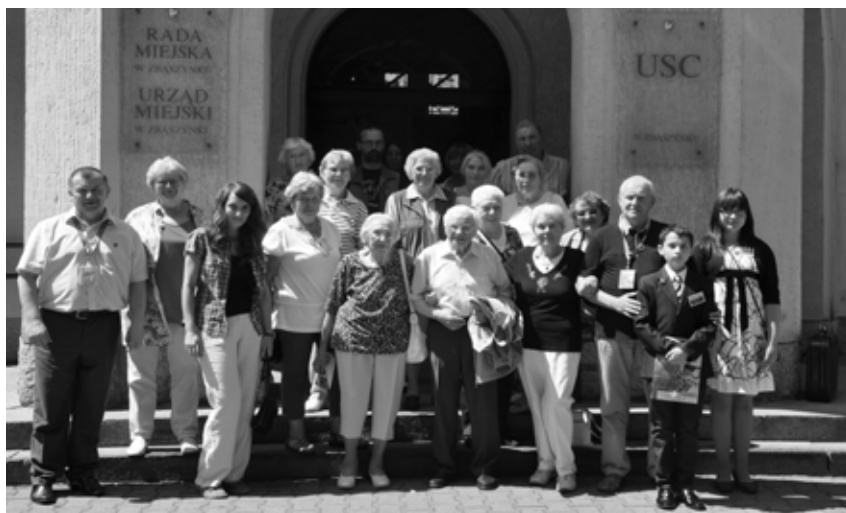
Pamiątkowe zdjęcie przed Urzędem Miejskim

Następnego dnia odbyła się uroczysta kolacja z Burmistrem Zbąszynka, a w niedzielę pożegnaliśmy gości zaproszeniem do kolejnych odwiedzin w przyszłym roku.