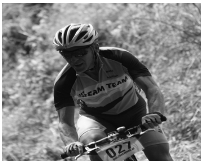
Zawody MTB w Zbąszynku

156 kolarzy wystartowało w I Otwartych Mistrzostwach Zbąszynka MTB o Puchar Burmistrza Zbąszynka, które odbyły się 5 sierpnia 2012 r. MTB to nic innego jak wyścigi na rowerach górskich. W Zbąszynku przygotowano specjalne trasy. Krótszą o długości 23 km i dłuższą - dla bardziej wytrzymałych - dystans o długości 46 km. Bieg ukończyło 143 uczestników -