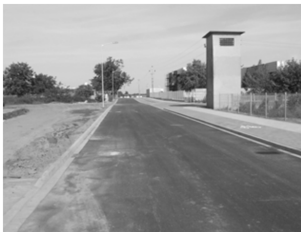
Nowa nawierzchnia ulicy Czarna Droga

zowano oświetlenie uliczne. Wykonawcą zadania była firma VERDIE z Wrocławia. Przebudowę wykonano w terminie, ku zadowoleniu firm działających w tej części miasta, ich kontrahentów i pracowników dojeżdżających do pracy. Przebudowa drogi znacznie poprawiła estetykę tej części miasta.