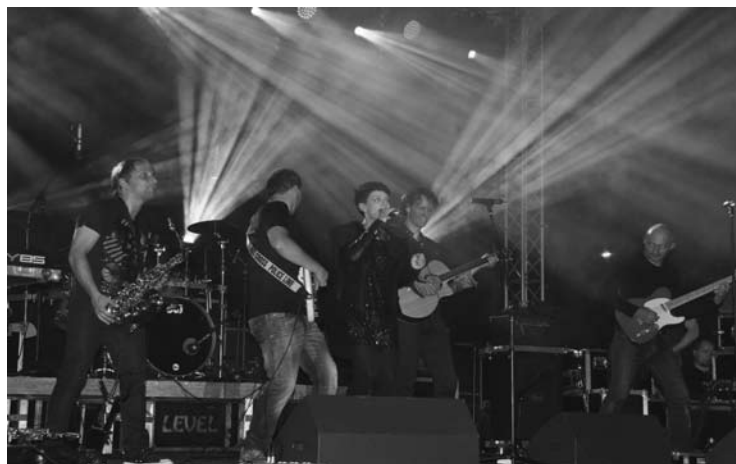
Gwiazda wieczoru zespół Varius Manx