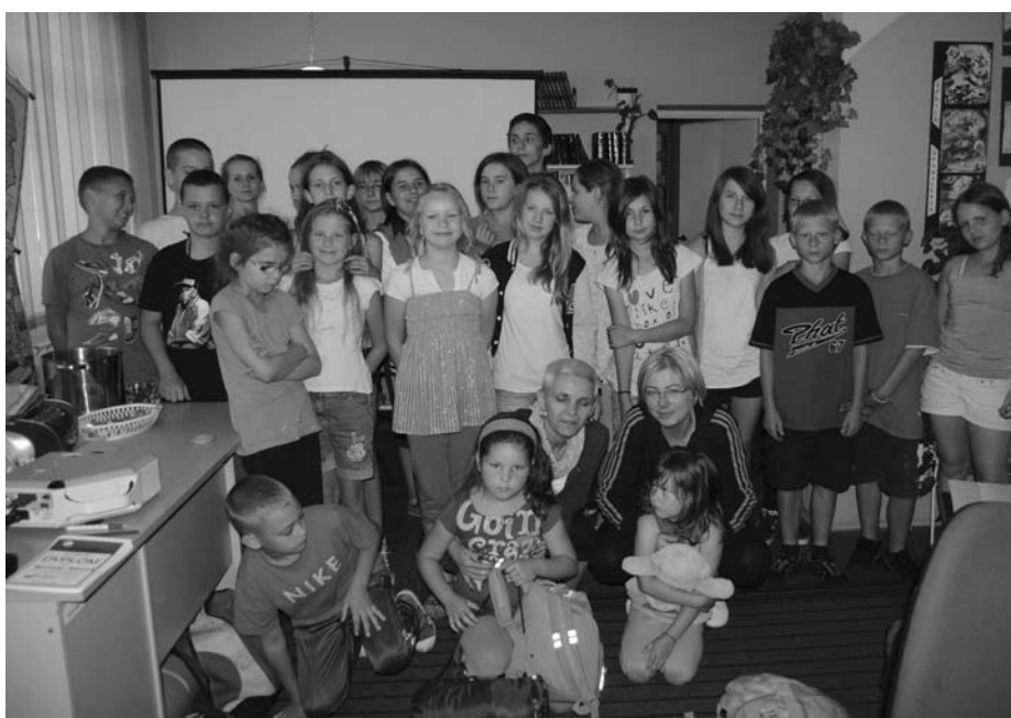
Uczestnicy po nieprzespanej nocy

ła wszystkich na tyle skutecznie, że do rana nikt nie zmrzył oka. Po śniadaniu, rozdaniu pamiątkowych dyplomów i wspólnym zdjęciu wszyscy w dobrych humorach i bez oznak zmęczenia rozeszli się do domów.