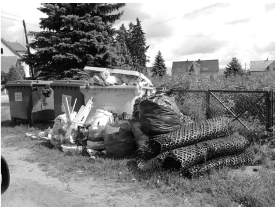
Przykład braku wyobraźni

Przy pojemnikach pozostawiane są różnego rodzaju odpady (sprzęt RTV, wykładziny, panele ścienne, błotniki samochodowe itp.) nie przeznaczone do tych pojemników. Kosze uliczne wykorzystywane są jako pojemniki na odpady komunalne. W lasach i przy drogach powstają dzięki wysypiska śmieci, których likwidacja kosztuje nas wszystkich. A przecież przy odrobinie dobrej woli każdego z nas, można żyć w czystej gminie, a środki finansowe przeznaczyć na lepszy cel. Dla przypomnienia! Na terenie gminy Zbąszynek prowadzona jest nieodpłatna zbiórka: odpadów wielkogabarytowych (materace, szafy, kanapy oraz podobne odpady nie mieszczące się do pojemników przydomowych) - płac za Urzędem Miejskim; zużytego sprzętu RTV i AGD - płac za Urzędem Miejskim; przeterminowanych leków - apteki na terenie miasta; gruz budowlany - płac przy oczyszczalni ścieków. Jak widać istnieje możliwość pozbycia się odpadów we właściwy sposób. Korzystajmy z tych możliwości i dbajmy razem o wygląd naszej gminy.