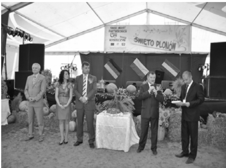
Dożynki Gminne w Kosieczynie

występ kabaretu „Czwarta Fala”, który nie zawiodł oczekiwań widzów - zabawa była doskonała. Wieczorem z muzycznym show wystąpiła grupa Fan-Tastic.