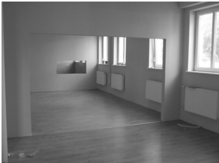
Pomieszczenia Centrum Usług Medycznych

W pomieszczeniach znajdujących się na pierwszej kondygnacji budynku Centrum Usług Medycznych, przy ulicy Kosieczyskiej w Zbąszynku, dobiegły końca prace budowlane. Ich celem była adaptacja dawnych pomieszczeń pomocniczych ośrodka zdrowia PKP na tzw. „Klub Seniora”. W zaadaptowanych pomieszczeniach planuje się zorganizowanie usługowego obiektu użyteczności publicznej. Będą tam