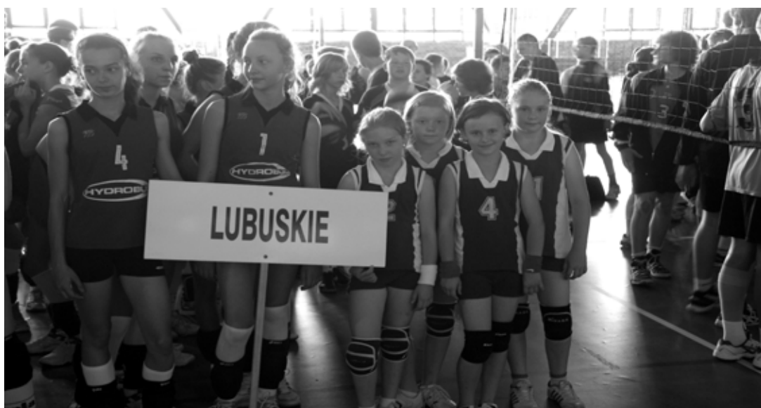
Zawodniczki z Kosieczyna na otwarciu Mistrzostw

borowym towarzyszyństwie Zabrzeńskich Finałów znalazły się młode siatkarki ze Szkoły Podstawowej w Kosieczynie: Kor-