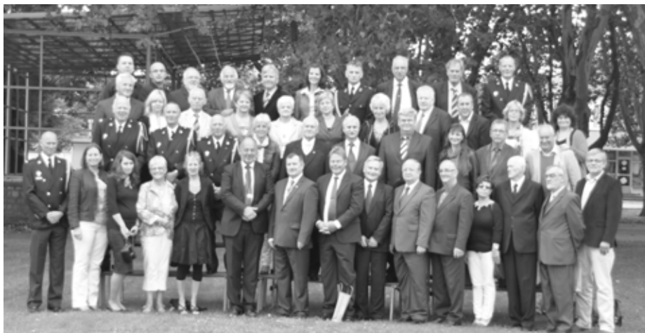
Pamiątkowe zdjęcie uczestników spotkania

Spotkanie z okazji jubileuszu było kolejnym dowodem na to, że łączy nas prawdziwa przyjaźń oraz, że mimo różnic należymy do tej samej społeczności jaką jest Unia Europejska.