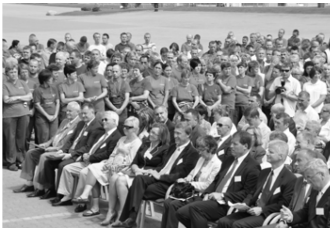
20 - lecie Swedwood