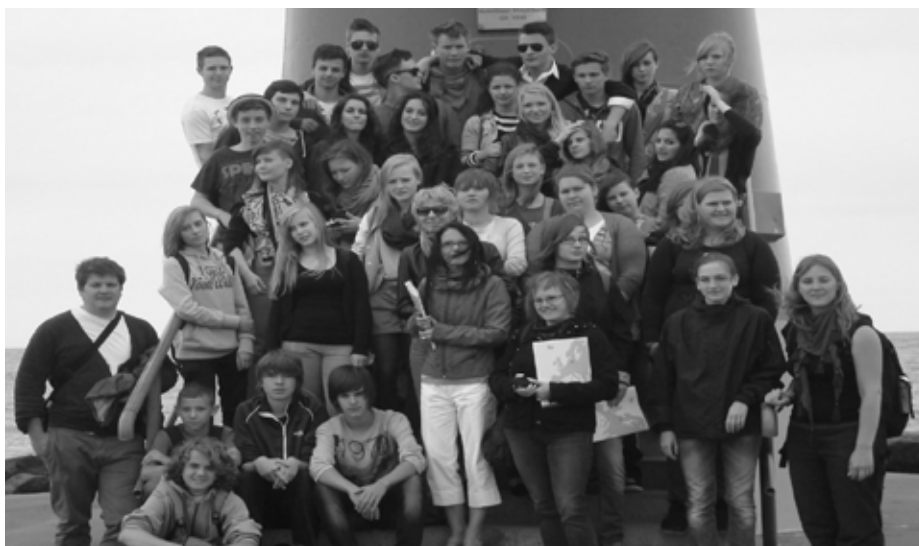
Wycieczka do latarni morskiej

ramach Programu Operacyjnego Kapitał Ludzki. Projekt realizowany będzie wraz z Gimnazjum w Stawie. W ramach projektu planowane są w I Gimnazjum zajęcia wyrównawcze z języków obcych oraz zajęcia z przedmiotów ścisłych (matematyka, fizyka, chemia) dla całych oddziałów. Realizacja zajęć przewidziana jest na cały rok szkolny 2012/2013. Szkoła zostanie także wyposażona w 2 zestawy tablic multimedialnych (łącznie z rzutnikami, laptopem) a wszyscy uczniowie - w bezpłatne podręczniki do tych zajęć. Całkowity koszt projektu (zerowy wkład własny) - 459 022,98 zł.