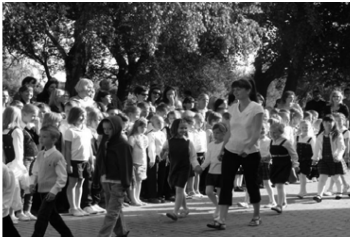
Rozpoczęcie roku szkolnego 2012/2013

Jesteśmy przekonani, że przy okazji sprzątania kształtujemy u uczniów postawy szacunku do przyrody, wywołujemy troskę o wszystkie jej elementy: ziemię, drzewa, zwierzęta, wodę.