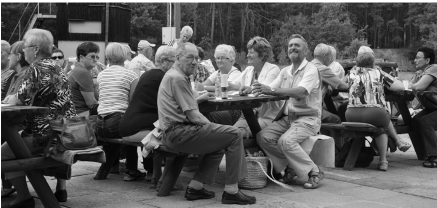
Wakacyjne spotkania seniorów

ferze, a okoliczne lasy i sprzyjająca aura zachęcały nie tylko do wspólnego biesiadowania, ale również grzybobrania. Spotkania tego rodzaju potwierdzają dużą aktywność naszych seniorów, a my z przyjemnością przyglądamy się ich działaniom, energii i radości.