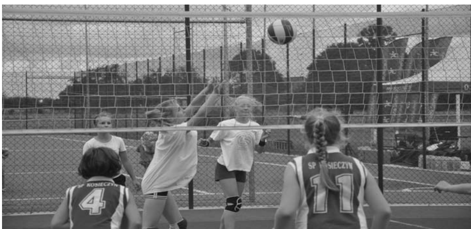
Spotkanie drużyn w Turnieju „Orlik Volleymania”

Drugoligowa drużyna siatkarska z Polski i pierwszoligowa z Holandii stanęły naprzeciw siebie w pokazowym pojedynku 9 września 2012 r. w hali ZST w Zbąszynku. I choć pozornie fawo-