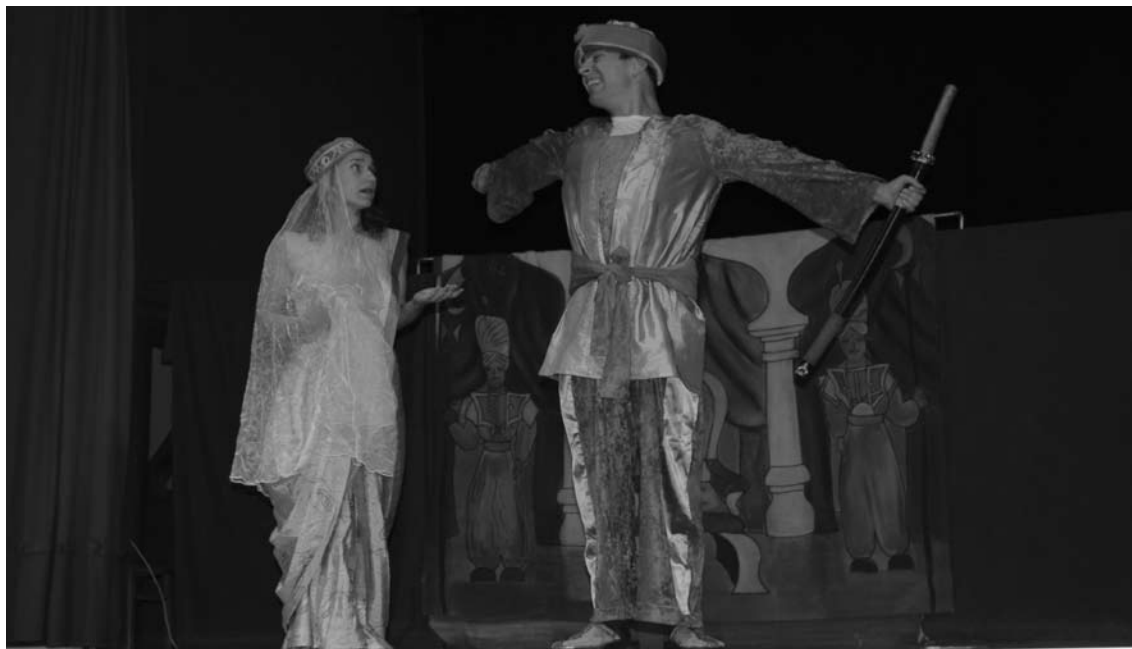
Teatr Rubinowy Książę