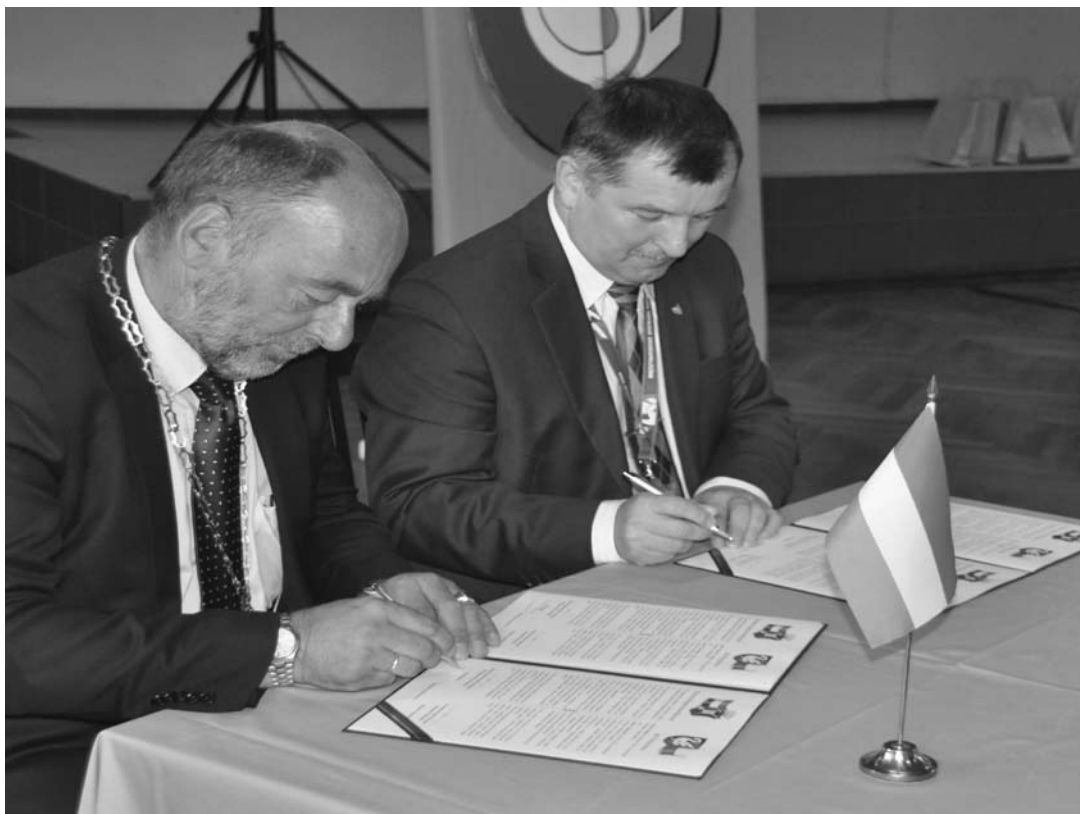
Odnowienie porozumienia o współpracy partnerskiej

się od Holendrów szeroko rozumianej demokracji. Następnie wzajemne kontakty od stowarzyszeń i organizacji po kontakty indywidualne. Obecnie jest to czas współpracy i wykorzysty-