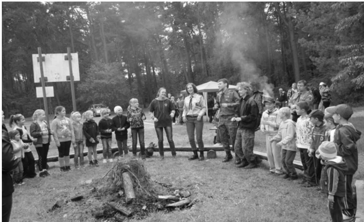
II Piknik Rodzinny

wszystkich punktów okazało się, że w grupie klas młodszych I miejsce zajęła klasa I, a w grupie klas starszych I miejsce zajęła klasa V. Dla wszystkich rodziców przygotowali herbatkę, kawę,