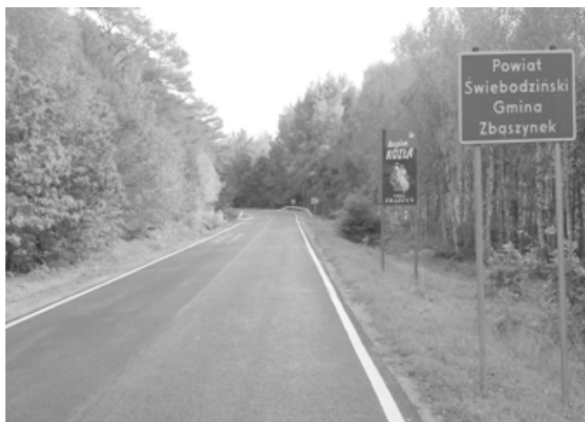
Wyremontowany fragment drogi

Zarządzającymi drogą powiatową ze Zbąszynia do Trzcienia są trzy samorządy: Powiat Międzyrzecz, Świebodziń i Nowy Tomyśl. Odcinek drogi powiatowej pomiędzy Zbąszyniem i Trzcieniem o długości 630 m, przebiegający przez teren Gminy Zbąszynek został właśnie wyremontowany i przekazany do