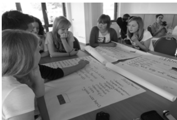
Wspólne zajęcia nad projektem

nad Menem, uczestniczyli w projekcie Bilinguales EU-Seminar w Ribnitz - Dammgarten. Projekt był współfinansowany przez Polsko - Niemiecką Wymianę Młodzieży. W projekcie uczestniczyło 15 uczniów i 2 nauczycieli I Gimnazjum. W trakcie pięciodniowych zajęć uczniowie mieli możliwość nie tylko poznania walorów geograficznych terenów nadbałtyckich na-