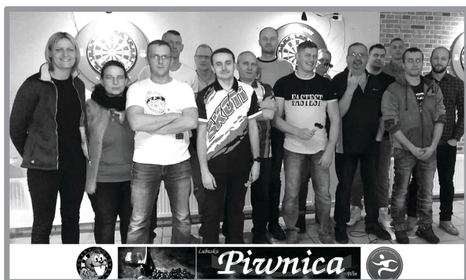
MIKOŁAJKOWY TURNIEJ DARTA 14.12.2019