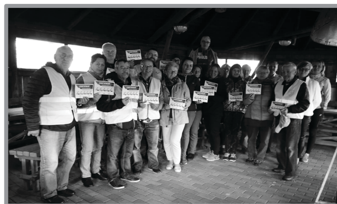
ROWEROWY RAJD SENIORÓW 10.10.2019