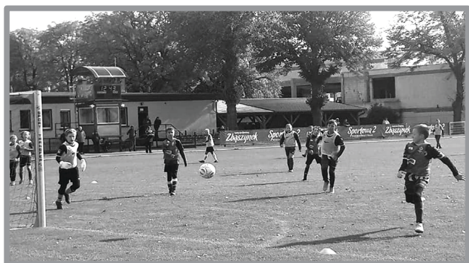
KONSULTACJA SELEKCYJNA REPREZENTACJI WOJEWÓDZTWA LUBUSKIEGO ROCZNIKA 2008 10.10.2019