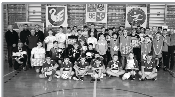
MIKOŁAJKOWY TURNIEJ PIŁKI NOŻNEJ - DĄBRÓWKA WLKP.