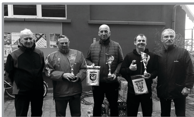
TURNIEJ TKKF SEMAFOR ZBĄSZYNEK 05.10.2019