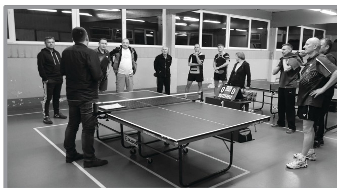
II TURNIEJ 13. MISTRZOSTW GMINY ZBĄSZYNEK W TENISIE STOŁOWYM O PUCHAR BURMISTRZA ZBĄSZYNKA 22.11.2019