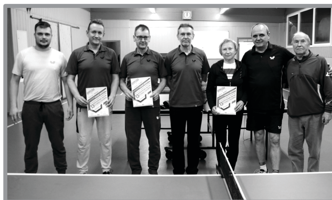
III TURNIEJ 13. MISTRZOSTW GMINY ZBĄSZYNEK W TENISIE STOŁOWYM O PUCHAR BURMISTRZA ZBĄSZYNKA