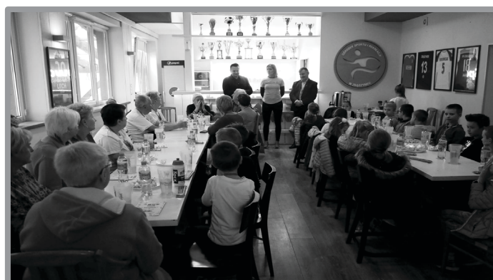
SENIORZY NA ORLIKI - ŚNIADANIE 10.10.2019