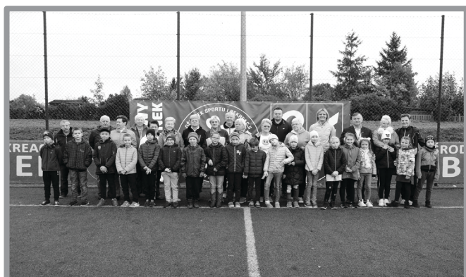
SENIORZY NA ORLIKI - ŚNIADANIOWA SPARTAKIADA SENIORÓW 10.10.2019

tym obiekcie. Czekają nas również dwa duże wydarzenia piłkarskie - Lubuski Finał Pucharu Polski oraz Wojewódzki Finał Tymbarka. Dziękując za cały rok 2019 oraz życząc wszelkiej pomyślności w 2020 roku zapraszam na graficzny przegląd ostatniego kwartału 2019 roku.