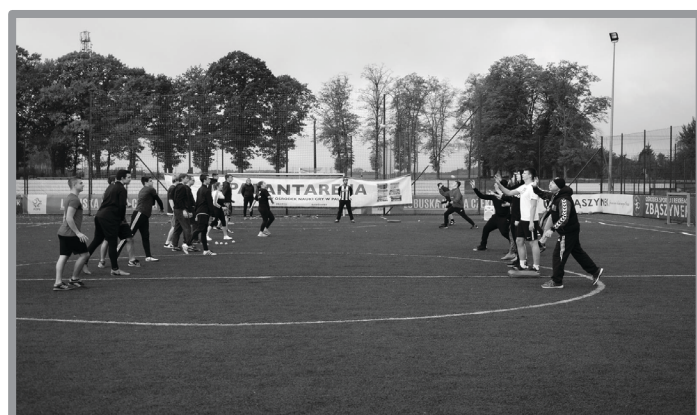
PALANT POWRACA Z CKZIU W ZBĄSZYNKU 09.10.2019