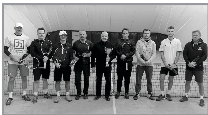
NIEPODLEGŁOŚCIOWY DEBŁOWY TURNIEJ TENISA ZIEMNEGO 10.11.2019