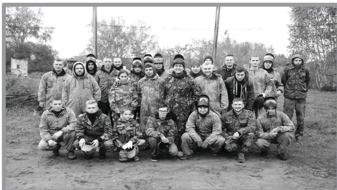
2 ZBĄSZYNEK PAINTBALL CUP 05.10.2019