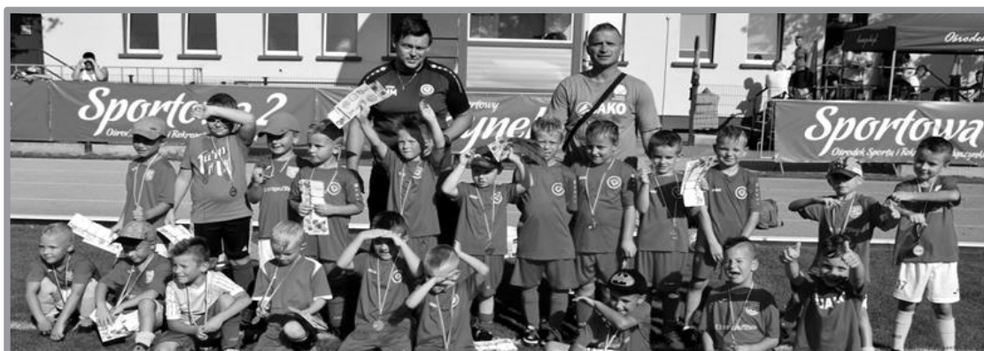
TURNIEJ PIŁKI NOŻNEJ SKRZATÓW