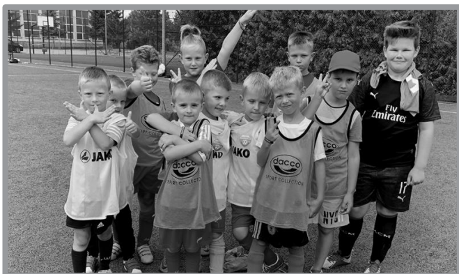
OTWARTE ZAJĘCIA PIŁKI NOŻNEJ

piłkarskie rozpoczęły sezon piłkarski 2019/2020, a warte podkreślenia są starania podjęte przez Zbąszynecką Akademię Piłkarską w celu uzyskania certyfikacji PZPN dla szkółki piłkarskiej. Równoległe w tym okresie prowadzone były prace związane z budową zbąszyneckiej hali sportowej.