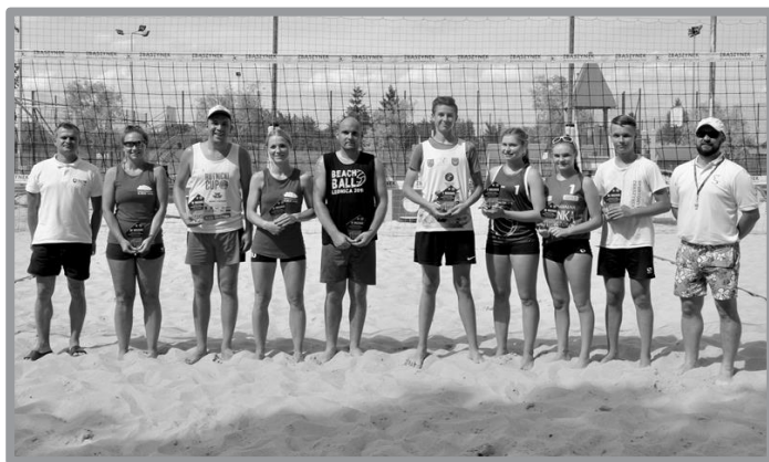
OTWARTY TURNIEJ SIATKÓWKI PLAŻOWEJ MIKSTÓW