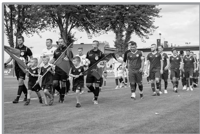
INAUGURACJA 4 LIGI - SYRENA ZBĄSZYNEK