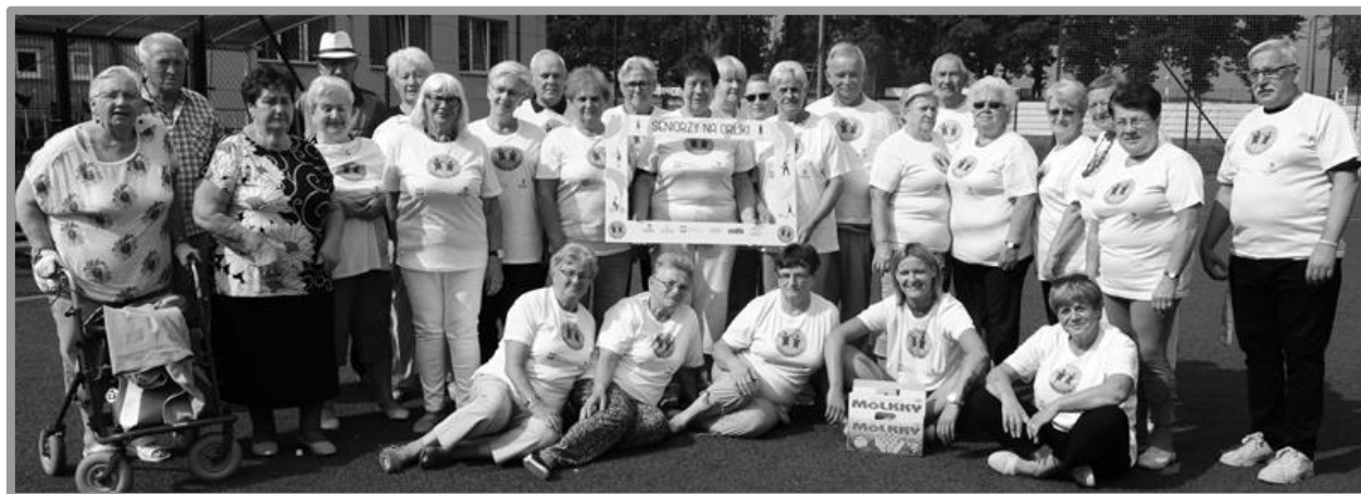
SENIORZY NA ORLIKI