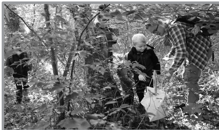
IV RAJD KOZIOŁKA W KRĘCKU