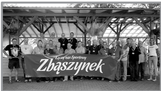
II GMINNY TURNIEJ KOPA