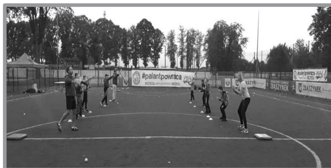
#PALANTPOWRACA - ORLIK ZBĄSZYNEK

W NAJBLIŻSZYM CZASIE M.IN.: II ZBĄSZYNEK PAINTBALL CUP TURNIEJ PIŁKI NOŻNEJ OLDBOJÓW SENIORZY NA ORLIKI SPORTOWA AKADEMIA PRZEDSZKOLAKA „ŁABĄDEK” ŚNIADANIOWA SPARTAKIADA SENIORÓW RAJD ROWEROWY SENIORÓW MISTRZOSTWA GMINY ZBĄSZYNEK W TENISIE STOŁOWYM O PUCHAR BURMISTRZA ZBĄSZYNKA NIEPODLEGŁOŚCIOWY TURNIEJ TENISA ZIEMNEGO O PUCHAR PRZEWODNICZĄCEGO RADY MIEJSKIEJ MIKOŁAJKOWY TURNIEJ DARTA MIKOŁAJKOWY TURNIEJ PIŁKI NOŻNEJ SZKÓŁ PODSTAWOWYCH