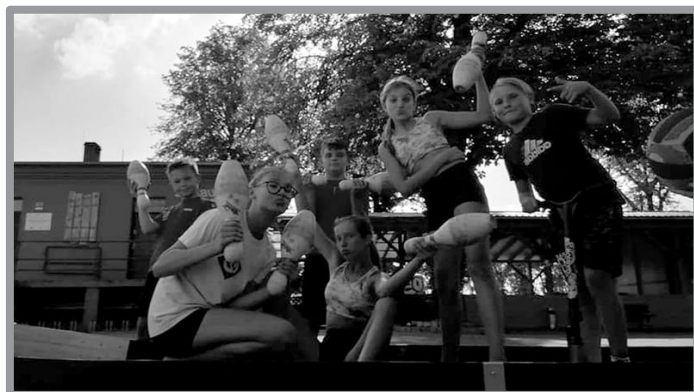
PLENEROWY TURNIEJ W KRĘGLE