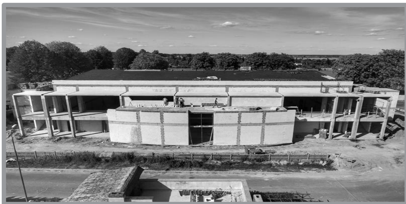
ZBĄSZYNECKA HALA SPORTOWA - POSTĘP PRAC