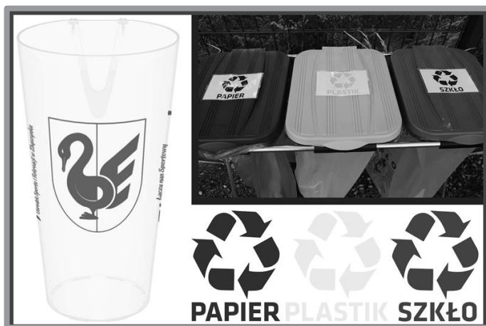
EKO OŚRODEK SPORTU I REKREACJI W ZBĄSZYNKU