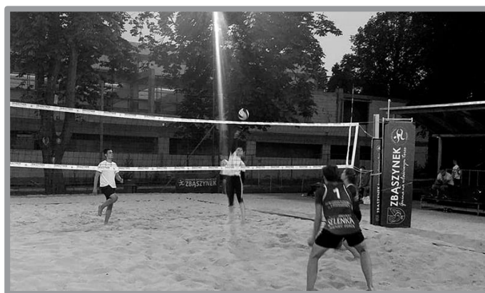
NOCNE GRANIE W SIATKÓWKĘ PLAŻOWĄ