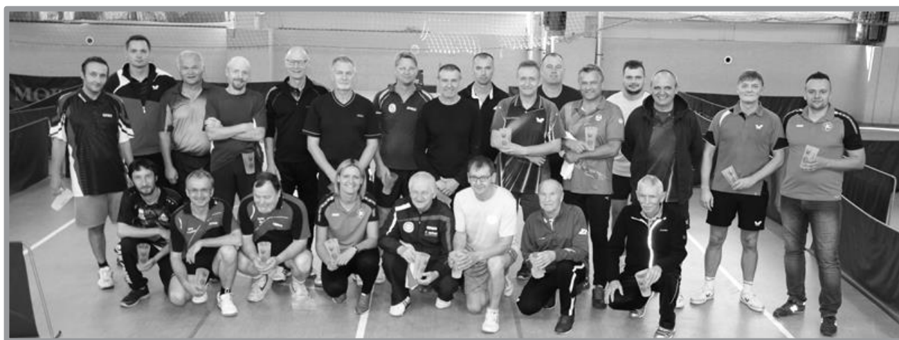
POLSKO - NIEMIECKI TURNIEJ TENISA STOŁOWEGO