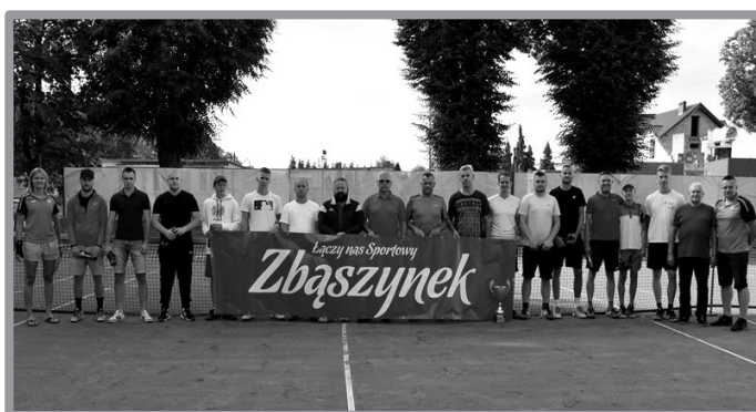
TURNIEJ TENISA ZIEMNEGO O PUCHAR PRZEWODNICZĄCEGO RADY MIEJSKIEJ