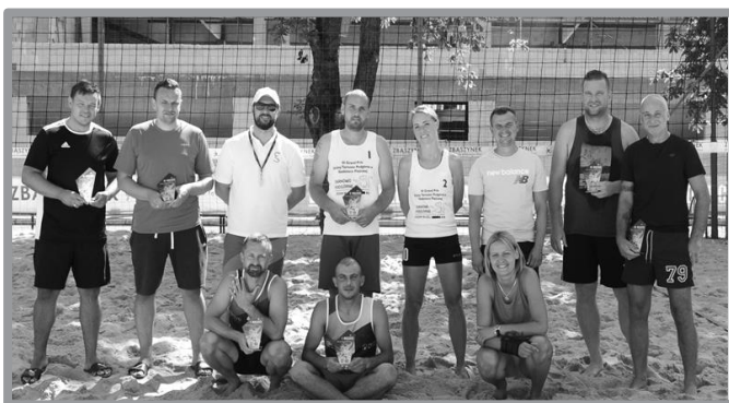
TURNIEJ SIATKÓWKI PLAŻOWEJ 30+