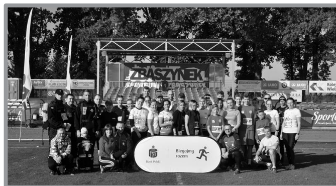
5 PKO BIEG CHARYTATYWNY