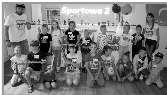
WAKACJE Z LEGO