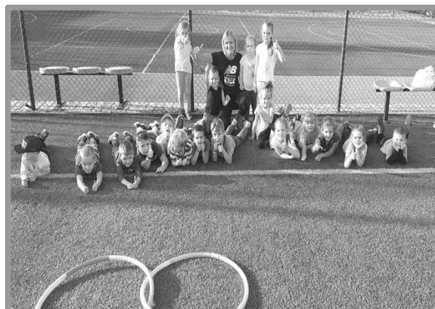
SPORTOWA AKADEMIA PRZEDSZKOLAKA ŁĄBADEK