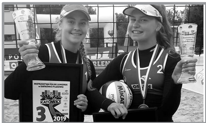
BRAZOWY MEDAL MISTRZOSTW POLSKI JUNIOREK W SIATKÓWCE PLAŻOWEJ