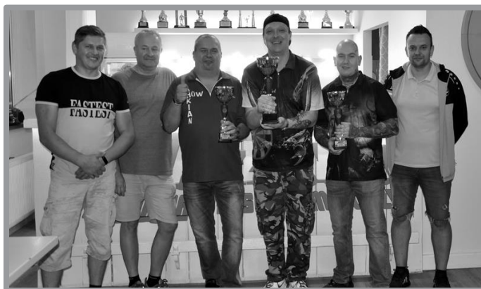
V OTWARTE MISTRZOSTWA ZBĄSZYNKA W STEEL DARTA