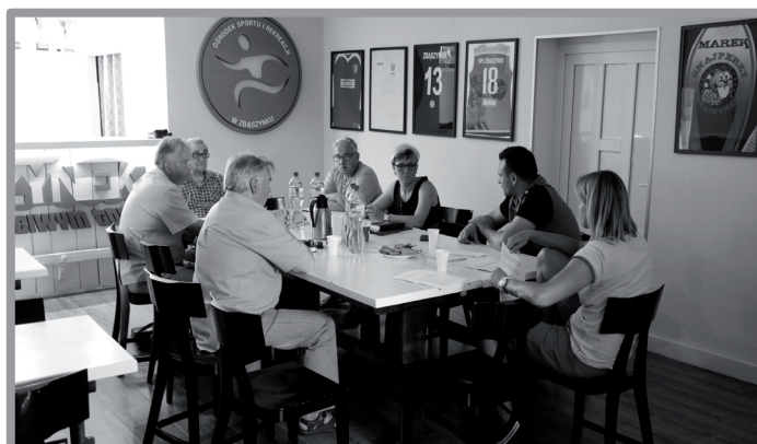
SENIORZY NA ORLIKI - INAUGURACJA PROGRAMU - 06.06.2019