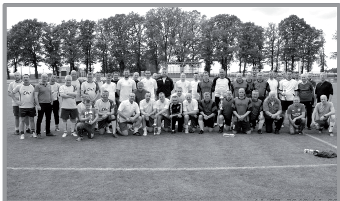
TURNIEJ PIŁKI NOŻNEJ OLDBOJÓW - 11.05.2019