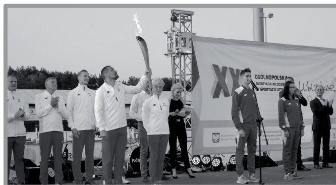
OTWARCIE XXV OGÓLNOPOLSKIEJ OLIMPIADY MŁODZIEŻY W SPORTACH LETNICH - DRZONKÓW, 04.06.2019