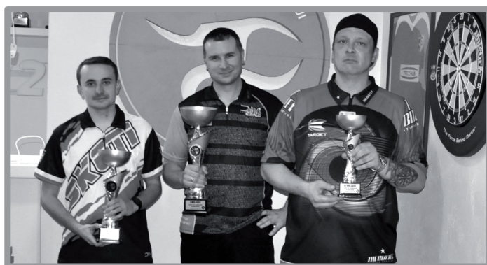
TURNIEJ STEEL DARTA NA ZAKOŃCZENIE SEZONU - 28.06.2019