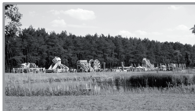
GMINNY DZIEŃ DZIECKA - 02.06.2019