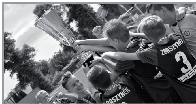
17 TURNIEJ PIŁKI NOŻNEJ IM. ANDRZEJA ŁESZYKA - 16.06.2019