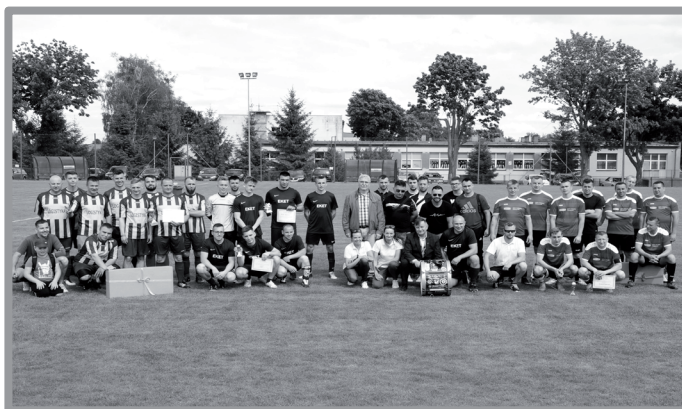
TURNIEJ IKEA - 25.05.2019