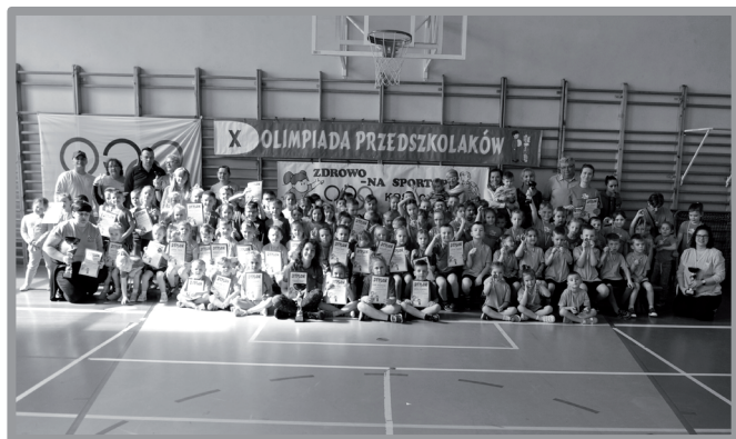
OLIMPIADA PRZEDSZKOLAKÓW W KOSIECZYNIE - 02.04.2019

zadania inwestycyjno-modernizacyjne. O tym wszystkim w graficznym skrócie.