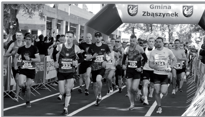
27 BIEG KONSTYTUCJI - 03.05.2019