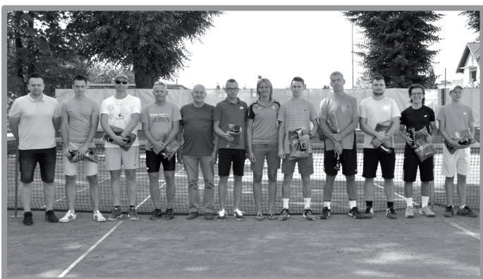
III TURNIEJ TENISA ZIEMNEGO IM. MARIANA LEWANDOWSKIEGO - 29.06.2019