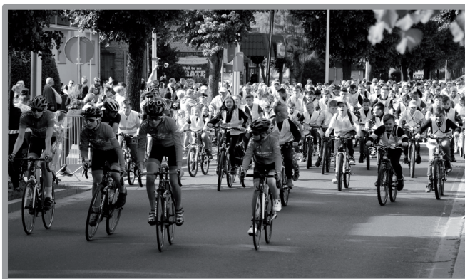
ZBĄSZYNEK NA ROWERY - 23.05.2019