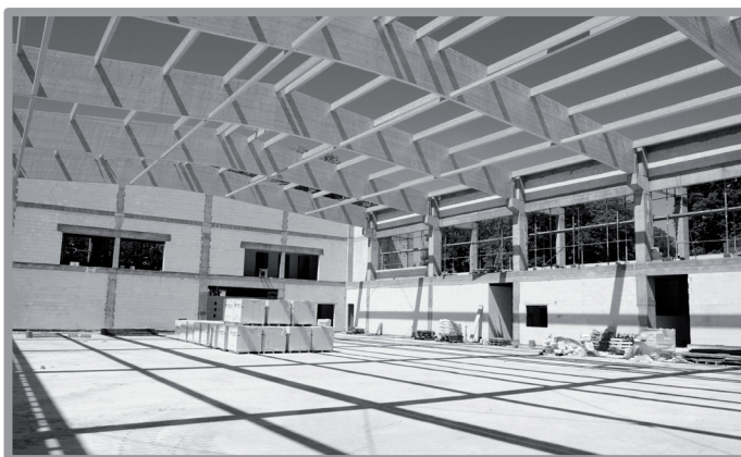
ZBASZYNECKA HALA SPORTOWA - 27.06.2019