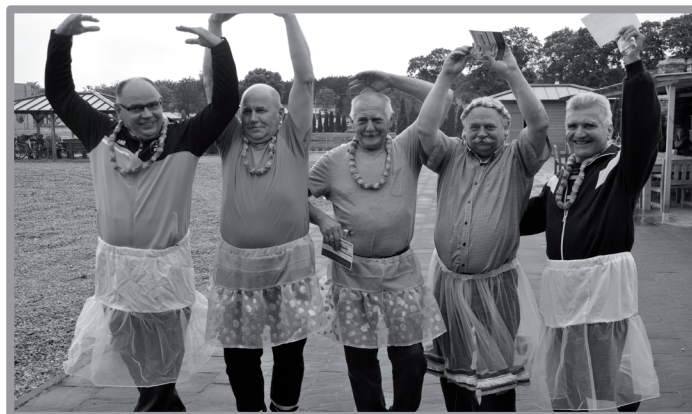
FESTYN KGW DĄBRÓWKA WLKP. - 28.05.2019