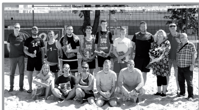
II TURNIEJ SIATKÓWKI PLAŻOWEJ „KU PAMIĘCI KONRADA AUGUSTYNIAKA” - 08.06.2019