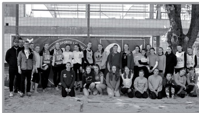
TURNIEJ SIATKÓWKI PLAŻOWEJ O PUCHAR PREZESA SPS ZBĄSZYNEK - 11.05.2019