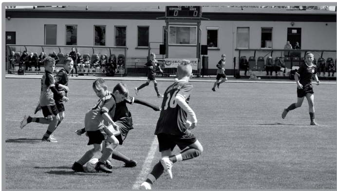
LUBUSKA KADRA CZEKA - KONSULTACJA ZAWODNIKÓW Z RÓCZNIKA 2006, 2007 - 14.05.2019