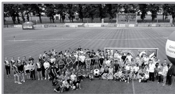
MEMORIAŁ LA IM. BOGDANA NIEMCA - 31.05.2019