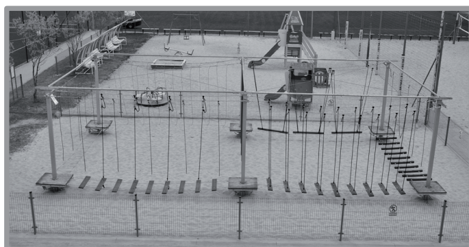
MODERNIZACJA PLACU ZABAW - 11.04.2019