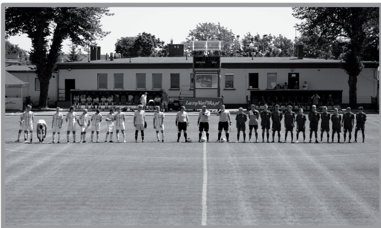
MISTRZOSTWA POLSKI U-14 W PIŁCE NOŻNEJ - 25-30.06.2019