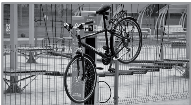
STACJA NAPRAWY ROWERÓW - BUDŻET OBYWATELSKI - 11.04.2019