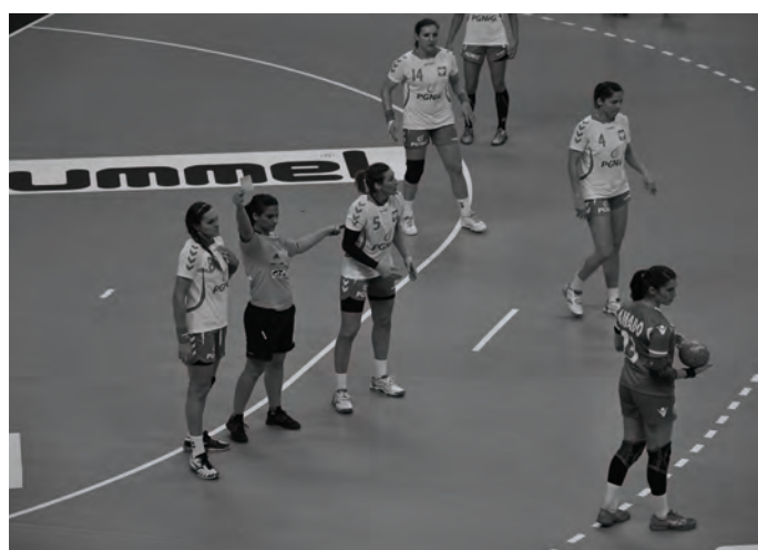
Piłka ręczna Polska - Portugalia. Byliśmy na meczu polskiej reprezentacji w Zielonej Górze.