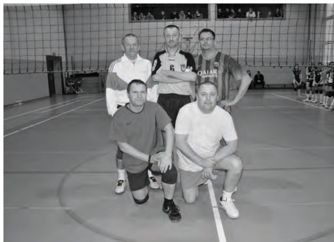
Nauczyciele zwyciężają w XVI Turnieju Piłki Siatkowej o Puchar Przewodniczącego Rady Miejskiej.