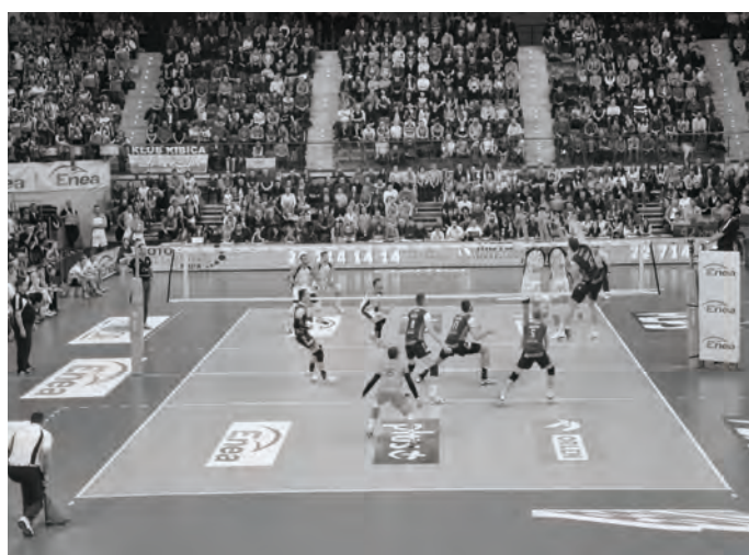
16 marca 2014 byliśmy na Finale Pucharu Polski w siatkówce mężczyzn Zaksa - Jastrzębski Węgiel.