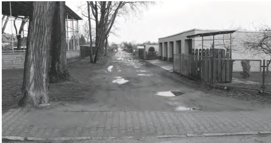
Obecny stan drogi

W najbliższym czasie rozpoczęte zostaną prace przy utwardzeniu odcinka drogi dojazdowej do garaży pomiędzy ulicą Wąską a Klubową w Zbąszynku. Plan prze-