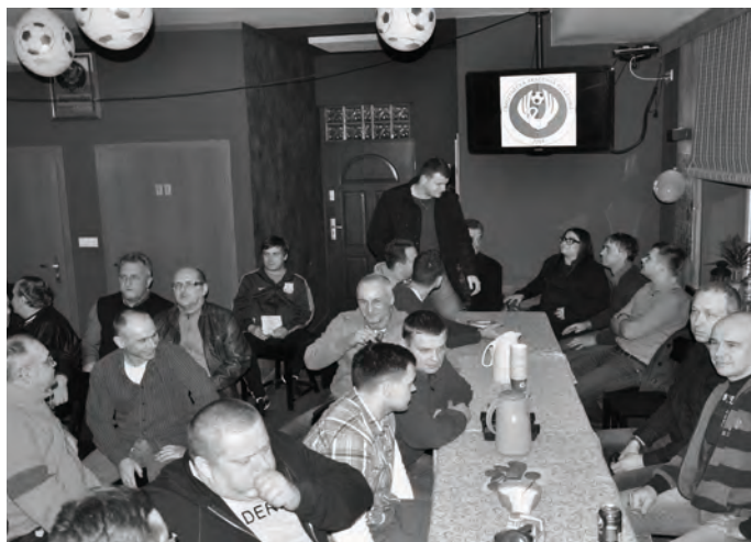
28 lutego 2014 w Pubie Gol powołano Zbąszynecką Akademię Piłkarską.