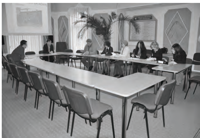
To pewne - powstanie Strefa Piłki Siatkowej. 4 marca 2014 w Urzędzie Miejskim odbyło się pierwsze spotkanie w tej sprawie.