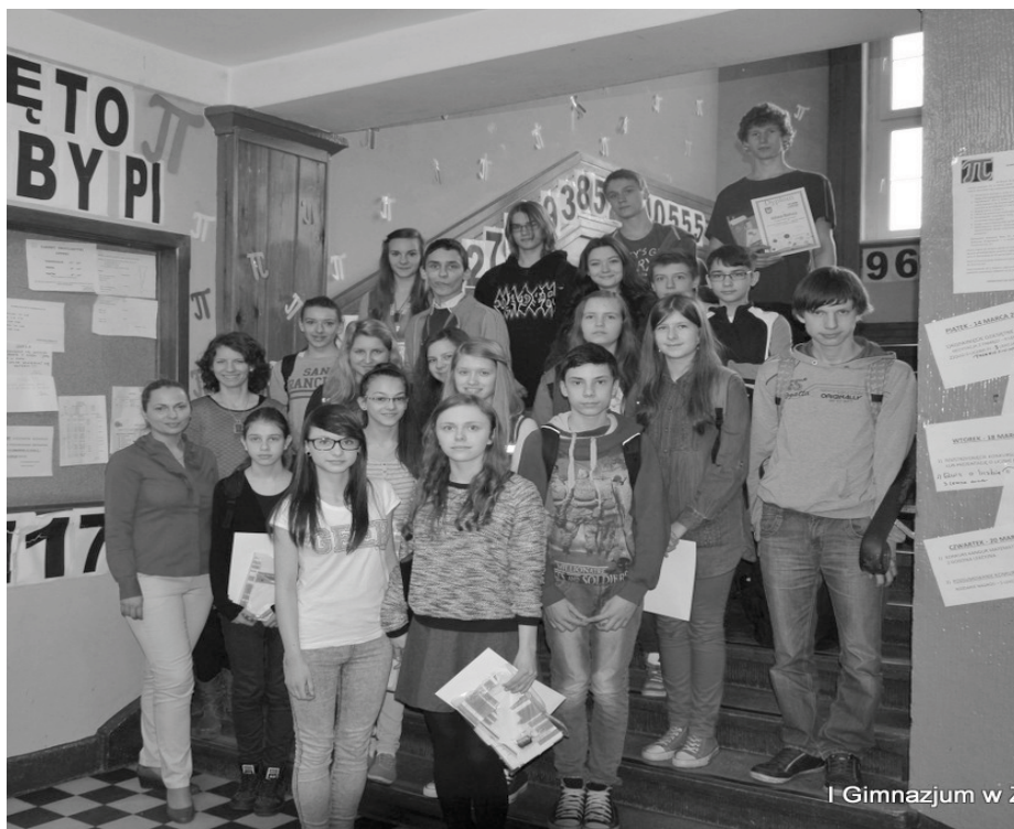
Zwycięzcy konkursu matematycznego w ramach Tygodnia Liczby „π”