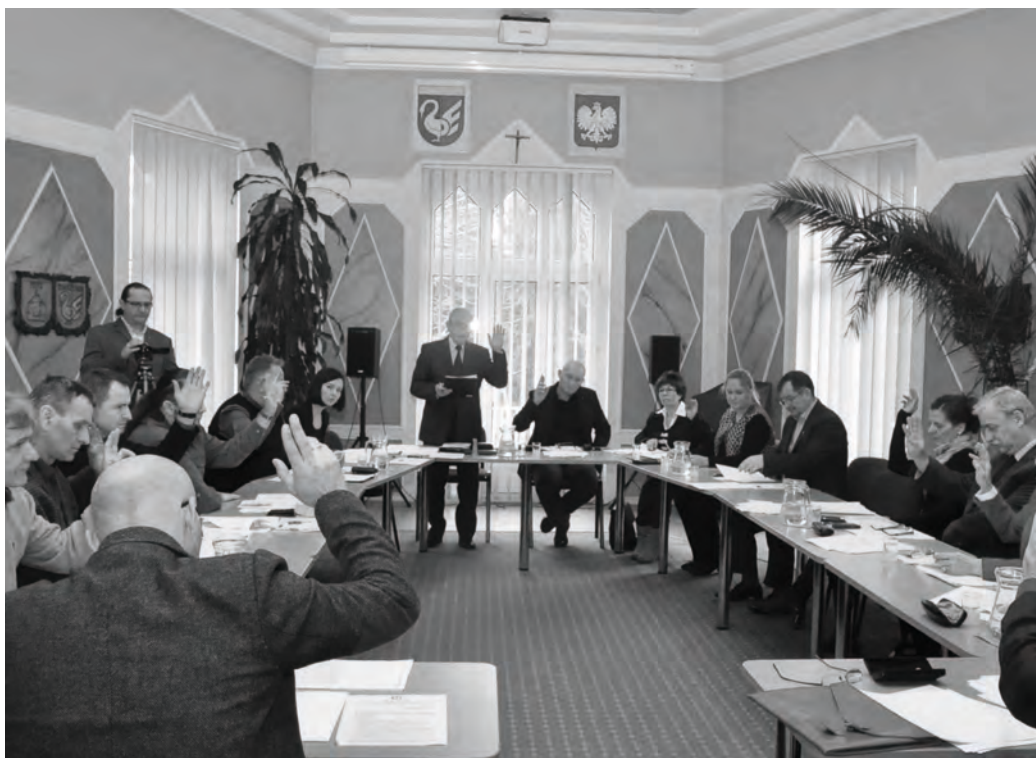
Głosowanie uchwały w sprawie przyjęcia Strategii Rozwiązywania Problemów Społecznych Gminy Zbąszynek na lata 2014-2023

malizowanie rozmiarów i skutków innych zjawisk społecznie negatywnych