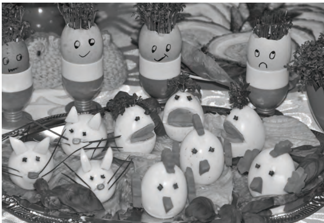
Smaczne a zarazem dowcipne potrawy Wielkanocje

Przyjazna atmosfera oraz powiększające się z roku na rok grono publiczności świadczą o tym, iż wydarzenie cieszy się coraz większą popularnością.