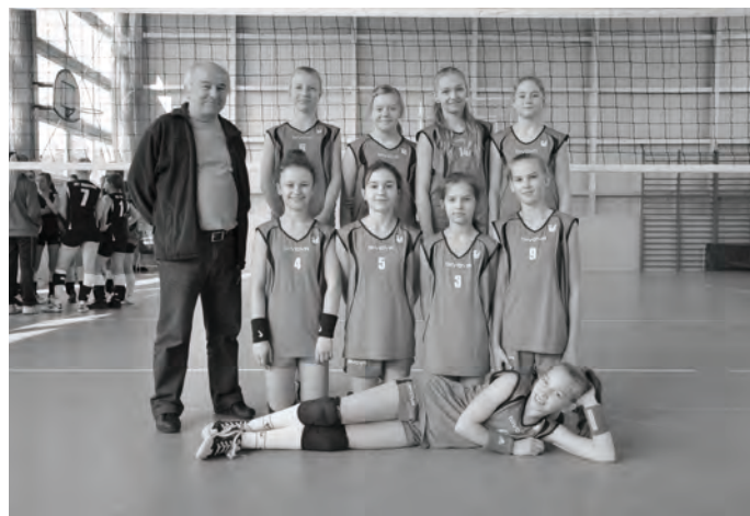
Turniej Piłki Siatkowej TV Sport Info. Zwyciężyła Szkoła Podstawowa z Kosieczyna