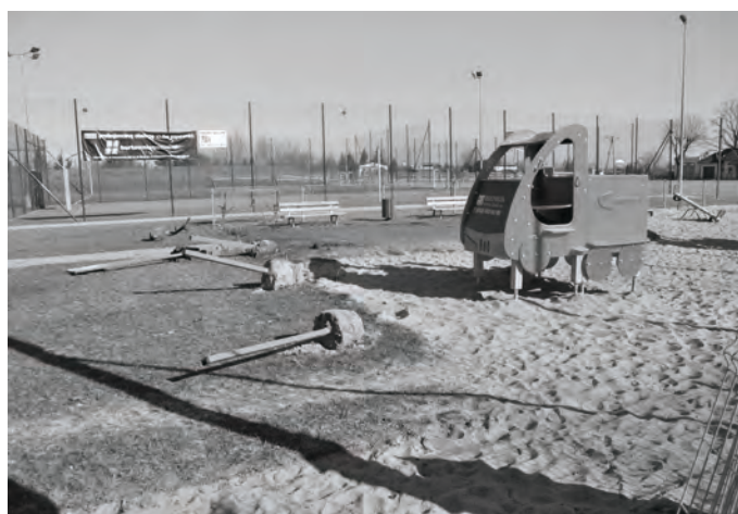
Modernizacja placu zabaw - powiększamy i ulepszymy plac zabaw.