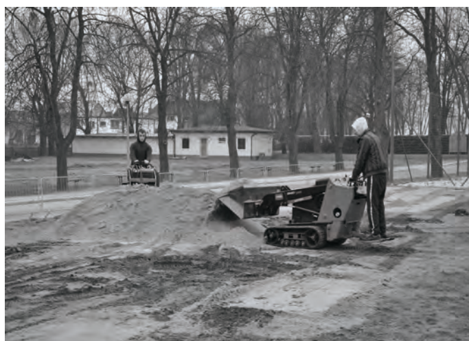
Boisko treningowe w Zbąszynku w końcowej fazie modernizacji.