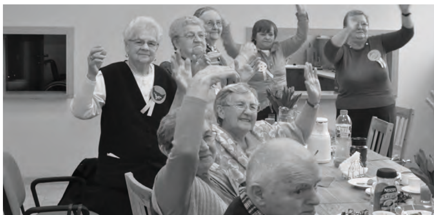
Miło się bawimy

5 listopada 2013 ruszyły zajęcia w Domu Dziennego Pobytu. Dom jest otwarty dla wszystkich potrzebujących tego rodzaju wsparcia, przez trzy dni w tygodniu: wtorek, środa, czwartek, w godz. 10:30 - 14:30, przy czym we wtorki Dom prowadzi zajęcia dla seniorów z Rogozińca, Dąbrówki i Zbąszynka, w środę dla seniorów z Kręcka, Kosieczyna i Zbąszynka; w czwartek spotykają się seniorzy z Chlastawy i Zbąszynka. Tygodniowo w zajęciach Domu Dziennego Pobytu uczestniczy oko-