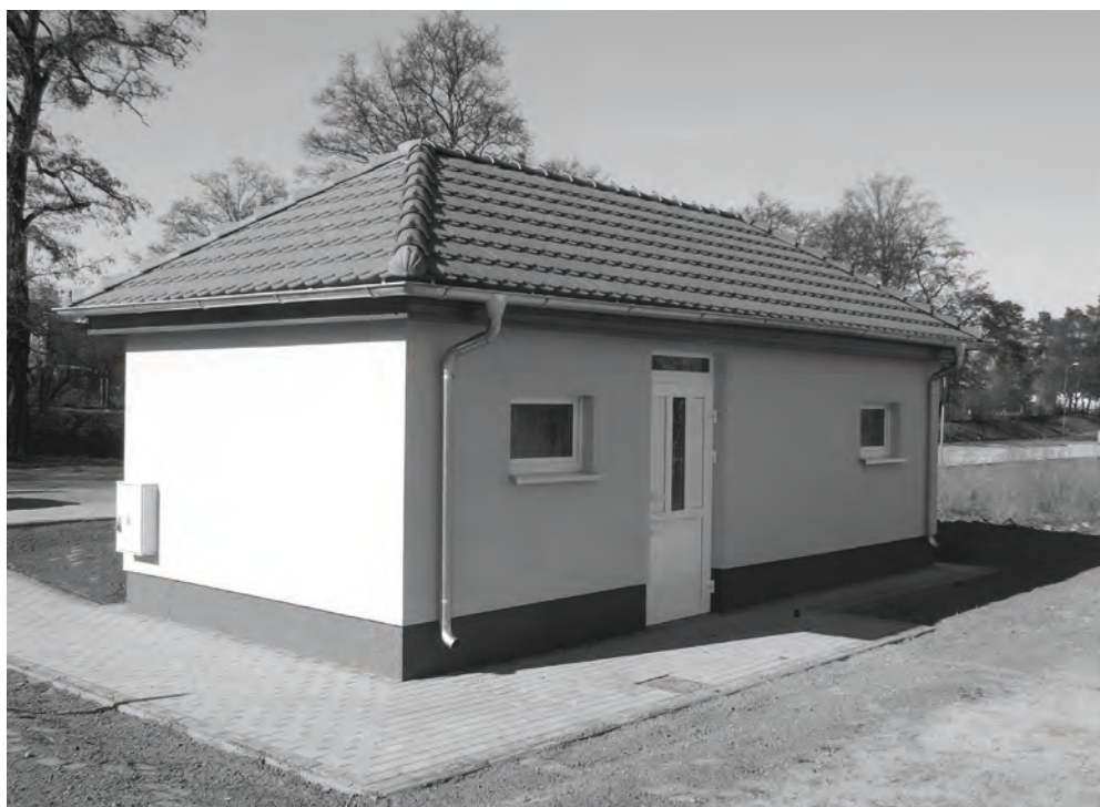
Wyremontowany budynek ogrzewalni przy ulicy Kosieczyskiej

Korzystający z ogrzewalni ma obowiązek okazania dokumentu tożsamości na żądanie, przestrzegania regulaminu ogrzewalni. W ogrzewalni obowiązuje całkowity zakaz wnoszenia oraz spożywania alkoholu, substancji psychoaktywnych oraz palenia tytoniu.