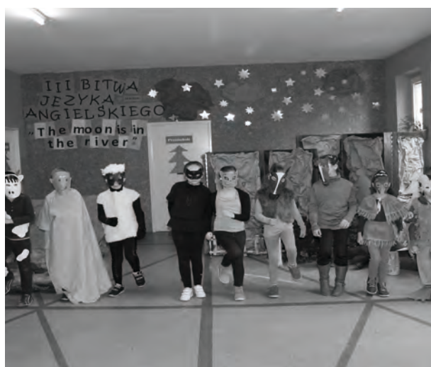
Klasa II w przedstawieniu pt. „The moon is in the river”

grany w języku angielskim. Po teatrzyku nadszedł czas na konkursy. Każda klasa w swojej kategorii (kl. I-III i IV-VI) miała za zadanie przystąpić do sześciu konkurencji. Klasy I-III rozwiązywały zadania dotyczące słownictwa: podpisywały obrazki poprawnym wyrażeniem/wyrazem czy wykonywały zadania ze słuchu. Klasy IV-VI świetnie popisały się w