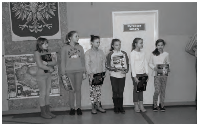
Mistrzyni i wicemistrzyni Szkolnego Konkursu Ortograficznego kl. IV-VI

okazja dla uczniów, aby sprawdzić swoje umiejętności posługiwania się językiem angielskim w mowie i piśmie metodą konkursu. W części pierwszej potyczek językowych klasa II zaprezentowała teatrzyk pod tytułem „The moon is in the river”, który w całości został ode-