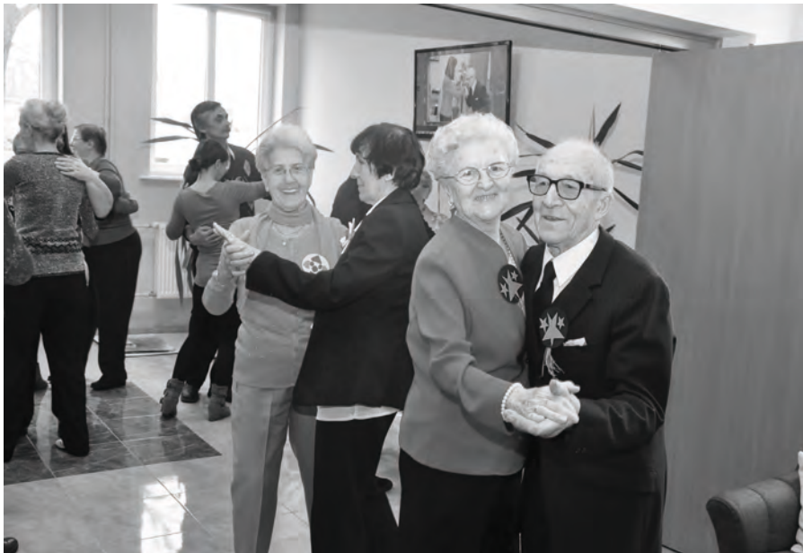
Seniorzy na parkiet!

Na koniec zabawy podsumowano, że gdyby to było kilka lat temu, to te dwie godziny zabawy byłoby za mało.