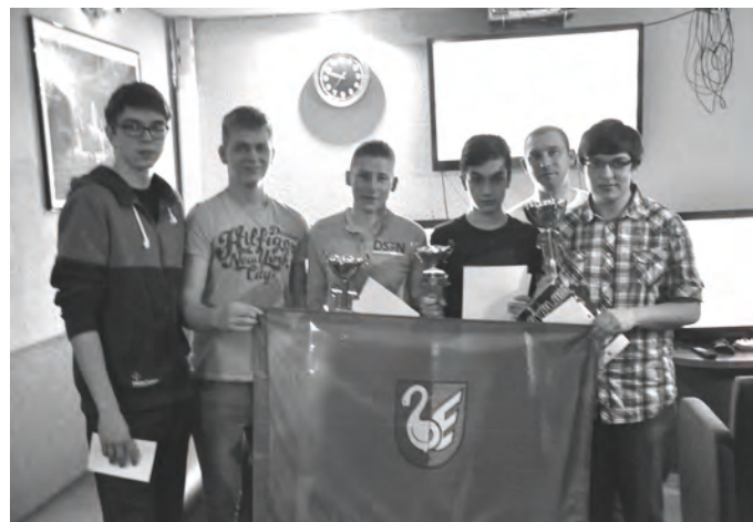
FIFA CUP - zwyciężył Michał Janas (Real Madryt)