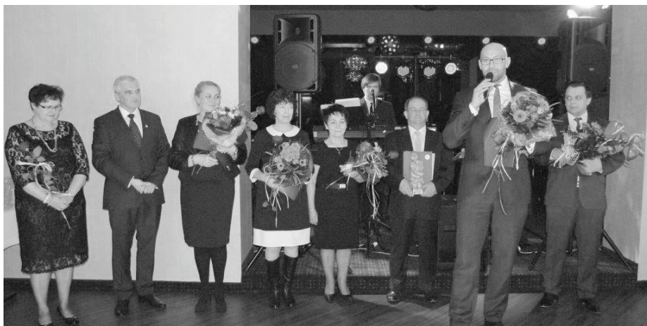
Wyróżnieni za pracę na rzecz gmin Regionu Kozła