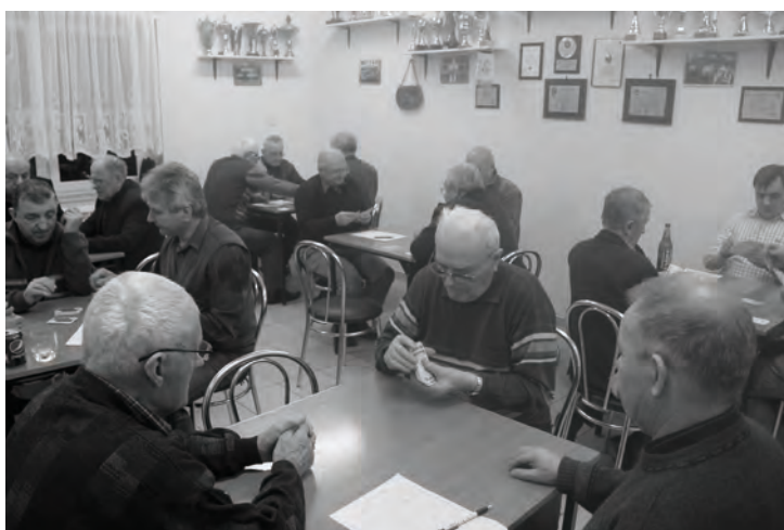
Uczestnicy turnieju skata w Dąbrowce Wlkp.