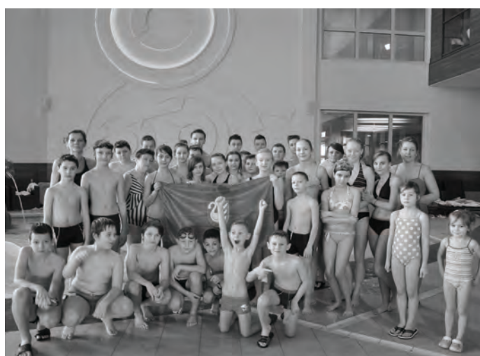
30 uczniów klas III SP rozpocznie powszechną naukę pływania