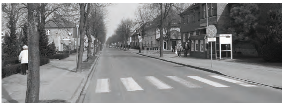
Odcinek drogi Wojska Polskiego

kańcy zadawali pytania. Zainteresowanie budziła ilość przewidzianych drzew do wycinki, zamiennych nasadzeń nowych drzew, parametrów i ilości nowych miejsc postojowych, odległości chodników od budynków, itp. Orientacyjny termin rozpoczęcia inwestycji Burmistrz określił na nie wcześniej niż rok 2015. Plan zagospodarowania ulicy dostępny na stronie internetowej www.zbaszynek.pl w zakładce bieżące inwestycje.