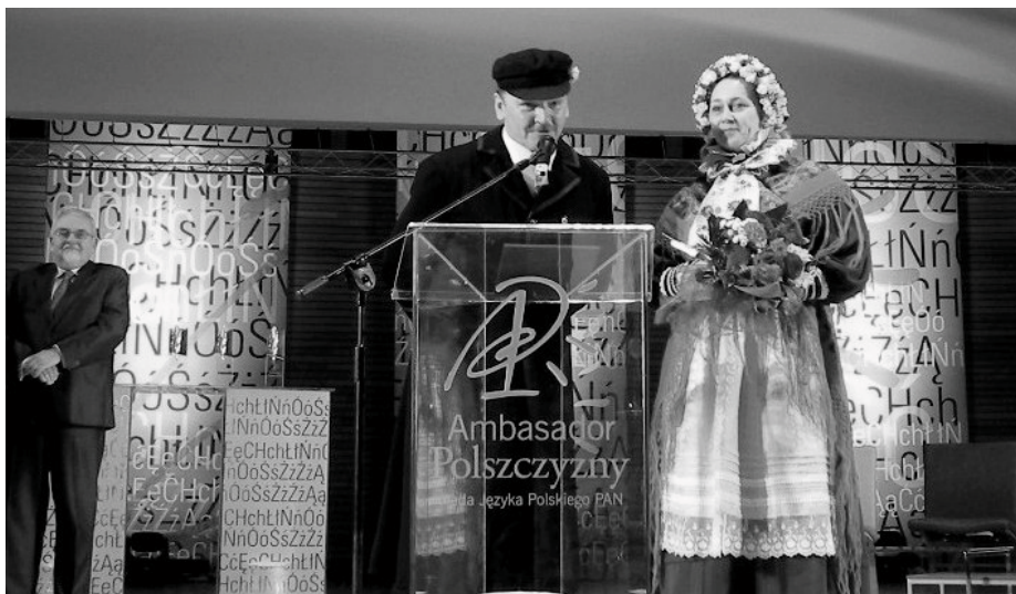
Przedstawiciele Zespołu podczas Gali

W uzasadnieniu nadania tytułu Kapituła napisała: cyt.: „Zespół od 90 lat pielęgnuje polszczyznę regionalną, przede wszystkim swoistą gwarę pogranicza polsko-łużyckiego. Czynił to w najtrudniejszych la-