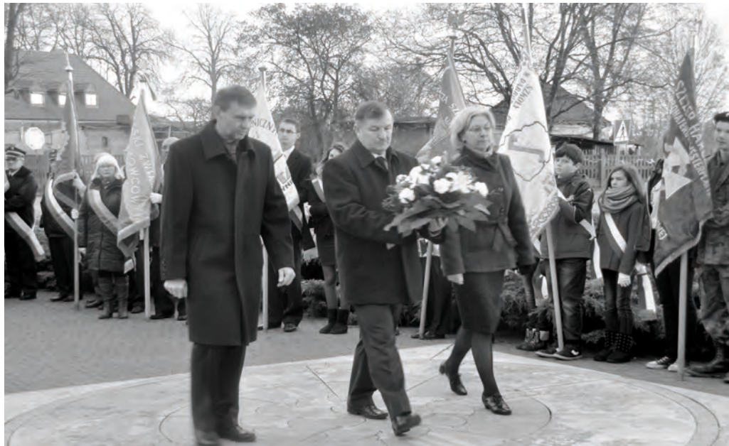
Delegacja Urzędu Miejskiego podczas składania wiązanki kwiatów

11 listopada to data szczególna w naszym ojczystym kalendarzu. Tego dnia obchodzimy Narodowe Święto Niepodległości, będące upamiętnieniem odzyskania niepodległości w 1918 roku. Uroczystości oficjalne oraz poprzedzające 95-tą Rocznicę Odzyskania Niepodległości trwały w Gminie Zbąszynek łącznie trzy dni.