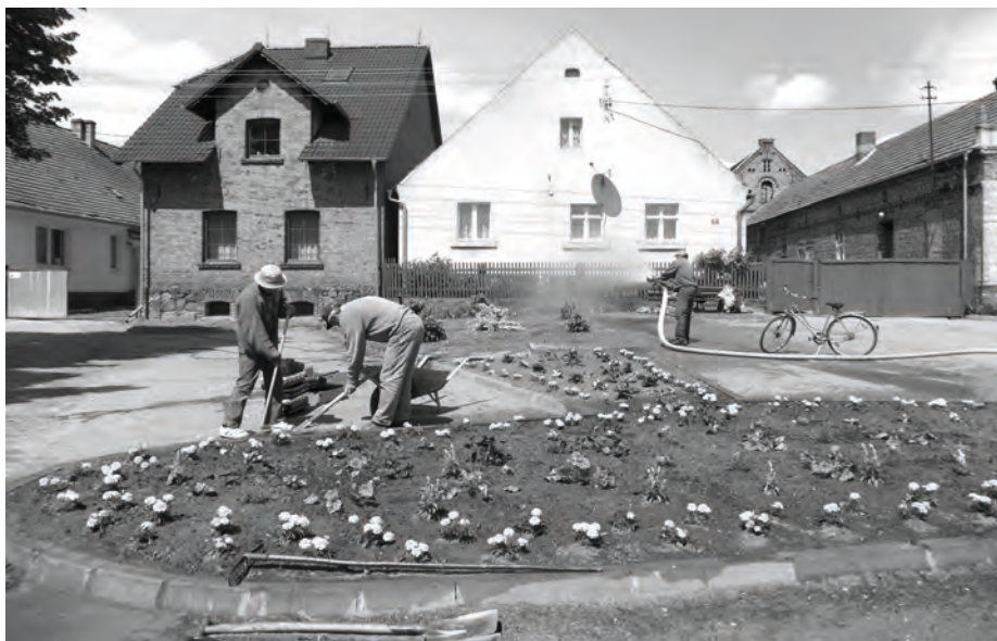
Realizacja programu „Odnaleźć siebie”

Osobom zaangażowanym we współpracę w ramach realizacji w/w projektu, w szczególności p. Grażynie Znamirskiej-Szwarc i osobom prowadzącym formy aktywizujące społeczność lokalną - serdecznie dziękujemy!