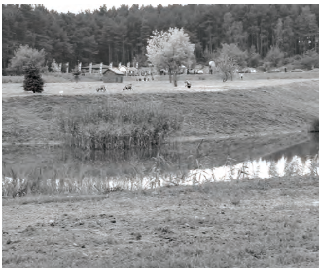
Widok na wyspę z koziołkami

Dzięki przychylności i zaangażowaniu kierownictwa firmy Swedwood, niedawno powstały tam również dwa parkingi oraz zamontowano duży metalowy wigwam. Obok ustawiono dwie mniejsze wiaty, jest także miejsce na ognisko oraz wc. W pobliżu znajduje się las, a przede wszystkim jest ... cisza i spokój. Teren oświetlono i ogrodzono jak również upiękuszono nasadzeniami nowych drzew i krzewów. Dookoła jeziora biegnie ścieżka, z której już od dawna korzystają rowerzyści, miłośnicy kijków oraz rolek. Z myślą o wędkarzach wybudowano pięć stałych pomostów i jeden pływający, przy którym zacumują łodzie i żaglówki. W dniu 10 października br. w tym pięknym miejscu odbyło się uroczyste zakończenie projektu zagospodarowania Jeziora Koźlarskiego. Spotkanie poprzedzone zostało ekopiknikiem ze zdrową żywnością.