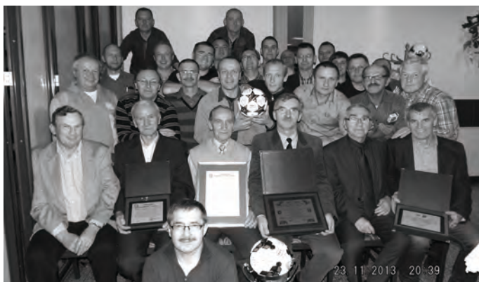
30-lecie powstania Towarzystwa Krzewienia Kultury Fizycznej „Semafor” w Zbąszynku - połączone z wyborem nowych władz statutowych