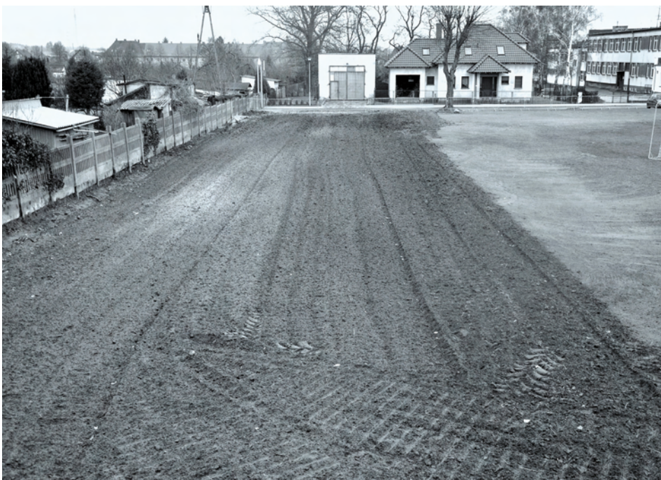
Teren boiska w przygotowaniu

Na terenie Ośrodka Sportu i Rekreacji w Zbąszynku trwają prace związane z modernizacją boiska treningowego. Głównym celem realizowanego zadania jest powiększenie wymiarów pola gry. Obecny wymiar boiska wynosi 90 metrów długości i 51 metrów szerokości. Po zmianach boisko uzyska długość 100 metrów i szerokość 60 metrów. W tym celu usunięto betonowe ogrodzenie od strony ulicy Topolowej oraz zlikwidowano skarpe od strony ogrodów działkowych. Obecnie teren jest już wyrównany i przygotowany do dalszych prac pielęgnacyjnych. Boisko uzyska również nowe ogrodzenie w postaci piłkochwyłów na całej długości i szerokości pola gry. W ramach realizowanej inwestycji planowany jest również montaż oświetlenia. Zakończenie zadania nastąpi w 2014 roku.