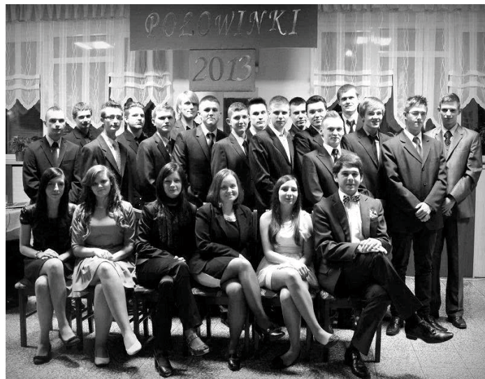
Połowinki, na zdjęciu klasa 3 I