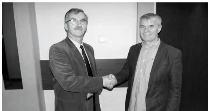
Symboliczne przekazanie władzy nowemu Prezesowi TKKF