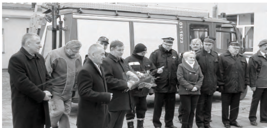
Przekazanie samochodu dla ZSE-T w Rakowicach Wielkich