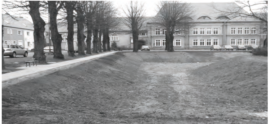
Nowy zbiornik retencyjny na Placu Wolności

Nękające od dłuższego czasu mieszkańców Zbąszynka, a w szczególności mieszkańców Placu Wolności i ulicy Kasprowicza, problemy z podtapianiem budynków po intensywnych i obfitych opadach deszczu spowodowały, że podjęto decyzję o rozwiązaniu tego problemu w sposób jednoznaczny i zdecydowany. Czarę goryczy w tym względzie, przelało zatopienie w sierpniu pomieszczeń piwnicznych zbąszyńskiego gimnazjum. Poniesione straty oraz ich usuwanie są odczuwalne do dziś. Pierwszym etapem tak zwanego programu naprawczego było wyczyszczenie kolektorów deszczowych, przebiegających przez teren PKP. Duży samochód techniczny (tzw. WUKO) wraz z grupą pracowników SZUK przez kilka dni udrażniał od lat niekonserwowane kolektory. Następnym etapem było wykona-