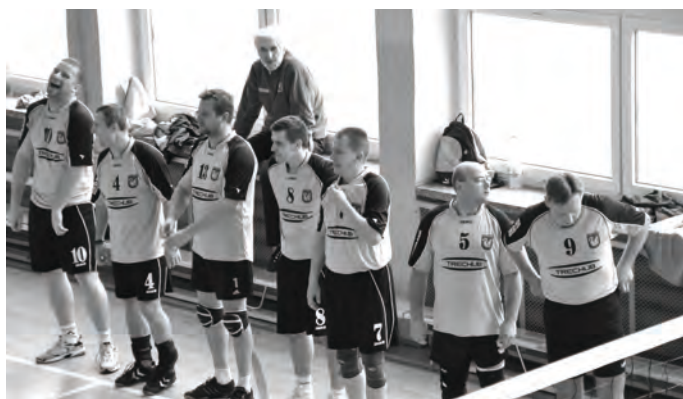
XX Turniej Piłki Siatkowej o Puchar Burmistrza Zbąszynka - Trechub Zbąszynek najlepszym zespołem jubileuszowego turnieju