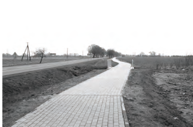
Ścieżka rowerowa w stronę Dąbrówki Wlkp.

jeśli pozwolą na to warunki atmosferyczne. Inwestycja jest współfinansowana ze środków pochodzących z Programu Rozwoju Obszarów Wiejskich na lata 2007-2013. Wartość robót 513,4 tys. zł.