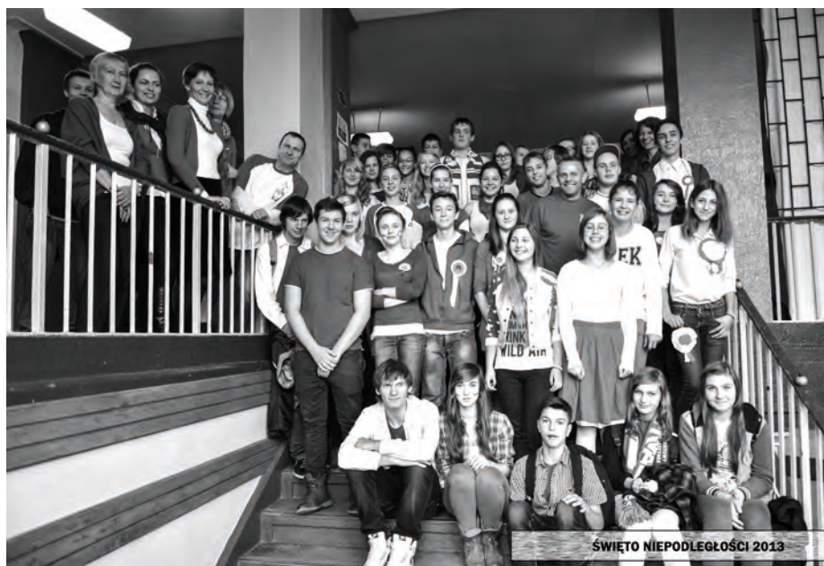
Uczniowie i nauczyciele wspólnie świętują Dzień Niepodległości

06-07.12.2013r. - akcja charytatywnej „Tak, pomagam” pod patronatem PZC Caritas w Zbąszynku z udziałem wolontariuszy I Gimnazjum - zbiórka żywności w wyznaczonych sklepach