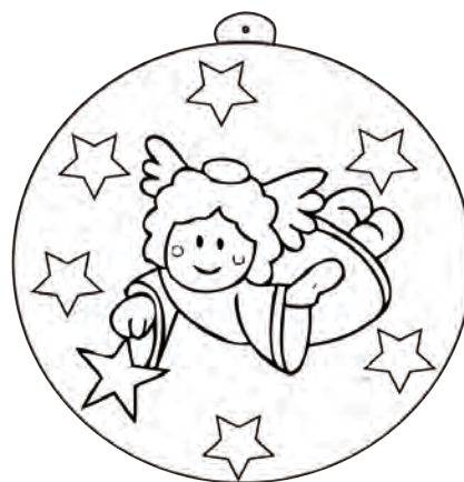
Zabawa dla najmłodszych - kolorowanka