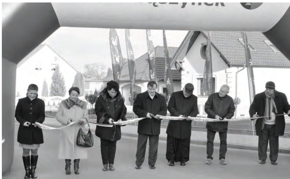
Uroczyste przecięcie wstęgi

Wykonawcą robót było konsorcjum firm: PPHU „Pacholak” z Bobowicka oraz PRD „Drogbud” ze Świebodzina. Nadzór nad prawidłową realizacją inwestycji sprawowała firma PUI Nadzory Sp. z o.o. z Zielonej Góry.