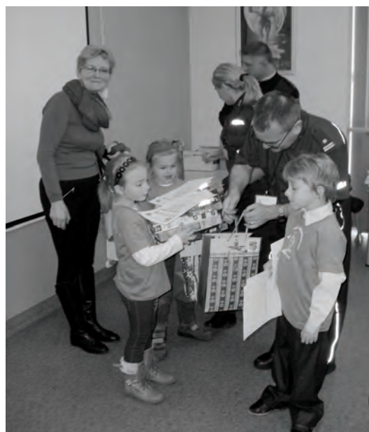
Wręczenie nagród zwycięzcom turnieju