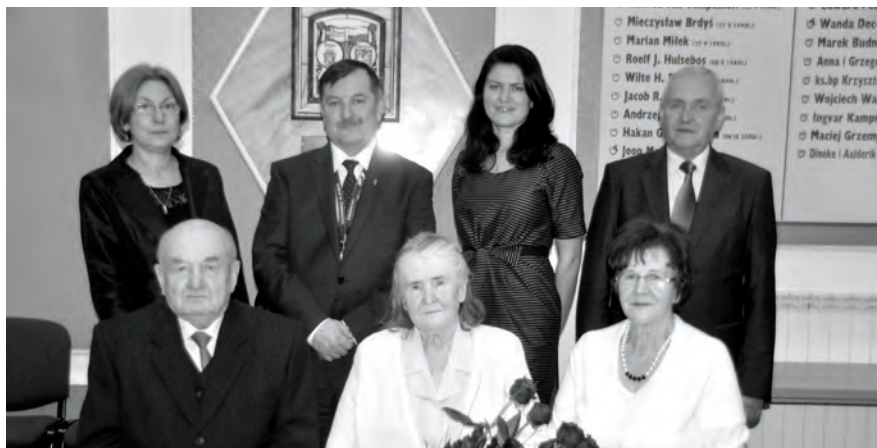
Pamiątkowe zdjęcie z Dostojnymi Jubilatami

na ręce Jubilatów życzenia zdrowia, pogody ducha i doczekania kolejnych jubileuszy oraz bukiet kwiatów i dyplom pamiątkowy.