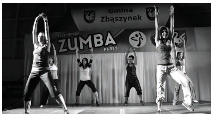
II Zbąszyńska Zumba Party - takie rzeczy tylko w Zbąszynku, ponad 160 uczestniczek we wspaniałej zabawie