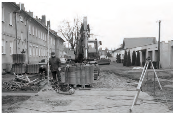
Prace przy utwardzaniu nawierzchni dróg wewnętrznych

obszaru posesji. Stary na ulicę Wojska Polskiego zastąpi nowy wyjazd na ulicę Poznańską. Rozwiązanie to spowoduje również poprawę bezpieczeństwa uczestników ruchu drogowego.