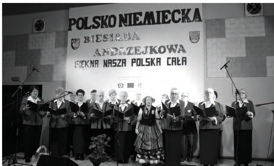
Zespół śpiewaczy Harmonia co roku pełni rolę gospodarza biesiady

cie wzięli udział mieszkańcy gminy Zbąszynek oraz artyści wraz z delegacją z Drewitz (Niemcy). Głównym celem projektu była promocja tradycji andrzejkowych miast partnerskich wraz z prezentacją strojów i piosenek z wybranych regionów. Uczestnicy projektu przygotowali piosenki, strój ludowy i anegdotę z danego regionu Polski i Niemiec. Komisja oceniająca nagradzała najlepsze wykonania. Podczas biesiady zaprezentowały się artystycznie zespoły śpiewacze: Harmonia ze Zbąszynka, Obrzanie