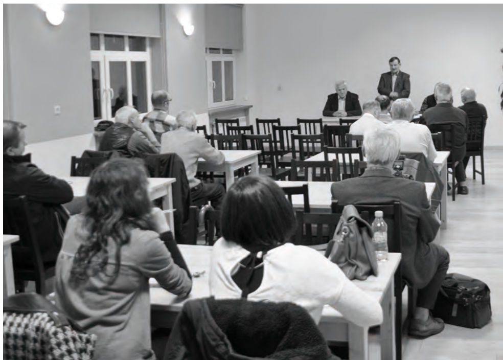
Mieszkańcy na spotkaniu z Burmistrzem

W dalszej części spotkania głos zabrali mieszkańcy Gminy, którzy zgłosili uwagi dotyczące: