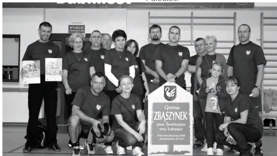
Reprezentacja Gminy Zbąszynek

miejscu uplasował się Zbąszyń, po nim Babimost, następnie Zbąszynek i Siedlec.