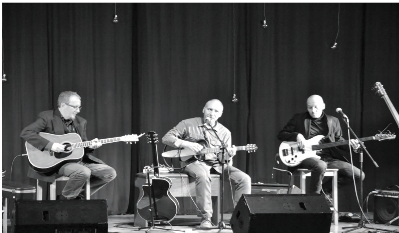
Koncert Elektrycznych Gitar

„Pokonywać granice poprzez wspólne inwestowanie w przyszłość” / „Grenzen überwinden durch gemeinsame Investition in die Zukunft”