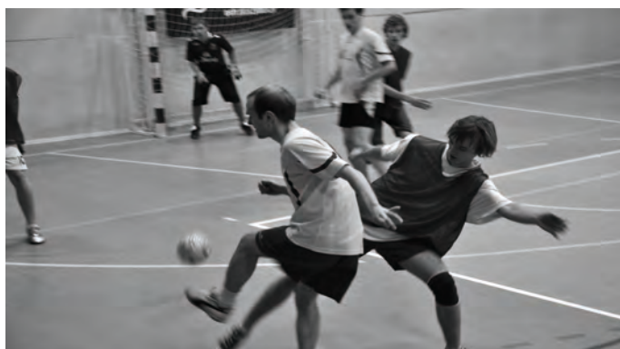
II Szkolna Halowa Liga Piłki Nożnej o Puchar Burmistrza Zbąszynka - 9 drużyn (76 zawodników) z naszych szkół rozpoczęło kolejny sezon halowej piłki nożnej