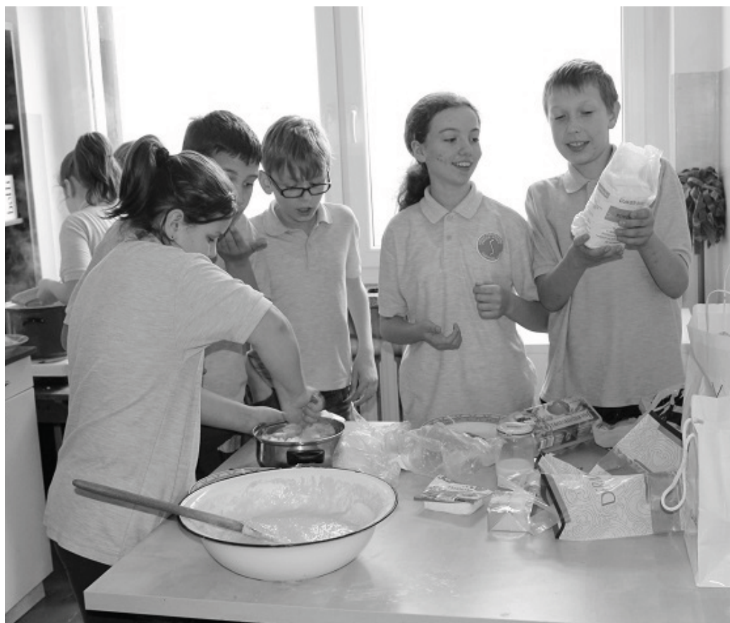
Uczniowie klasy V przygotowują dąbrowieckie potrawy

jąca się językiem niemieckim i angielskim. Jej dziadkowie pochodzą z Polski, dlatego pragnie nauczyć się języka polskiego i poznać polską kulturę, tradycje i zwyczaje. W zamian za to pomaga w lekcjach