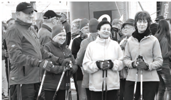
IV Marsz po Niepodległość Nordic Walking - Sportowy Zbąszynek maszerował ulicami Zbąszynka z rekordową liczbą ponad 100 uczestników