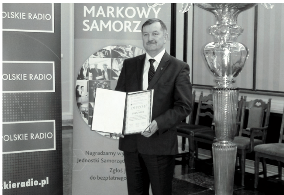
Burmistrz Zbąszynka prezentuje otrzymane wyróżnienie

2012 roku, z zachowaniem podziału na 4 grupy: gminy wiejskie, miejskie, miejsko-wiejskie oraz miasta na prawach powiatu. Głównym celem rankingu było nagrodzenie najlepiej rozwijających się jednostek samorządu terytorialnego, spośród wszystkich w Polsce.