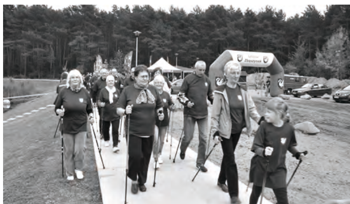
Gminny Marsz Seniora - 30 uczestników maszerowało w Gminnym Marszu Seniora wokół Jeziora Kozłarskiego

2013 rok był bardzo bogaty w wydarzenia sportowe: sukcesy naszych drużyn piłkarskich i szkolnych, nowe inwestycje sportowe i wiele ciekawych przedsięwzięć sportowych. Tradycyjnie już w fotograficznym skrócie mówimy o ostatnim kwartale 2013 roku oraz przedstawiamy zapowiedź najbliższych imprez sportowych w 2014 roku. Obszerne relacje video i zdjęcia znaleźć można na naszej stronie internetowej www.osir.zbaszynek.pl .