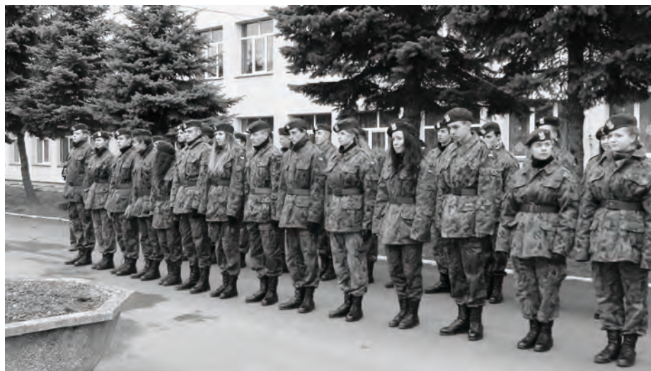
Uczniowie Szkoły podczas musztry

wyższy poziom kształcenia uczniów klasy pożarniczej w Rakoniewicach Wielkich.