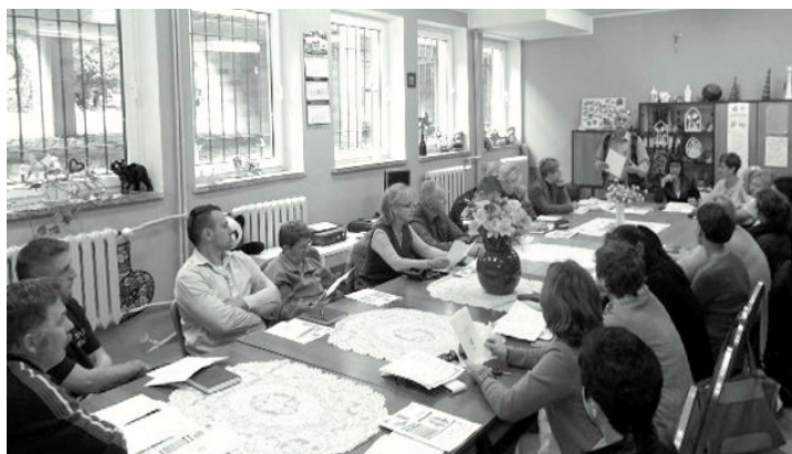
Praca Zespołu nad strategią

szych kwestii życia społecznego. Realizacją Strategii będzie zarządzał Zespół Zarządzający powołany przez Burmistrza Zbąszynka. Pracami Zespołu Zarządzającego kierować będzie Koordynator przy ścisłej współpracy Kierownika OPS. Projekt strategii znajduje się na stronie www.zbaszynek.pl w zakładce Nowa strategia społeczna.