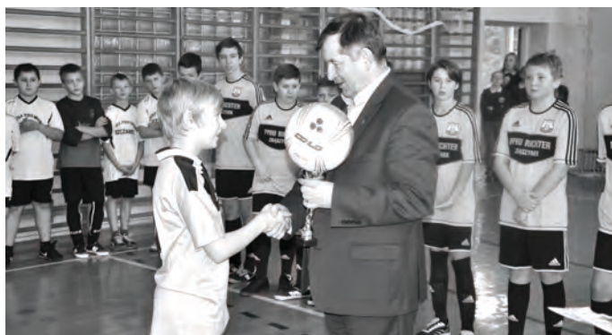
Powiatowe Mikołajkowe Turnieje Piłki Nożnej Szkół Podstawowych - SP Zbąszynek zwyciężył w turniejach rozegranych w Kosieczynie i Dąbrowce Wlkp.