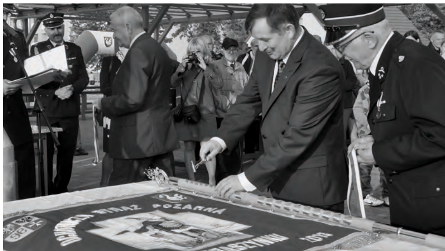
Nowy sztandar OSP Zbąszynek

gości. W uroczystości wzięli także udział strażacy z zaprzyjaźnionych gmin Łukowica, Lubrza, Peitz (Niemcy) oraz delegacje z naszych gminnych jednostek OSP: Dąbrówka Wlkp., Kosieczyn, Kręcko, Rogoziniec.