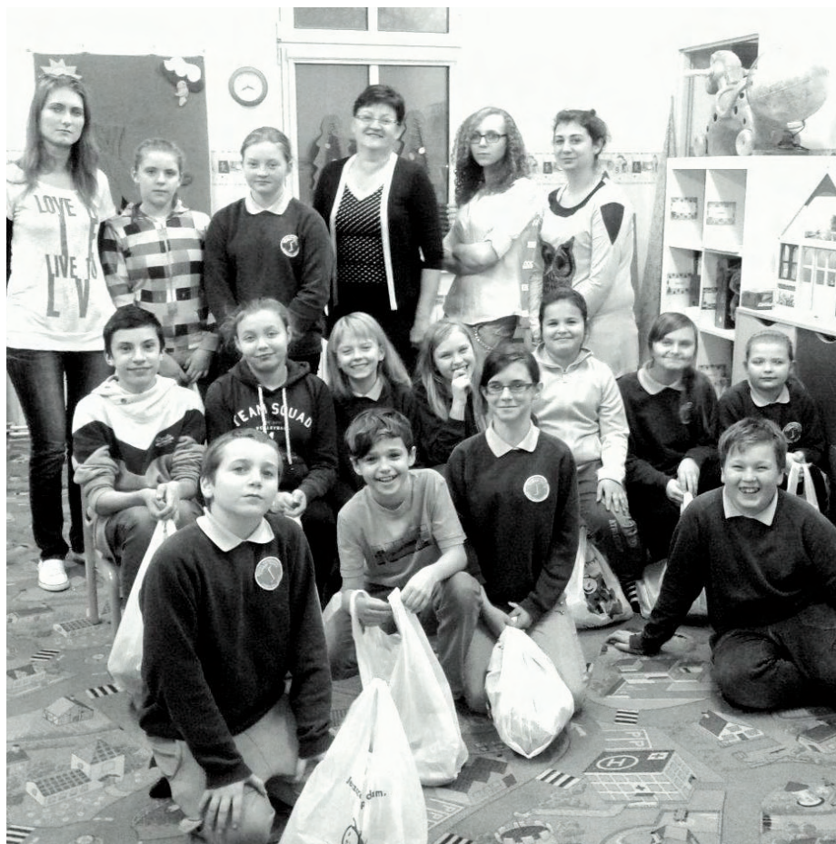
Prezenty od Mikołaja zawsze cieszą

Z okazji zbliżających się Świąt Bożego Narodzenia jak co roku organizacje i instytucje z terenu naszej Gminy, ze środków finansowych przeznaczonych w budżecie Gminy Zbąszynek na realizację programów profilaktycznych: Gminnego Programu Profilaktyki i Rozwiązywania Problemów Alkoholowych i Gminnego Programu Przeciwdziałania Narkomanii otrzymały dofinansowanie na zorganizowanie przedświątecznych spotkań dla dzieci. W tym roku o wsparcie finansowe wystąpili i otrzymali je: Rada Sołecka w Rogozińcu - 280,00 zł dla dzieci z Rogozińca, które nie chodzą do przedszkola lub świetlicy, Świebodziński Związek Kresowian Organizacja Pożytku Publicznego Koto Kosieczyn - 800,00 zł na realizację zadania „Z Kresowym Mikołajem” dla dzieci: Kresowian, dzieci z Kosieczyna i dzieci członkiń KGW, Ośrodek Pomocy Społecznej w Zbąszynku - 800,00 zł na realizację zadania wspólnie ze Zbąszyneckim Ośrodkiem Kultury - III Spotkania ze św. Mikołajem” pt. „Wszystkie dzieci nasze są” w ramach kampanii na rzecz osób niepełnosprawnych, Sołtys Wsi Chłastawa - 1 500,00 zł na realizację zadania „Chłastawa dla dzieci” i dzieci ze świetlic w Rogozińcu i Zbąszynku - 800,00 zł na paczki świąteczne. Wszyscy uczestnicy spotkań miło spędzili czas, a najważniejszym gościem był oczywiście Święty Mikołaj.