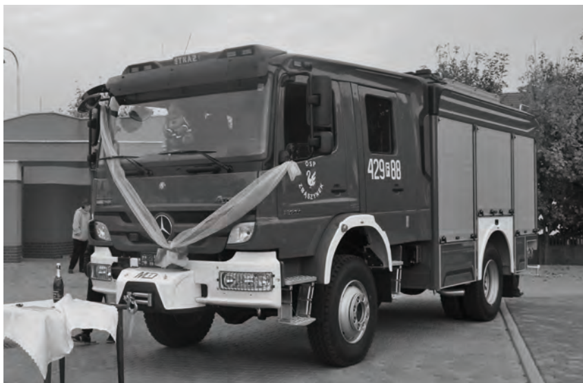
Nowy samochód dla OSP Zbąszynek