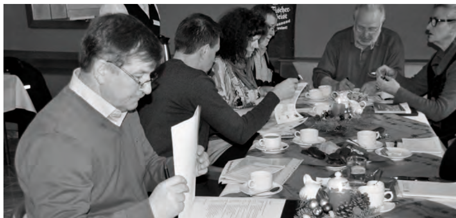
Spotkanie Grupy Roboczej

Kolejnym punktem programu było spotkanie grup roboczych wszystkich miast partnerskich, podczas którego nakreślono kierunki współpracy na 2014 rok oraz dokonano podsumowania wspólnych działań w roku bieżącym.