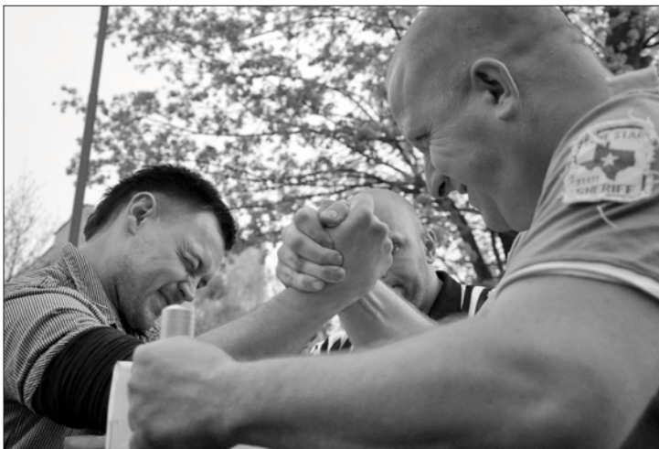
Mistrzostwa Zbąszynka w siłowaniu na rękę