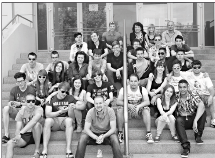
Młodzież z wymiany

- 10-cio dniowy obóz żeglarsko - językowy w sierpniu 2014 roku.