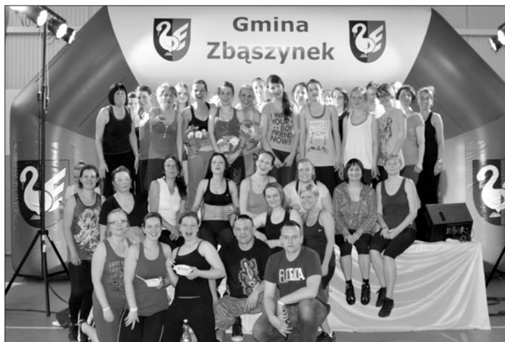
I Zbąszyńska Zumba Party