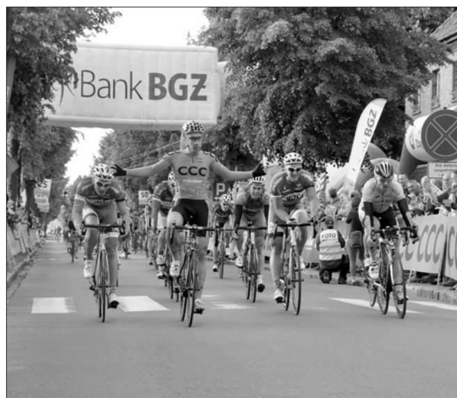
Bałtyk - Karkonosze Tour