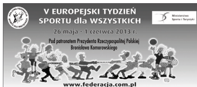
Europejski Tydzień Sportu - po raz pierwszy w Zbąszynku