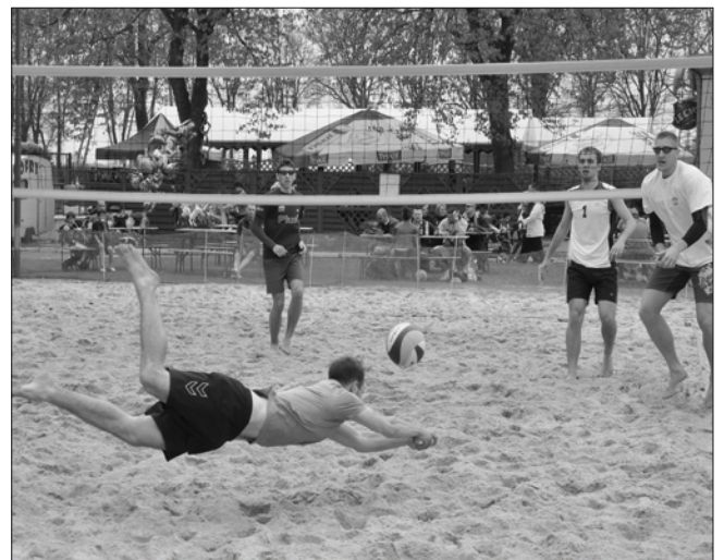
Turniej Siatkówki Plażowej - Wróbel Cup