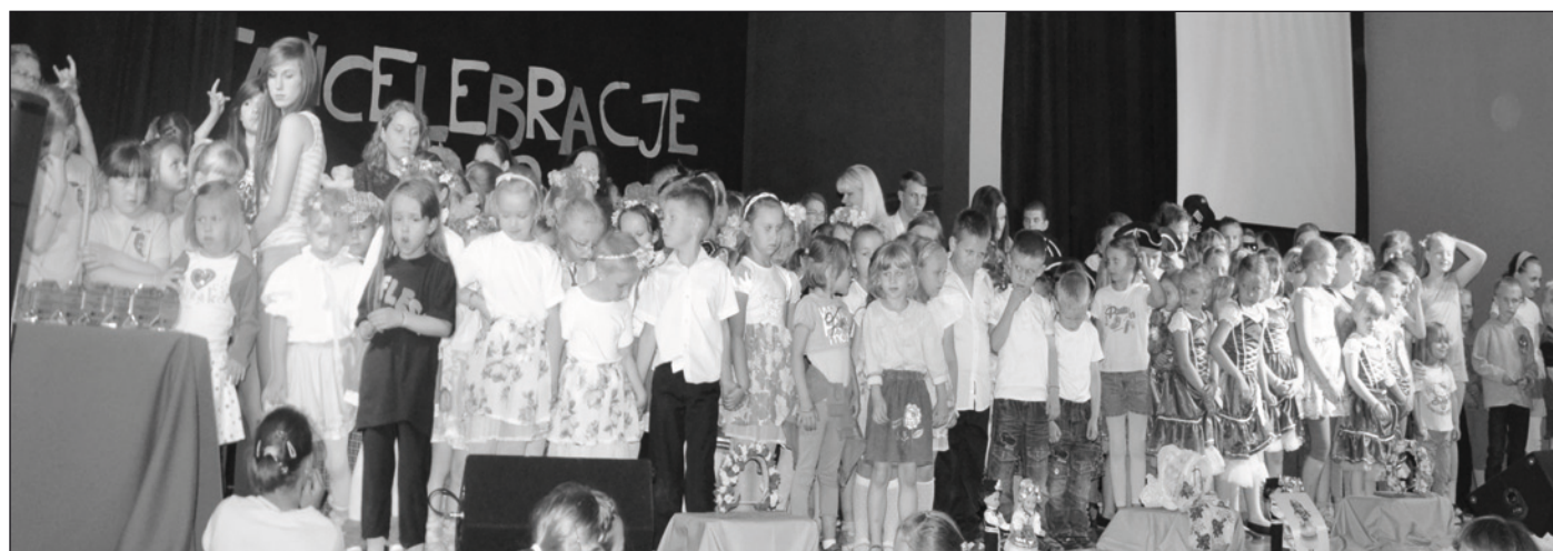
Uczestnicy tegorocznych Tańcelebracji

Tradycyjnie w ostatnim dniu szkoły, w parku za Domem Kultury odbył się koncert dla młodzieży. W tym roku swój muzyczny talent zaprezentował zespół In Rock, działający przy Zbąszyńskim Ośrodku Kultury. Tegoroczną gwiazdką wieczoru był zespół Materia. Przypomnijmy, że chłopaki dzięki swej charyzmie znaleźli się w wielkim finale tegorocznej edycji programu Must Be The Music. Młodzież bawiła się rewelacyjnie.