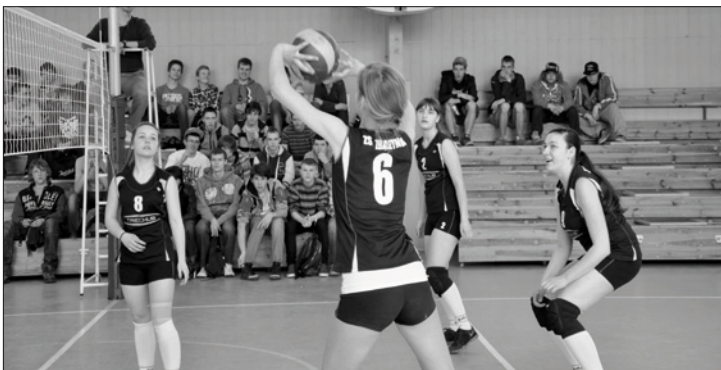
Turniej Siatkówki Kobiet o Puchar TV Sport Info