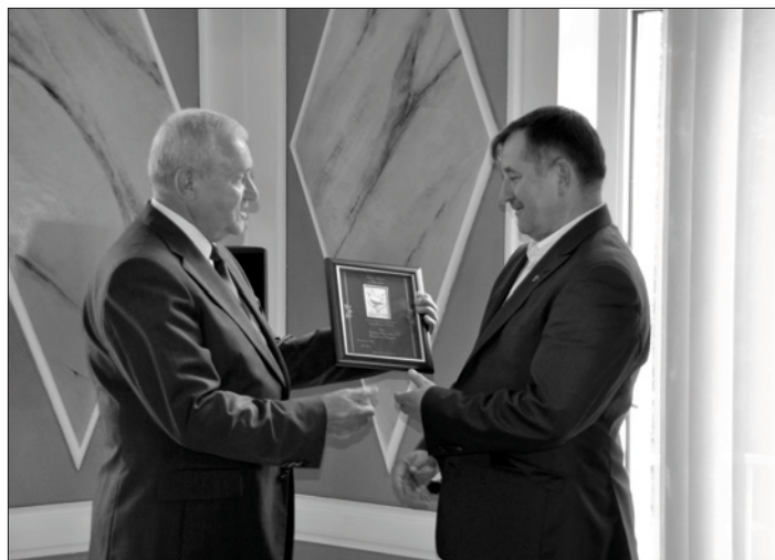
Burmistrz Zbąszynka odbiera gratulacje od Przewodniczącego Rady Miejskiej

Rada Miejska udzielając absolutorium Burmistrzowi Zbąszynka zaakcep-