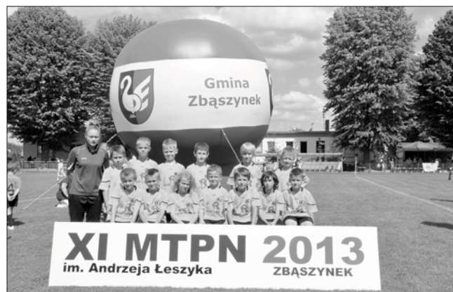
XI MTPN - I miejsce Koziołek Poznań