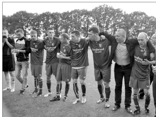
Historyczny awans Syreny do IV ligi