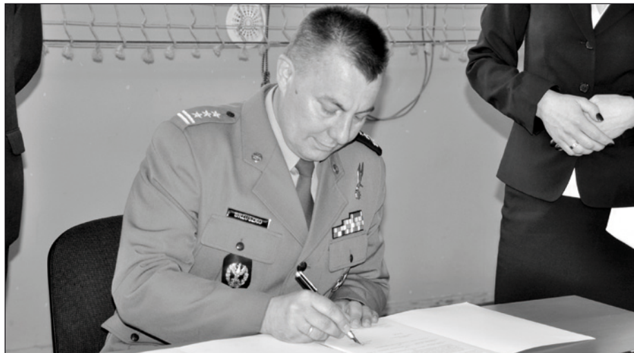
Moment podpisania umowy o współpracy

Uroczystościom zakończenia roku szkolnego w szkołach Gminy Zbąszynek towarzyszyły apele, krótkie występy artystyczne oraz wręczenie nagród. Jest to czas na wielkie podziękowania dla wszystkich nauczycieli, pracowników szkoły, rodziców, a przede wszystkim dla Was Drodzy Uczniowie za kolejny rok ciężkiej, wytrwałej pracy. Waszym zaangażowaniem i postawą wskazywaliście na sens podejmowanych działań, a otrzymane świadectwa i nagrody są tego dowodem.