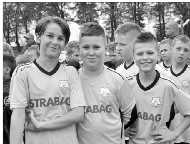
Lubuski Finał Wielgusa