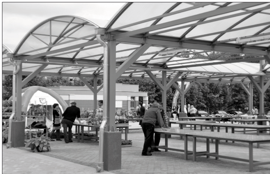
Targowisko miejskie już otwarte