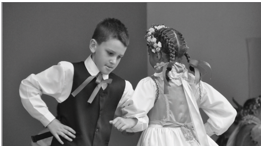
Tradycja przechodzi z ojca na syna

wił się Zespół Pieśni i Tańca Łany, działający przy Uniwersytecie Przyrodniczym w Poznaniu. Ponadto publiczność rozbawiły swoimi pogadankami Dąbrowieckie Klakoty. Imprezę uświetnił zorganizowany na tę okoliczność pokaz sztucznych ogni, a do godzin porannych bawiono się na zabawie tanecznej, której przygrywał zespół Trio z Dąbrowki Wlkp.