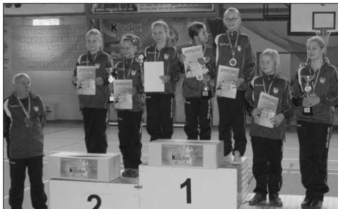
Siatkarki z Kosieczyna

oglądali zmiany zachodzące w przyrodzie, Muzeum Rybołówstwa oraz Hutę Stali w Peitz. Kolejną atrakcją był pokaz tresury psów policyjnych, olimpiada rozrywkowa, dyskoteka. Ważnym punktem programu mającym na celu integrację trzech szkół był wieczór artystyczny, podczas którego uczniowie prezentowali swoje umiejętności wokalne, muzyczne, taneczne oraz językowe. Uczniowie poznali również nowe gry i zabawy,