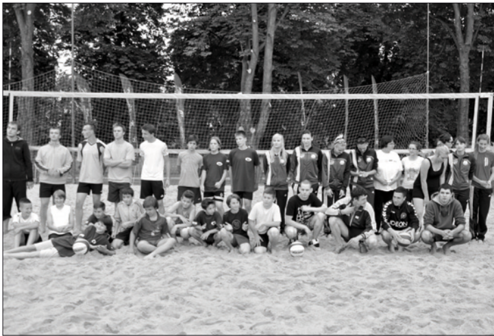
Mistrzostwa Zbąszynka w Siatkówce Plażowej