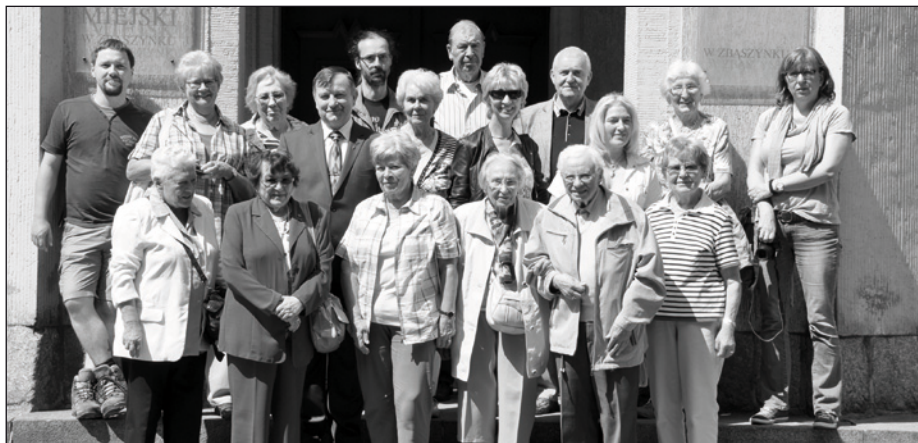
Pamiątkowe zdjęcie z wizyty byłych mieszkańców

wręcz przeciwnie, stają się źródłem budowania nowej przyszłości.