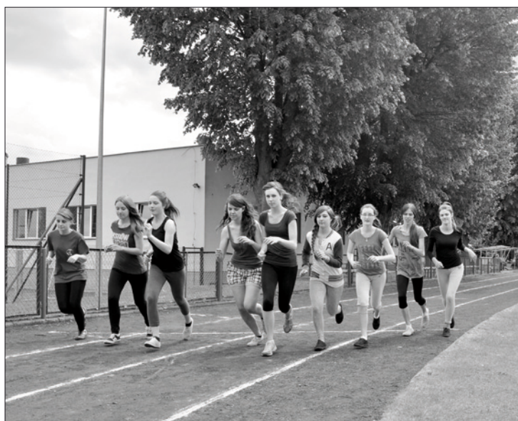
Memoriał LA im. Bogdana Niemca