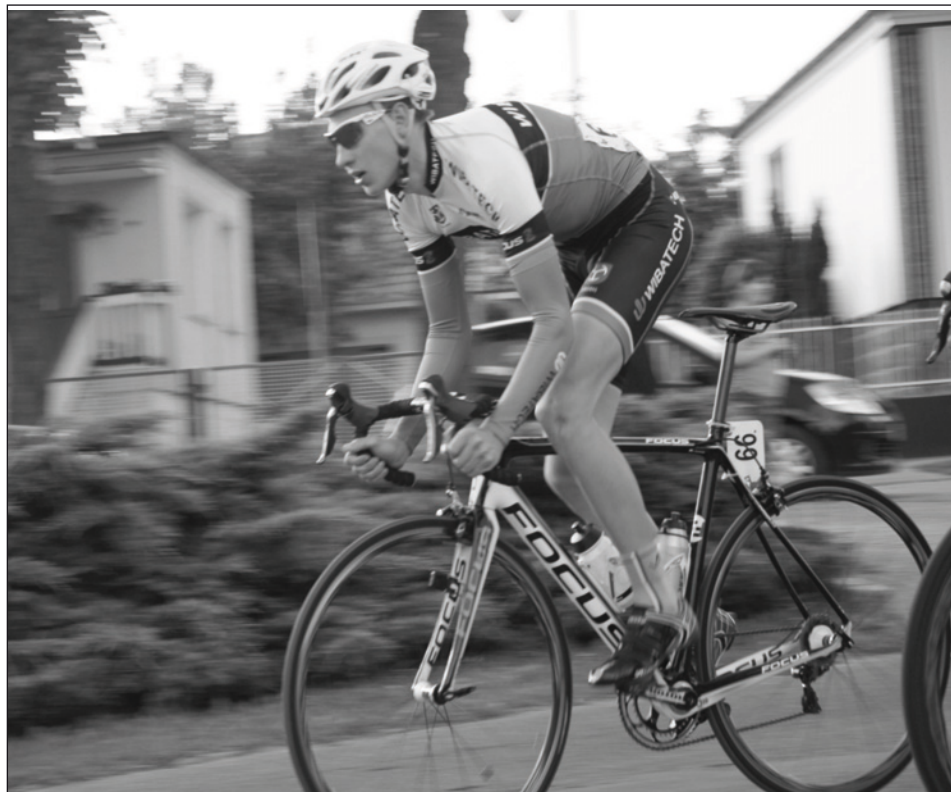
Bałtyk - Karkonosze Tour w Zbąszynku

Imprezę uświetniły występy przedszkolaków oraz uczniów szkół podstawowych.