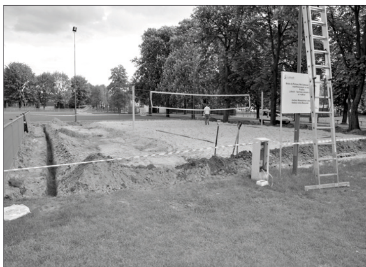
Budowa boiska do siatkówki plażowej w ramach Lubusika