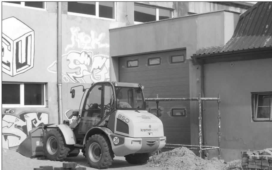
Plac budowy przy remizie OSP

W Zbąszynku przy ul. Bydgoskiej, pomiędzy budynkiem remizy OSP, a budynkiem gimnazjum (dawne warsztaty szkolne) trwa budowa garażu dla samochodu strażackiego. W ramach budowy wykonano już stan surowy obiektu. Zamontowano też segmentową bramę garażową, wykonano tynki, instalację elektryczną i c.o. Wjazd do garażu będzie od strony ulicy Bydgoskiej. Plac przed remizą zostanie przebudowany celem odprowadzenia wód opadowych i wykonania wjazdu. Od strony południowej teren placu gimnazjalnego zostanie oddzielony ogrodzeniem wykonanym z przęseł metalowych na kamiennym cokole. Zakończenie robót i oddanie obiektu do użytku jest planowane w sierpniu br.