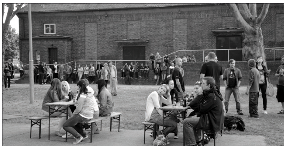
W oczekiwaniu na koncert zespołu Materia

otrzymali pamiątkowe statuetki i opaski na rękę. Łącznie wystąpiło blisko 460 tancerzy. Impreza zorganizowana została w ramach programu: „Europejski Fundusz Rolny na rzecz Rozwoju Obszarów Wiejskich: Europa inwestująca w obszary wiejskie”. Operacja mająca na celu organizację imprezy kulturalnej, mającej na celu promocję lokalnych walorów współfinansowana jest ze środków Unii Europejskiej w ramach działania „Wdrażanie lokalnych strategii rozwoju” - mały projekt Program