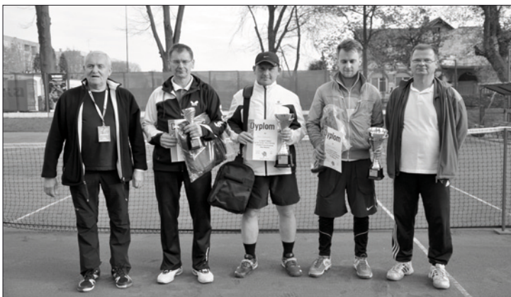
Turniej Tenisa Ziemnego o Puchar Przewodniczącego Rady Miejskiej