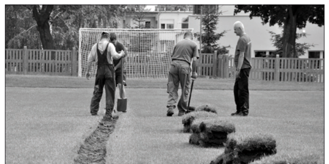
Lubuskie Gra w Piłkę - modernizujemy boisko treningowe