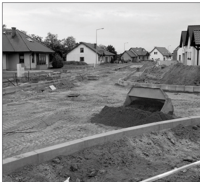
Skrzyżowanie ulic Kościelna i Prymasa Wyszyńskiego