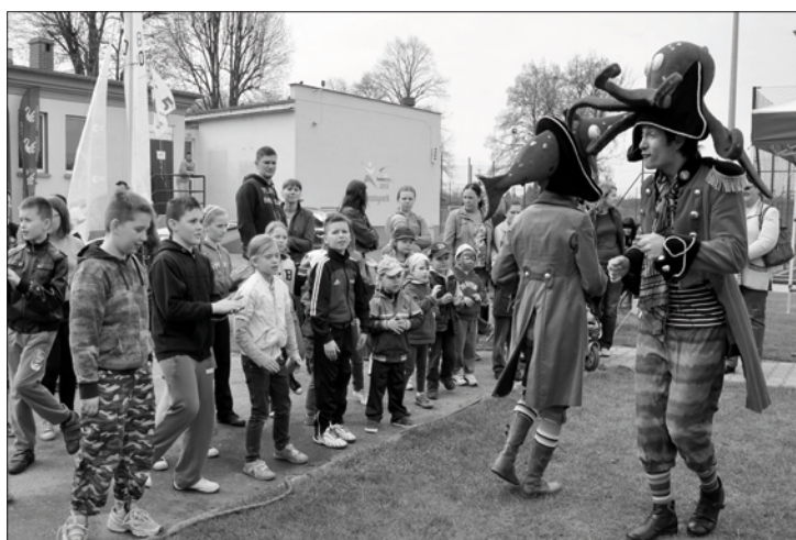
Animatorzy dla dzieci

Witam Państwa w kolejnej sportowej odstonie Zbąszyneckiego Kwartalnika. Zgodnie z nową formułą w graficznym skrócie o tym co za nami i szerzej o tym, co czeka nas w najbliższym czasie. Tradycyjnie więcej informacji na naszej stronie internetowej www.osir.zbaszynek.pl , do odwiedzania której serdecznie Państwa zapraszamy