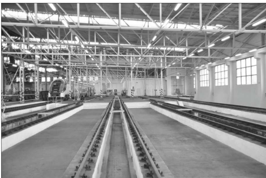
Wyremontowana część byłej lokomotywni

pojazdów szynowych, dlatego remont tego obiektu był konieczny.