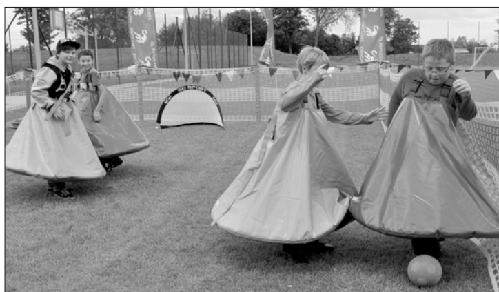
Gminny Dzień Dziecka - Sportowe Miasteczko