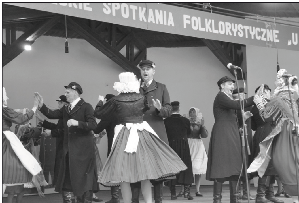
Jubilat na scenie