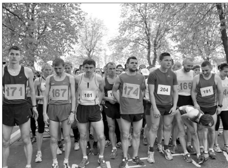
XXI Bieg Konstytucji