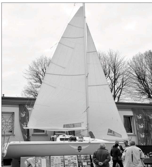
Pasje Naszych Mieszkańców - Żeglarsstwo Regatowe