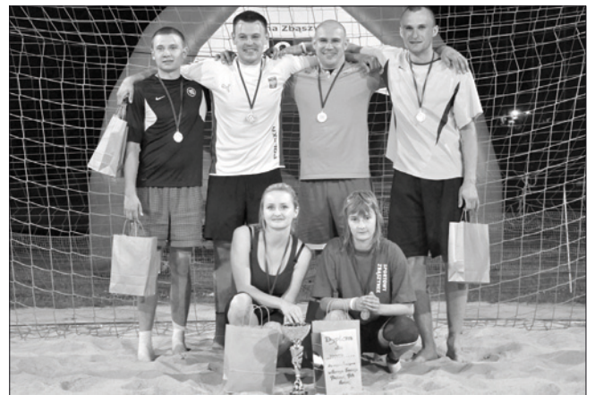
Nocny Turniej Plażowej Piłki Nożnej