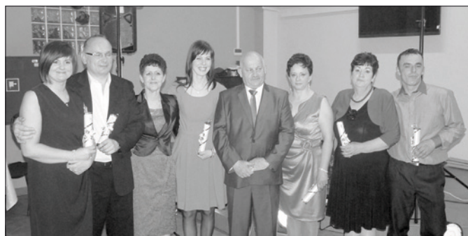
Obchody Jubileuszu 20-lecia

Kierownictwu oraz pracownikom Firmy życzymy kolejnych Jubileuszy.