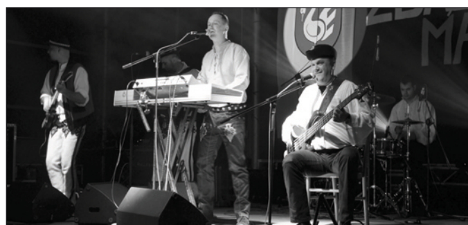
Zespół Baciary z Podhala

08.05.2013 - Tydzień bibliotek Dla przedszkolaków odbyły się lekcje biblioteczne pt. "Podróż lokomotywą Pana Tuwima". Podczas spotkań przeprowadzono konkursy