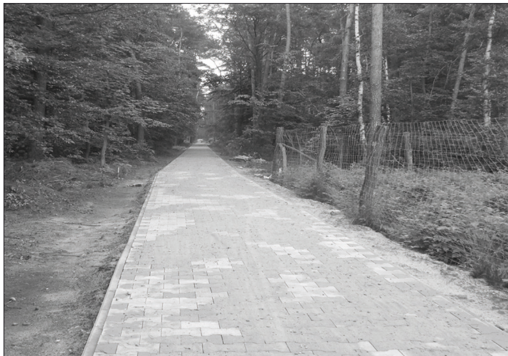
Nowa ścieżka rowerowa

Na ukończeniu są prace przy budowie ścieżki rowerowej od wsi Chłastawa w kierunku Zbąszynia, do granicy gminy. Budowana ścieżka jest dwukierunkowa o szer. 2 m i długości 1,4 km. Nawierzchnia z kostki brukowej typu 2 T. Ścieżka łączy się z odcinkiem wykonanym wcześniej przez Gminę Zbąszyń. Tuż przy niej w terenie leśnym powstaje wygradzone miejsce z ławkami i stołami. Wykonawcą jest firma Usługi Transportowe Łukasz Tyliczszak z Międzyrzecza. Wartość inwestycji wyniesie ok. 246 tyś. zł. Termin zakończenia inwestycji 12 lipca br.