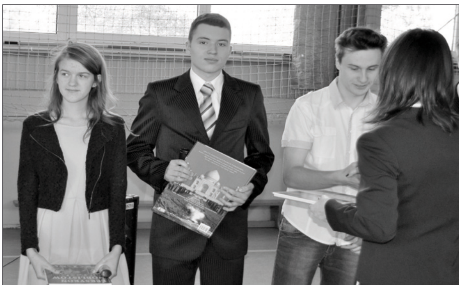
W ZST nagrodzono wielu uczniów

Życzymy udanych, pełnych pozytywnych wrażeń wakacji oraz szczęśliwego powrotu za dwa miesiące do szkolnych obowiązków.