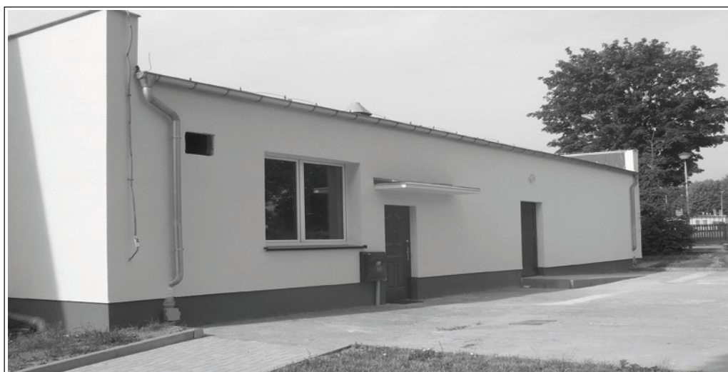
Odnowiona elewacja obiektu

uczęszczający. Będą się tam mogli bawić, odrabiać lekcje, wyjść na spacer. Wszystko to pod opieką osób odpowiedzialnych.