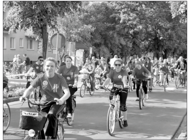
Rowerowa Runda Honorowa