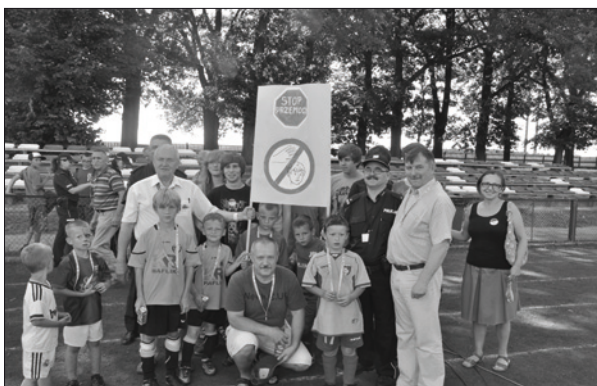
„PaT” na obiektach sportowych w Zbąszynku

Poza tym wspólnie z Koalicją na Rzecz Trzeźwości, w okresie wakacji, w ramach kampanii „Postaw na Rodzinę” będzie realizowany program