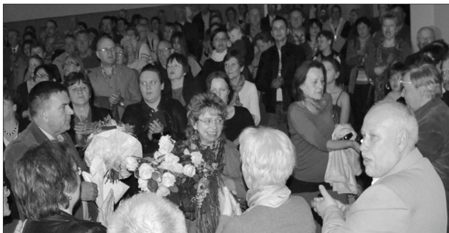
Podczas wręczania kwiatów były tży wzruszenia