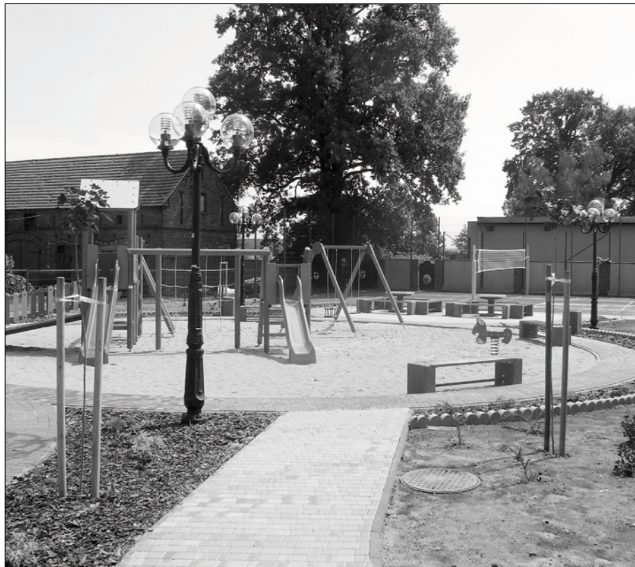
Plac zabaw w kompleksie sportowo - rekreacyjnym w Chłastawie

Z końcem maja br. zakończono w Chłastawie budowę kompleksu sportowo - rekreacyjnego. Obiekt będzie pełnił funkcję sportowo - rekreacyjną. Został wyposażony w boisko do siatkówki i badmintonu, plac zabaw dla dzieci, stoły do gier planszowych i ławki. Teren został ogrodzony i oświetlony. Wybudowano dwupoziomowy pomost i wyczyszczono staw. Wykonawcą robót był Zakład Melioracyjno-Budowlany MEL-BUD, Ryszard Tarnowski z Sulechowa. Inwestycja była realizowana przy udziale dofinansowana ze środków unijnych w ramach Programu Rozwoju Obszarów Wiejskich na lata 2007-2013. Całkowity koszt budowy to ok. 407 tys. zł. Dzięki wybudowaniu placu, obiekt stanie się również miejscem organizacji imprez kulturalnych, takich jak festyny, koncerty. Wpływie to na poprawę dostępności mieszkańców do miejsc wypoczynku oraz na wzrost integracji społeczności lokalnej mieszkańców Chłastawy.