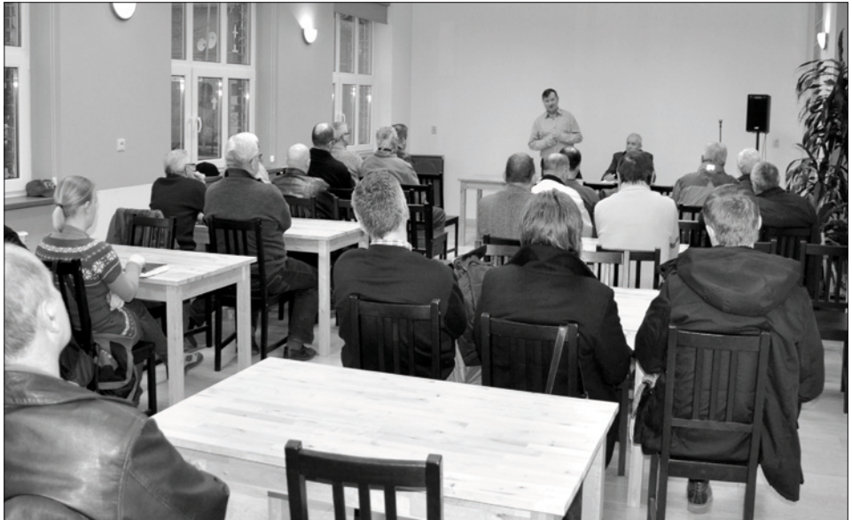
Spotkanie w Domu Kultury