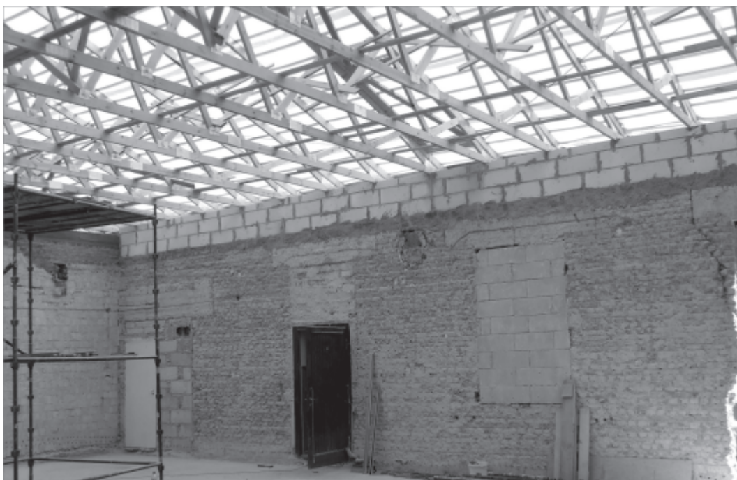
Sala wiejska w remoncie

dorosłych. Obecnie zakończono wszystkie prace rozbiórkowe. Wykonano konstrukcję i nowe pokrycie dachu, izolacje i podłoża pod posadzki. Wykonane roboty umożliwiają prowadzenie robót wewnątrz budynku.