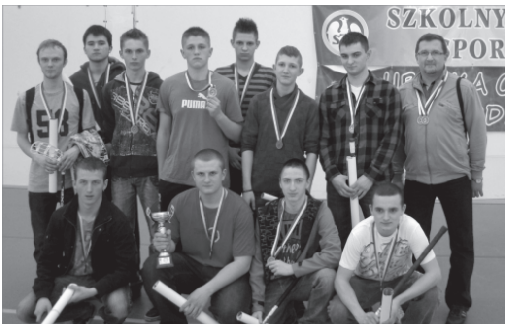
Brązowi medaliści w unihokeju

Od 18 do 20 czerwca absolwenci technikum oraz zasadniczej szkoły zawodowej przystąpili do egzaminu potwierdzającego kwalifikacje zawodowe. Pierwszego dnia wszyscy zdawali egzamin teoretyczny. Drugiego dnia swoją wiedzę i umiejętnościami praktycznymi musieli wykazać się informatycy oraz absolwenci technikum architektury krajobrazu. Egzamin praktyczny 20 czerwca zdawali natomiast elektrycy i elektronicy.