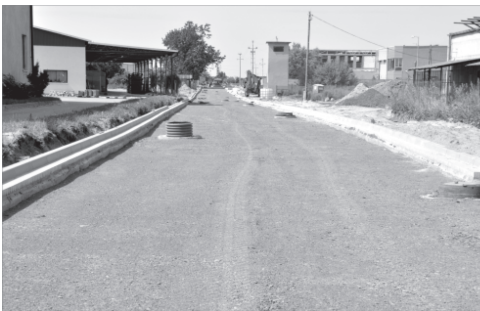
ul. Czarna Droga

Trwają prace przy rozbudowie ulicy Czarna Droga w Zbąszynku. Wykonano już większość robót ziemnych. Na ukończeniu jest ustawianie krawężników i budowa kanalizacji deszczowej. Zakończono również roboty związane z likwidacją kolizji z urządzeniami obcymi i przebudową oświetlenia. Obecnie wykonywane są prace przy dolnej warstwie podbudowy ulicy. Wykonywana jest stabilizacja gruntu cementem. Kolejną warstwą będzie podbudowa z tłucznią, którego pokaźna hałda jest zdeponowana na placu przy ul. PCK. Trafi on w przygotowane koryto drogi. Kolejnymi pracami będzie wykonanie następnych warstw konstrukcyjnych drogi aż do warstwy ścieralnej z masy asfaltowej. Zakończenie inwestycji planowane jest na koniec sierpnia br.