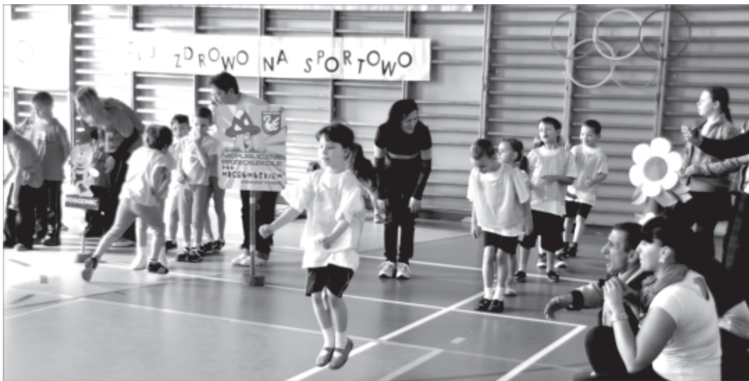
Sportowa rywalizacja przedszkolaków

Nad prawidłowym przebiegiem konkurencji czuwało jury w składzie: Burmistrz Zbąszynka Wiesław