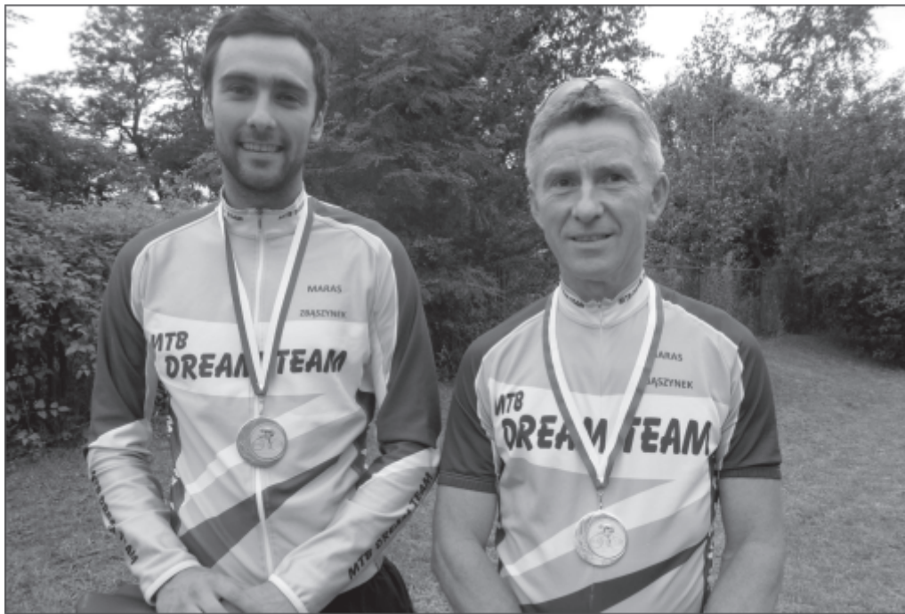
Liderzy MTB Drem Team

Wyścig odbędzie się 05 sierpnia 2012r. startem ze stadionu im. Bogdana Niemca, a trasa przebiegać będzie przez ciekawe, obfitujące w niespodzianki, dukty leśne i podjazdy w okolicach Dąbrówki Wielkopolskiej i Nowego Gościńca. Zapraszamy wszystkich chętnych mających rower i kask, którzy w niesamowitej atmosferze kolarskiej chcą przeżyć przygodę w profesjonalnie zorganizowanym wyścigu.