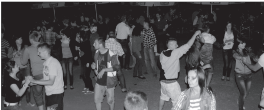
Zabawa trwała do późnych godzin nocnych

W sobotę, 26 maja br. w parku za Domem Kultury o godzinie 21.00 rozpoczęła się "Majówka - Potańcówka" dla mieszkańców gminy Zbąszynek. Oprawę muzyczną przygotował zespół Euro-Beat z Podmokli Małych ("Wołki" - potoczna nazwa zespołu). Gdy na dworze zapanował zmrok, betonowy parkiet pod sceną wypełniły pary taneczne. Podczas zabawy nie zabrakło takich utworów jak "Koko, Euro, spoko" czy "Ai Se Eu te Pego". Zabawa skończyła się po godzinie 2.00.