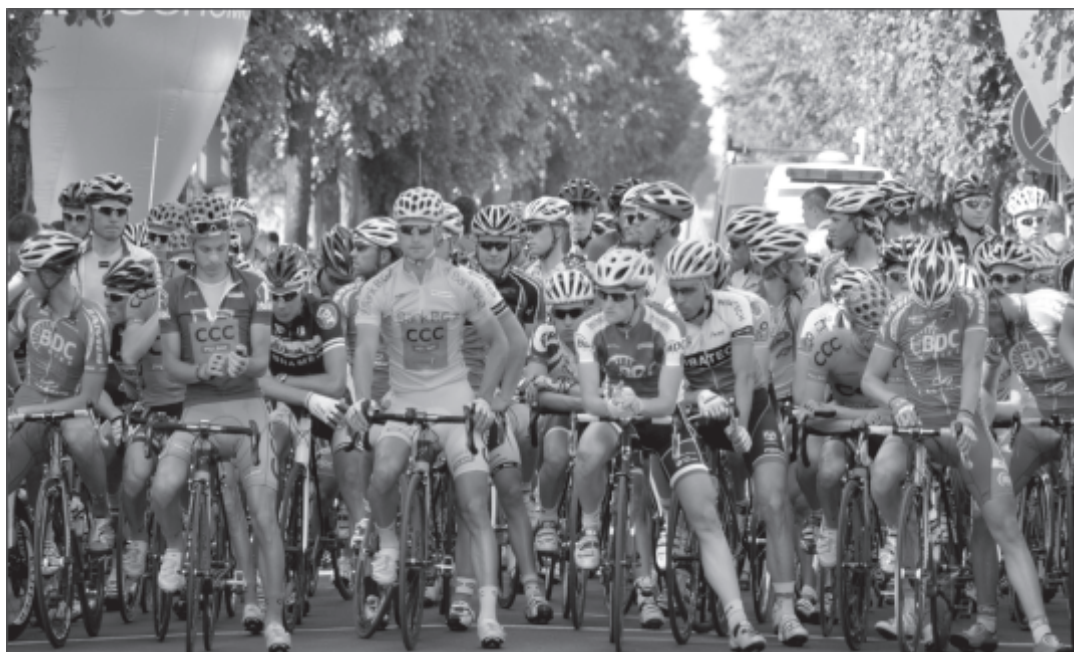
Start wyścigu Bałtyk - Karkonosze Tour