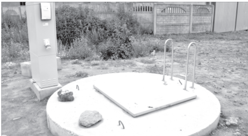
Przepompownia w Kręcku

przyłączenia do sieci. SZUK po określeniu warunków przyłączenia i ich spełnieniu przez Wnioskujących, będzie sukcesywnie podłączał poszczególne posesje. W dużym skrócie warunki, które będzie trzeba spełnić to: należy bezwzględnie odciąć dotychczasowe źródło zasilania w wodę – hydrofor. Za istniejącym zaworem zostanie zamontowana konsola wodomierzowa, następnie zawór antyskażeniowy i zawór odcinający. Koszt zakupu konsoli, zaworu antyskażeniowego i drugiego zaworu odcinającego, materiału do podłączenia kanalizacji a także robót przyłączeniowych i geodezyjnej inwentaryzacji ponosi właściciel posesji. Po wykonaniu przyłącza i odbiorze technicznym zostanie podpisana umowa na dostawę wody i odbiór ścieków. Wykonanie i budowa przyłącza jest realizowana na wniosek, za staraniem i na koszt wnioskującego i po wybudowaniu stanowi własność odbiorcy usług wodociągowo kanalizacyjnych z wyjątkiem wodomierza który jest własnością SZUK i jest montowany na jego koszt.