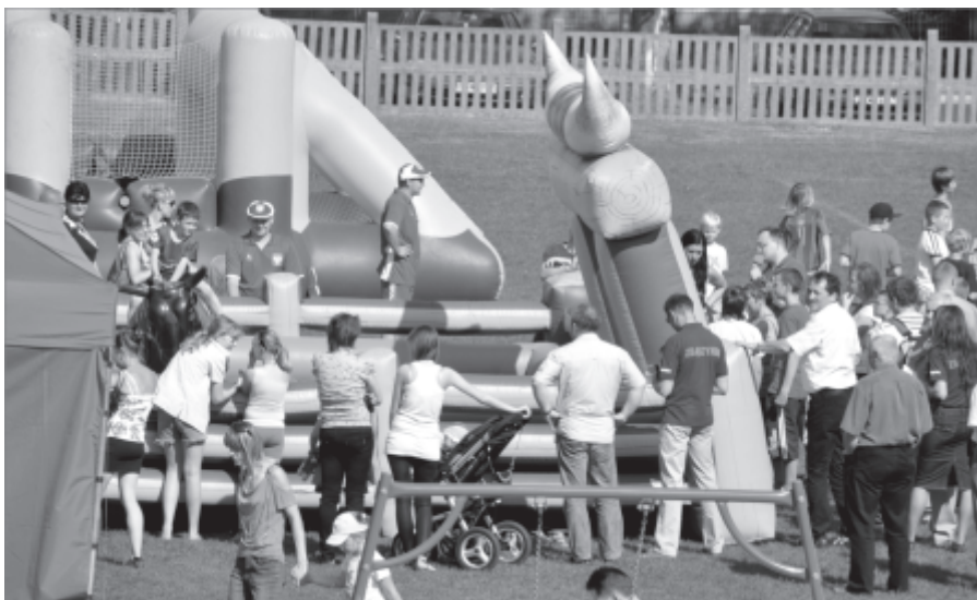
Majówkowy Mega Piknik

Na kolejną majówkę zapraszamy już za rok!