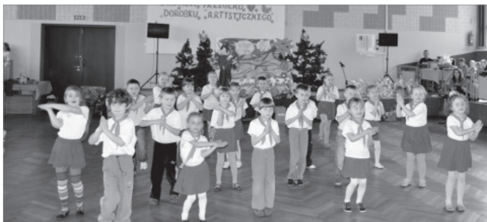
Występy artystyczne przedszkolaków

W czwartek, 26 kwietnia br. w Sali tanecznej Domu Kultury odbył się po raz pierwszy Dziecięcy Przegląd Dorobku Artystycznego. Organizatorem przeglądu było Niepubliczne Przedszkole „Pod Muchomorkiem” w Zbąszynku. Tematem przewodnim była przyroda. Celem zorganizowania przeglądu było rozwijanie zainteresowań u dzieci przyrodą, poprzez dziecięce gry i zabawy oraz integracja dzieci i nauczycieli z zaproszonych placówek przedszkolnych.