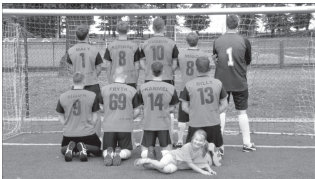
Zwycięzcy turnieju - Axxion