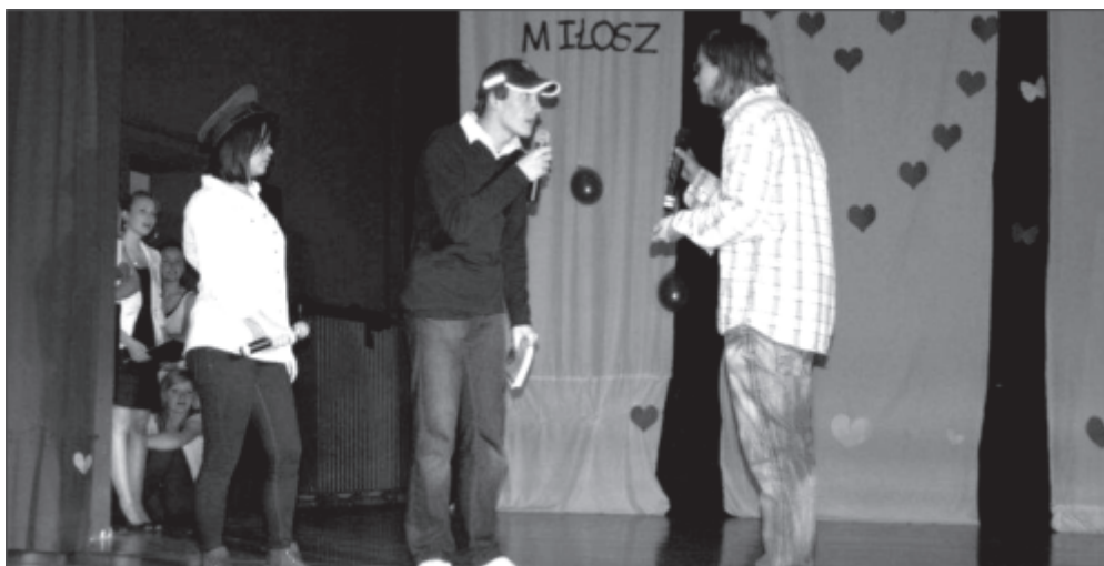
Scena kabaretowa podczas koncertu charytatywny

W sobotę 14 kwietnia odbyły się w I Gimnazjum V Targi Edukacyjne. Gimnazjaliści i ich rodzice mogli zapoznać się z ofertą edukacyjną, wzorami podań, obejrzeć prezentacje oraz przeprowadzić rozmowy z uczniami i nauczycielami 9 szkół ponadgimnazjalnych. Dodatkowo można było skorzystać z indywidualnych konsultacji z w zakresie doradztwa zawodowego.