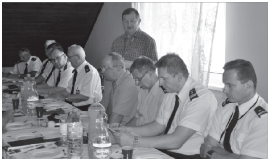
Przedstawiciele jednostek OSP i KPP

wykonywanych przez siebie obowiązków. Informację o zabezpieczeniu przeciwpożarowym zaprezentowali przedstawiciele Ochotniczych Straży Pożarnych z terenu Gminy Zbąszynek. Dotyczyły one składów osobowych jednostek, dostępnego sprzętu ratunkowego, uczestnictwa strażaków w różnego rodzaju kursach podnoszących ich kwalifikacje oraz działań związanych z włączeniem jednostki OSP Zbąszynek do Krajowego Systemu Ratowniczo-Gaśniczego, którego członkiem jest OSP Dąbrówka Wlkp.