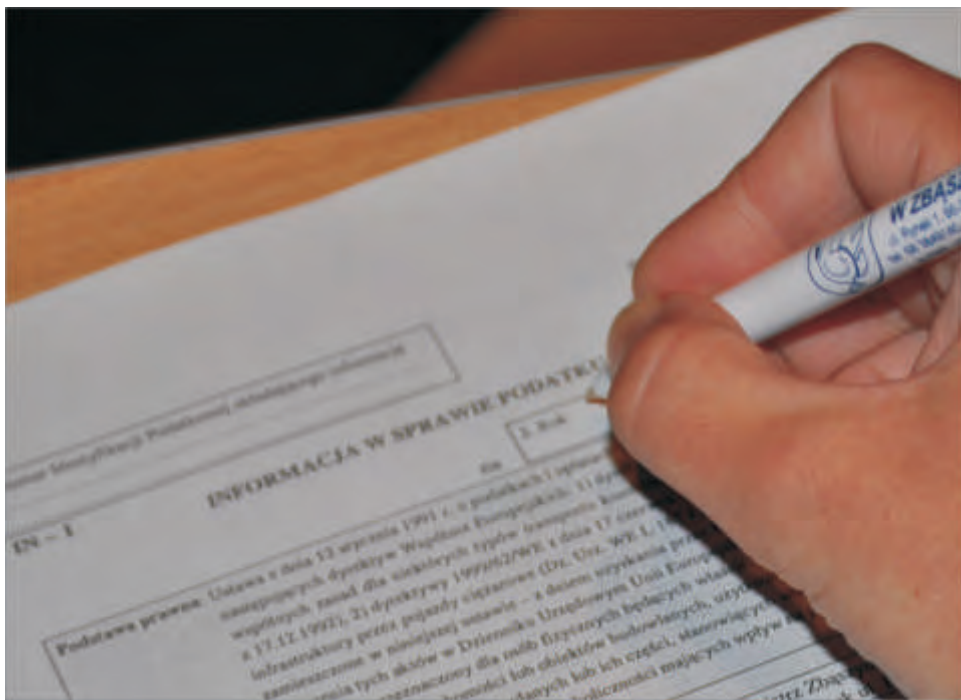
Druk informacji w sprawie podatku

Budynki to obiekty budowlane trwale związane z gruntem,