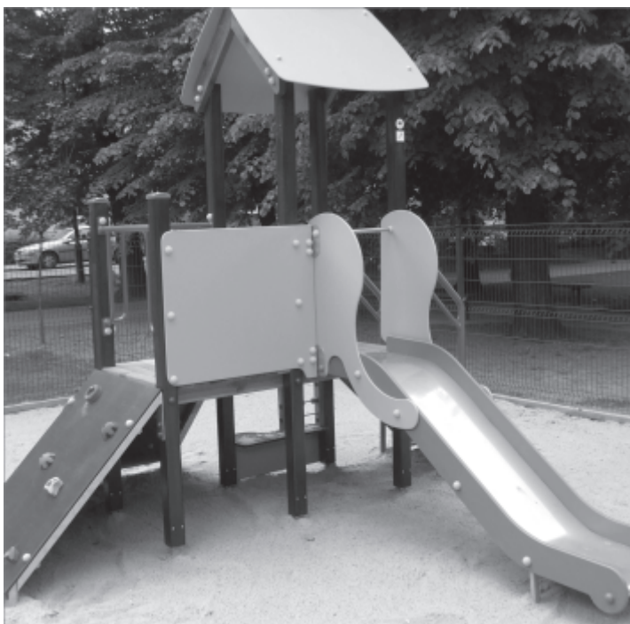
Zestaw zjeżdżalni ze ścianką wspinaczkową