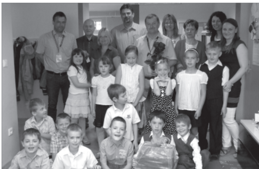
Uroczyste otwarcie świetlicy w SP Zbąszynek

Uczniowie wystąpili z krótkim programem artystycznym, a każdy z gości otrzymał bukiet kwiatów. Bardzo miłą niespodzianką były prezenty przyniesione przez gości, które będą służyły wszystkim korzystającym ze świetlicy.