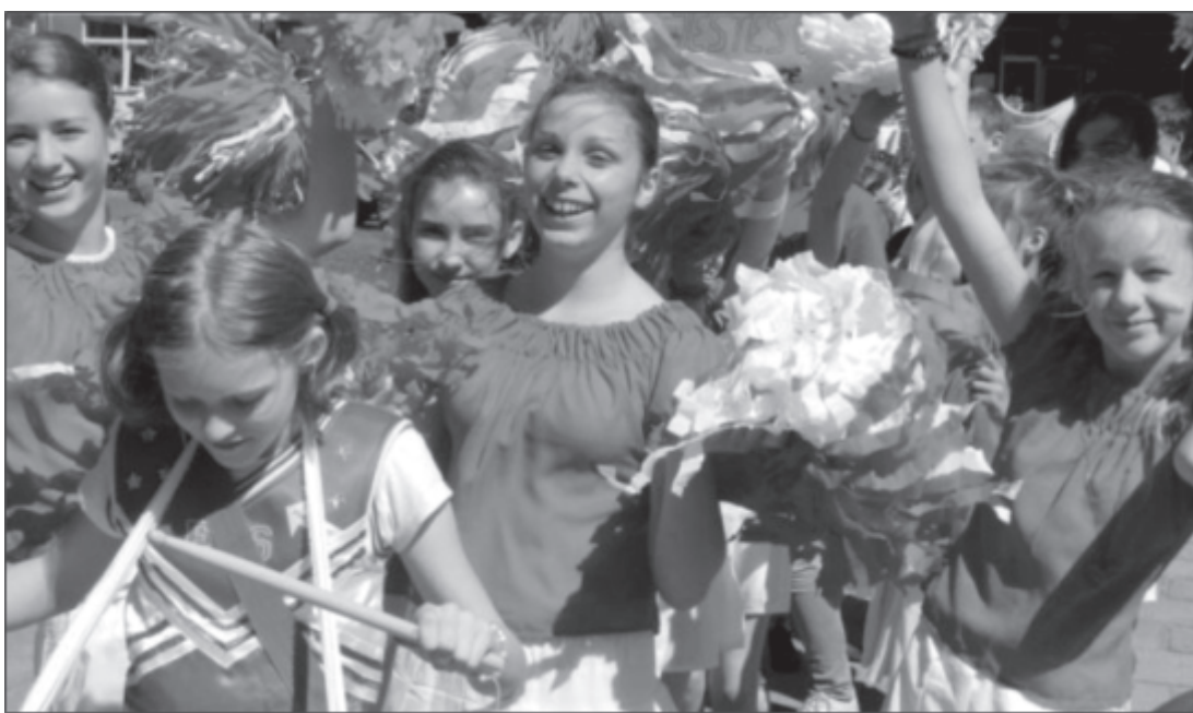
Korowód „Fair Play - Jesteś OK”

Profilaktyka i związana z nią promocja zdrowia to zadania, które w Szkole Podstawowej w Zbąszynku są realizowane permanentnie. W karty historii szkoły na stałe wpisują się coroczne przedsięwzięcia prozdrowotne. Tegoroczne odbyło się w dniach 23- 26 kwietnia. Motta przewodnie brzmiały: „Woda źródłem życia i zdrowia” (kl. I-III), „Szczepki, mądra główka” (kl. IV-VI). Celem działań było przekazanie uczniom wiedzy na temat ochrony środowiska naturalnego, znaczenia wody dla naszego życia, sposobów zdrowego odżywiania i higieny, także zachęcanie dzieci do aktywnego wypoczynku w czasie wolnym od nauki. W ramach przedsięwzięcia odbyły się: Olimpiada Zdrowia- etap szkolny, pokaz ratownictwa medycznego „Ratujemy i uczymy ratować” przeprowadzony przez pracowników pogotowia ratunkowego, prezentacja multimedialna- „Woda- życiodajny płyn”, degustacja przygotowanych przez uczniów naturalnych soków owocowych, owocowy pokaz mody w ramach kampanii „Zachowaj trzeźwy umysł - Pij dobrą energię!”, „Trzymaj formę”, czyli aerobik jako alternatywa na zagospodarowanie długiej przerwy, prelekcja dotycząca idei krwiodawstwa, przedstawienie - Ekologiczne opowieści Ziemi, inscenizacja muzyczna SOS dla Ziemi, prezentacje multimedialne - Gdzie woda tam życie, przedstawienie - Maja dziś uczy Was, jak o swoje zdrowie dbać, inscenizacja „Woda”, pokaz mody ekologicznej - Podwodne królestwo dzieci, profilaktyka raka piersi – prelekcja przeprowadzona przez pracowników Sanepidu dla mam uczniów.