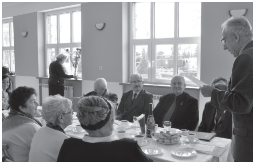
Kombatanci - Jubilaci