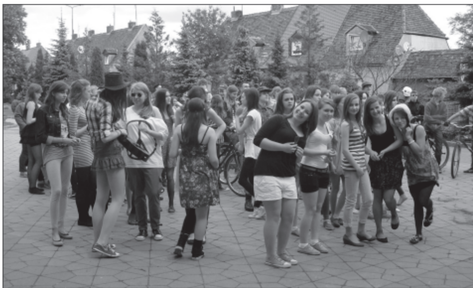
Uczniowie podczas kręcenia LibDub