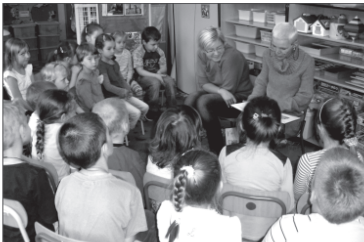
Przedszkolaki z Dąbrówki Wlkp.