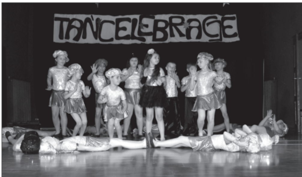
Grupa taneczna „Fresh” z Trzciela