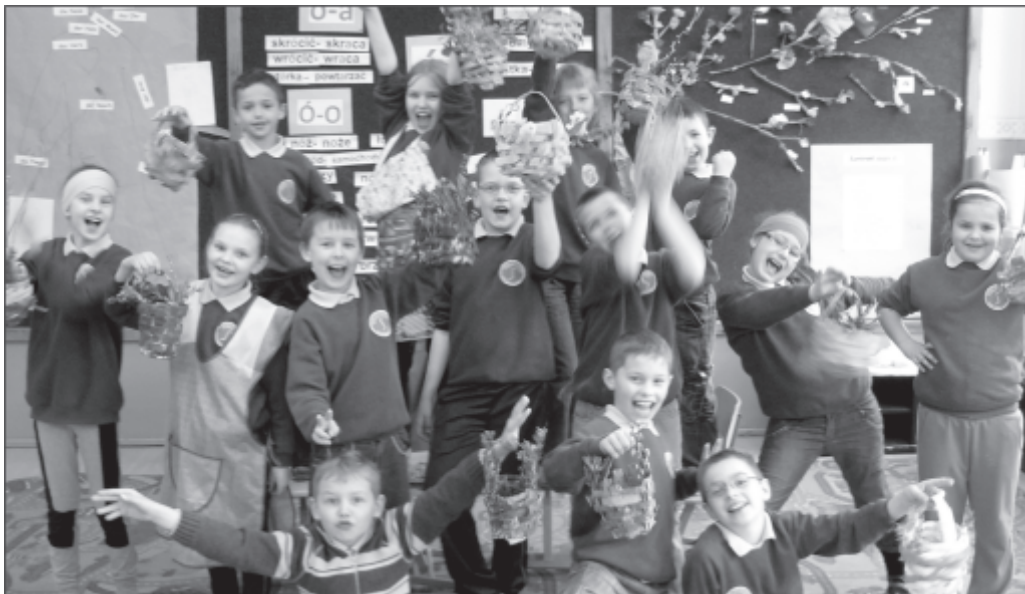
Uczniowie SP Dąbrowka Wlkp.

Solecka z Dąbrowki Wlkp. i Rada Solecka z Rogozinca. O naszych dzieciach pamiętały również Panie z Koła Gospodyń Wiejskich w Dąbrowce Wlkp. w dniu 30maja przygotowały pyszne racuchy. Wychowawcy klas wspólnie z Rodzicami zaplanowali wycieczki, które już się odbyły: kl. I i III Safari – Świerkocin, kl. II Janowiec i Wioska Indiańska, kregle w Zbąszyniu, kl.IV i VI Kotlina Kłodzka, kl.V biwak w Łagowie Lubuskim. Rada Rodziców jak co roku ufundowała wyjazd na basen dla klasy, która osiągnie najwyższą średnią przyrostu