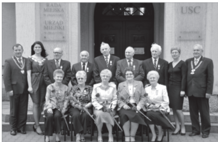
Pamiątkowe zdjęcie Jubilatów

dla młodszych pokoleń, że mimo upływu czasu, ciągłych zmian w otaczającym nas świecie, rodzina jest najważniejszą przystanią, do której zawsze powinniśmy powracać. Wszystkim Jubilatami życzymy zdrowia, szczęścia i wszelkiej pomyślności w życiu osobistym i rodzinnym.