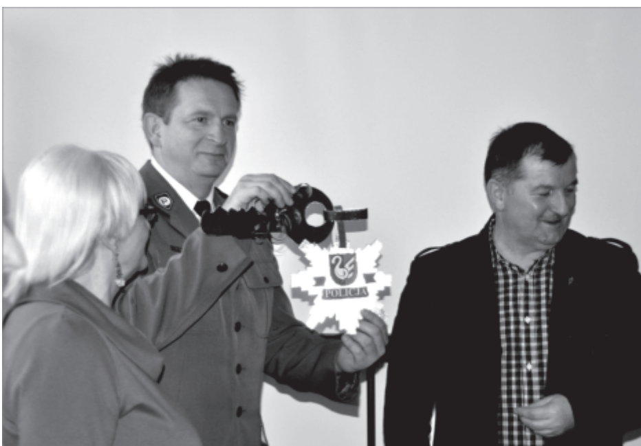
Wręczenie symbolicznych kluczy do wyremontowanych pomieszczeń

Zakończono prace remontowe w budynku Domu Kultury w Zbąszynku. Zakres obejmował pomieszczenia na parterze budynku po byłym lokalu gastronomicznym. Wykonano nowe tynki, podłogi, posadzki, instalacje elektryczne. Wymieniono grzejniki centralnego ogrzewania. Dzięki wykonanym remontom rozdzielono funkcje pomieszczeń. Powstały pomieszczenia, które udostępniono Policji. Powstała też sala o powierzchni 60 m 2 , która przeznaczona będzie pod potrzebę mniejszych imprez kulturalnych, zebrań mieszkańców czy prób zespołów tanecznych. Odnowiono również pomieszczenia gdzie swą siedzibę mają organizacje działające przy Domu Kultury. Powstały dwie nowe toalety. Policja uzyskała pomieszczenie socjalne, a salka małe pomieszczenie kuchenne. Większość prac wykonała firma Pana Piotra Przybyła z Chobienic.