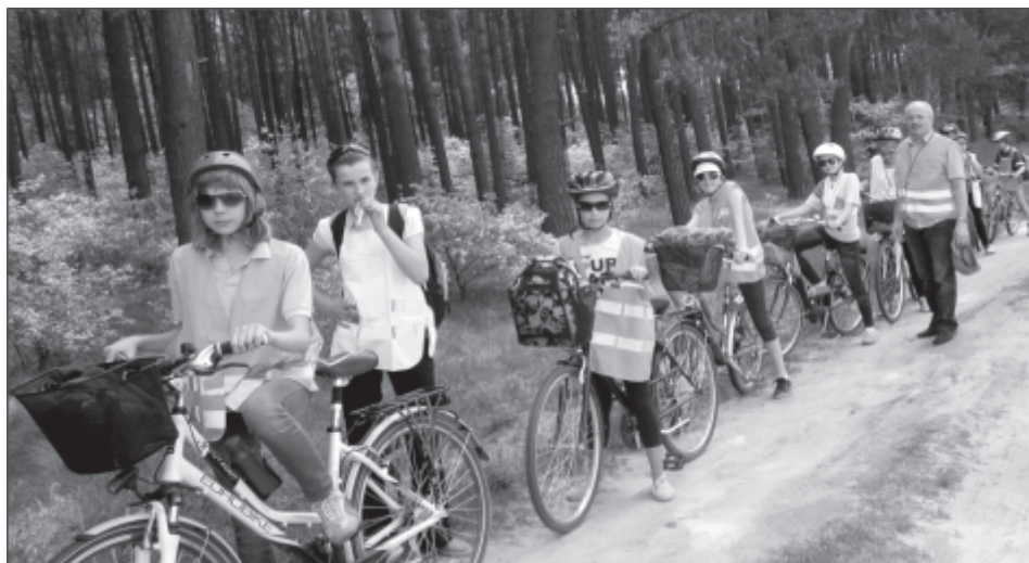
Uczestnicy wycieczki rowerowej