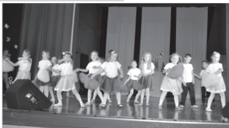
Grupa artystyczna z przedszkola „Pod Muchomorkiem”