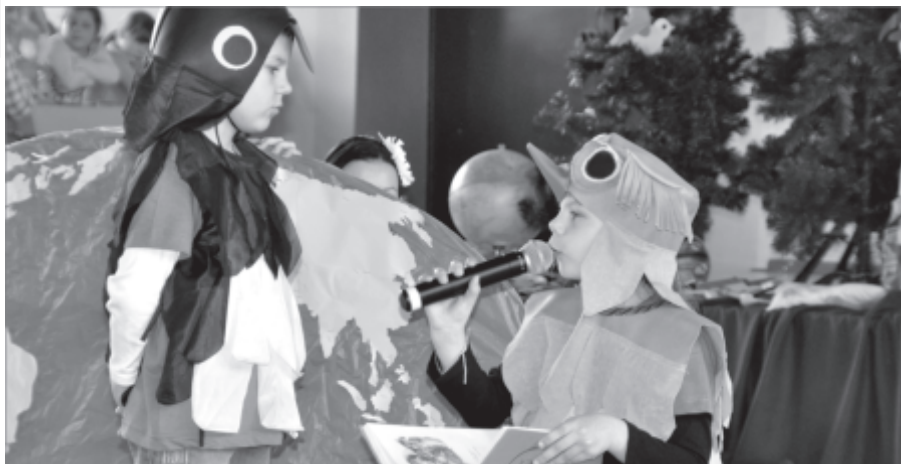
Przedszkolaki z Kosieczyna

Na scenie swoje umiejętności taneczne, wokalne i teatralne prezentowały dzieci z przedszkoli: w Zbąszynku, Dąbrówce Wlkp., Rogozińcu, Babimoście, Kręcku i Kosieczynie oraz pierwszoklasiści z SP Zbąszynek.