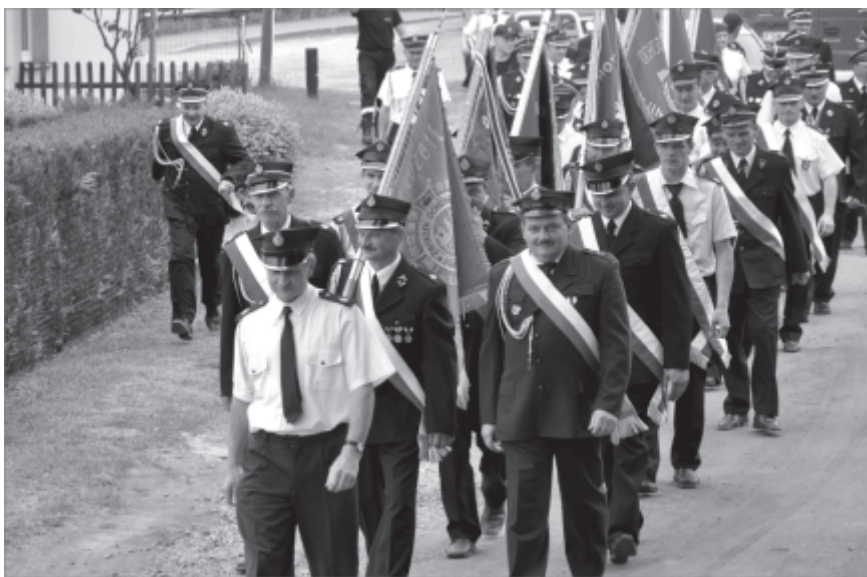
Strażacy - Jubilaci z OSP Dąbrówka Wlkp.