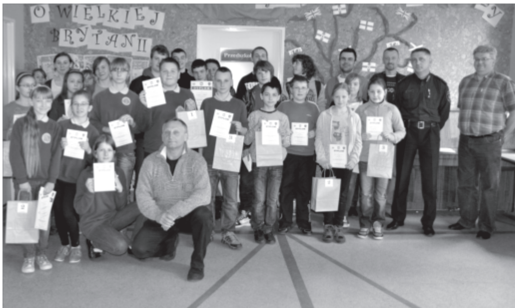
Zwycięcy turnieju BRD w Kosieczynie

W kategorii szkół podstawowych I miejsce zajęła drużyna