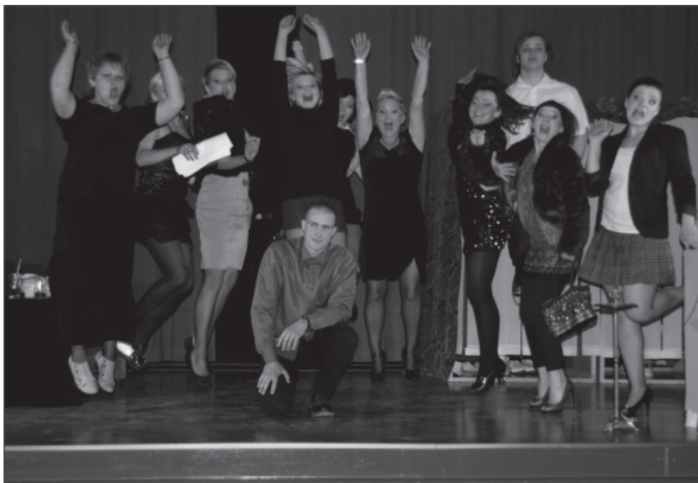
Teatr 18+ po premierze