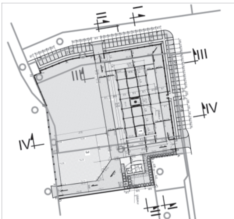
schemat budowy targowiska