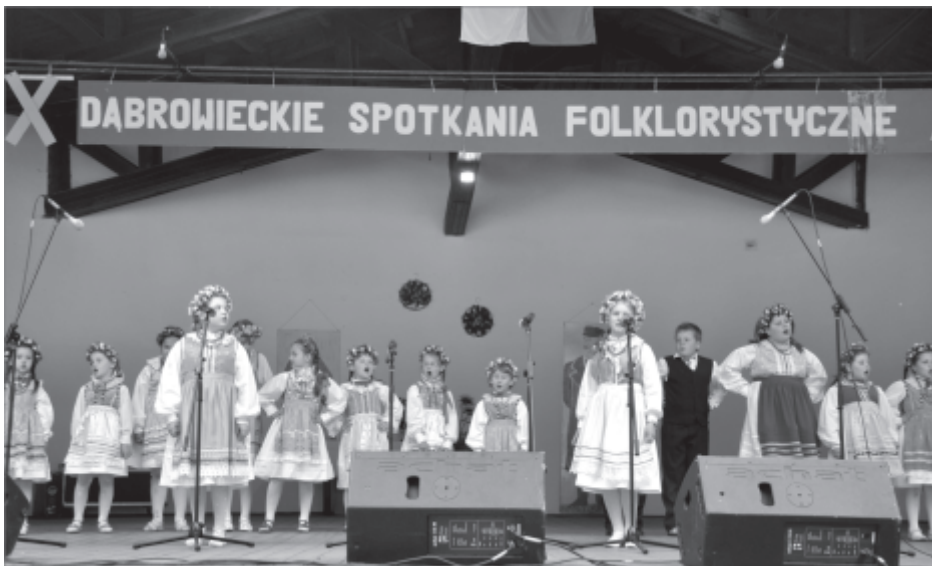
Grupa dziecięca Regionalnego Zespołu Pieśni i Tańca im. T. Spychały

W dniu 9 czerwca br. już po raz XX w Dąbrówce Wlkp. spotkali się miłośnicy folkloru na jubileuszowych Dąbrowieckich Spotkaniach Folklorystycznych „U progu lata”.