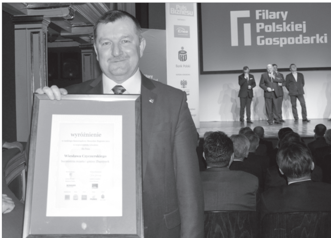
Burmistrz Zbąszynka - Samorządowy Menadżer Roku

Po raz pierwszy w 2012 r. przeprowadzono plebiscyt wśród gmin, mający na celu uhonorowanie liderów wśród jednostek samorządu terytorialnego. Samorządowcy spośród gmin w danym województwie wybierali jedną – w ich ocenie lidera w regionie.