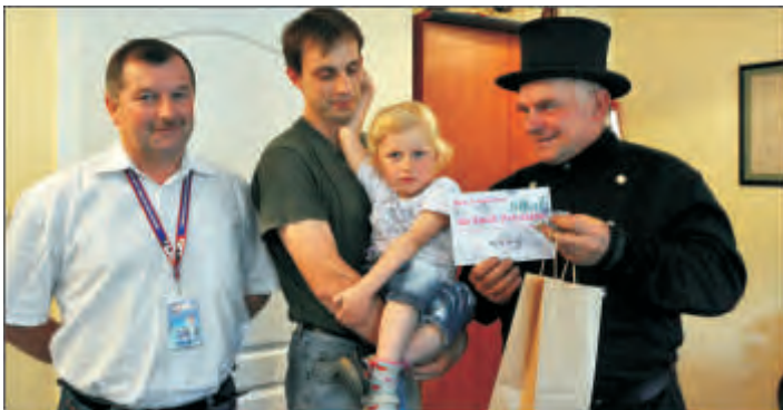
Zwycięzcy krzyżówkowej zabawy