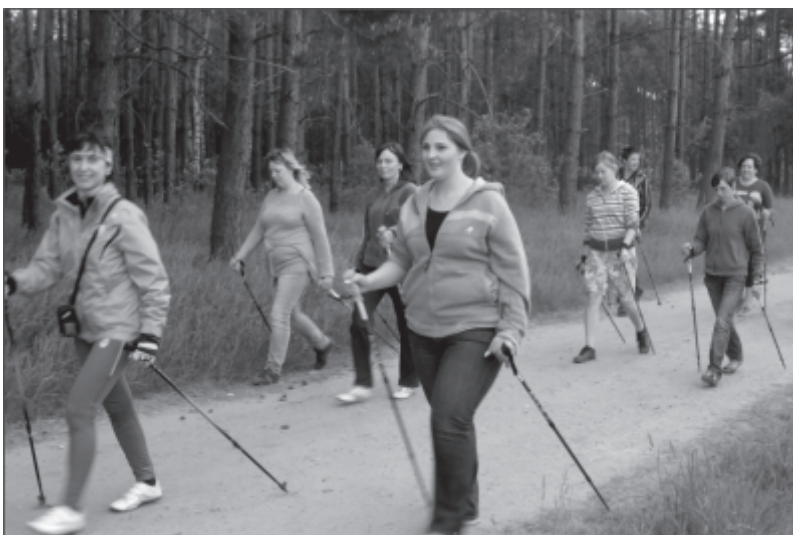
Uczestnicy marszu Nordic Walking