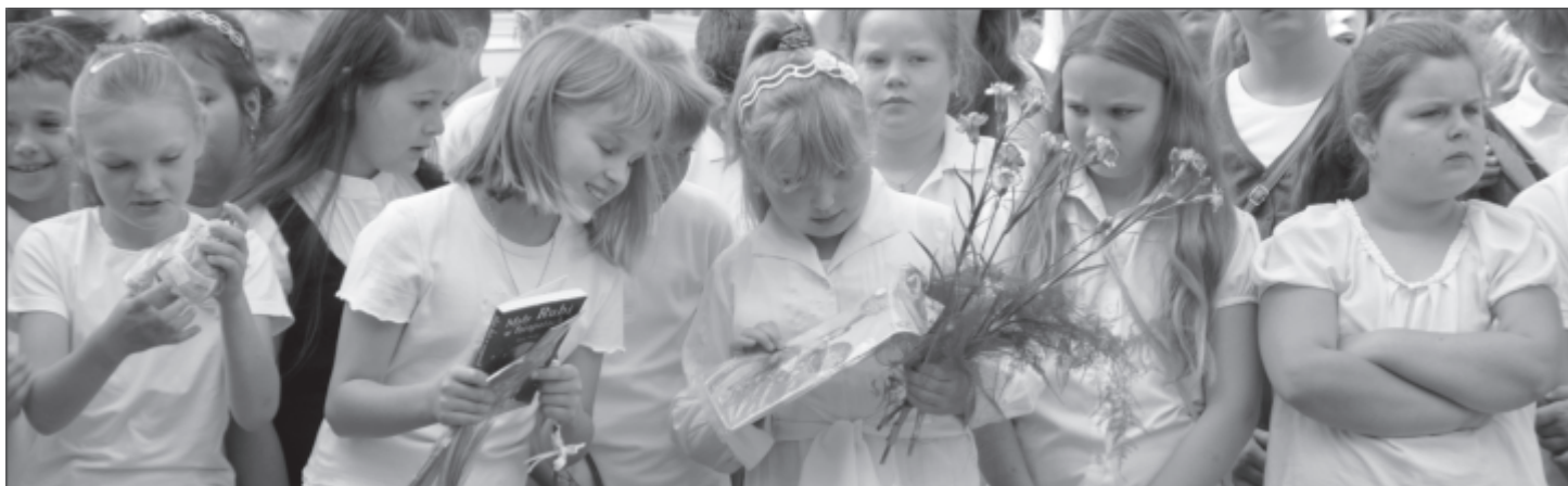
Wakacje czas zacząć

Wydatki Gminy w roku 2012 to kwota 35.781.688,00 z tego na oświatę Gmina wydaje 30 % swego budżetu. Subwencja oświatowa przyznana na rok bieżący to kwota 7.376.163, 00. Łatwo policzyć, że w porównaniu do samych wydatków na oświatę to tylko 68%. Pozostałe 32 % w kwocie 3.397.726, 00 dokłada Gmina, aby oświata funkcjonowała w standardach, jakie każdy może zaobserwować. Pomimo tak dużego dofinansowania do zadań oświatowych nie można zrealizować wszelkich potrzeb np. remontowych placówek. Bardzo dużych nakładów będzie wymagało zapewnienie właściwego stanu sanitarno - technicznego w Zespole Szkół Technicznych, zgodnie z prowadzonymi kontrolami sanitarnymi w celu zapewnienia bezpieczeństwa i higieny w szkole.