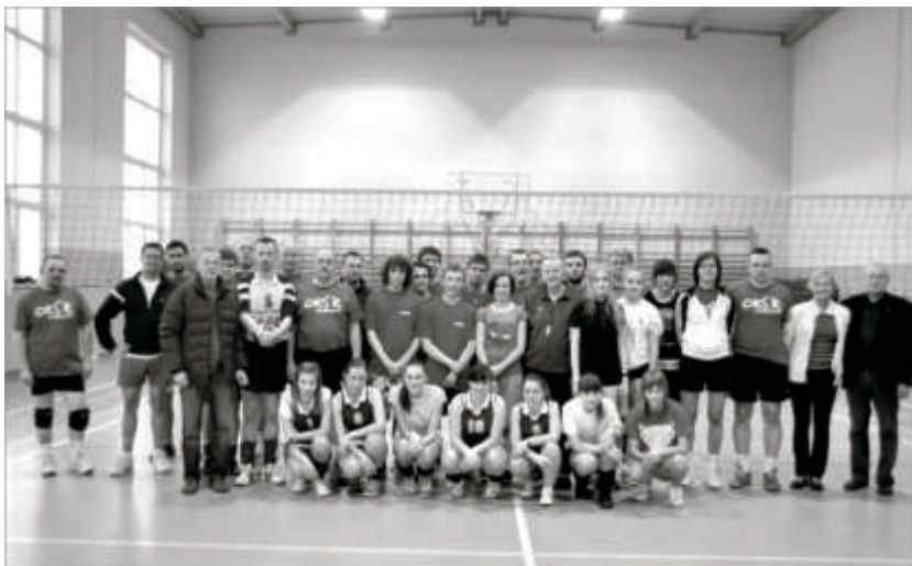
W tej edycji w turnieju walczyły ze sobą cztery drużyny.

W Kosieczynie po raz czternasty odbyły się rozgrywki siatkarskie o Puchar Przewodniczącego Rady Miejskiej. 2 marca 2012 r. na parkiet sali gimnastycznej przy Szkole Podstawowej wyszły cztery drużyny: Nauczyciele, Kosieczyn, Gimnazjum Dziewczęta oraz Zbąszynek.