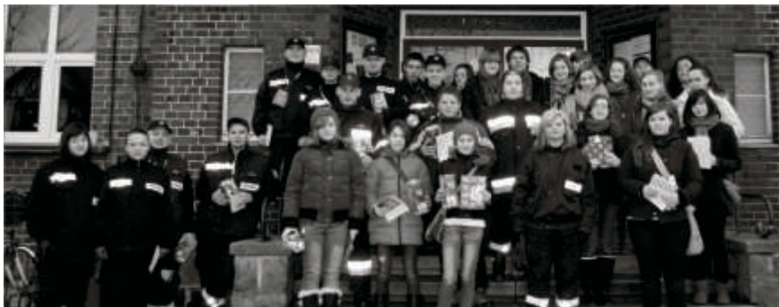
W tym roku Sztab w Zbąszynku wspomagało 38 wolontariuszy

Zdrowa mama, zdrowy wcześniak, zdrowe dziecko! Pod takim hasłem zagrał XX Finał Wielkiej Orkiestry Świątecznej Pomocy. Zebraliśmy 14 869,85 zł. 8 stycznia 2012 r. od rana harcerze ze Zbąszynka i strażacy z naszej gminy zbierali datki do puszek. W Domu Kultury odbyły się występy artystyczne oraz licytacje. Zobaczyliśmy bogaty dorobek artystyczny od śpiewów po układy taneczne. Spośród osiemdziesięciu przedmiotów jakie trafiły „pod młotek” najdrożej sprzedało się złote serduszko z logiem WOŚP, za 350 złotych. 300 złotych dano za oryginalną koszulkę WOŚP oraz zimową czapkę z Uralu. Dziękujemy wszystkim osobom zaangażowanym w organizację finału, a także mieszkańcom, którzy postanowili wesprzeć orkiestrę.