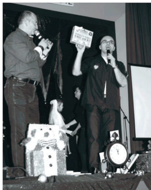
Rekordu nie ma. Pomimo wszystko zebraliśmy prawie 15 tysięcy złotych!