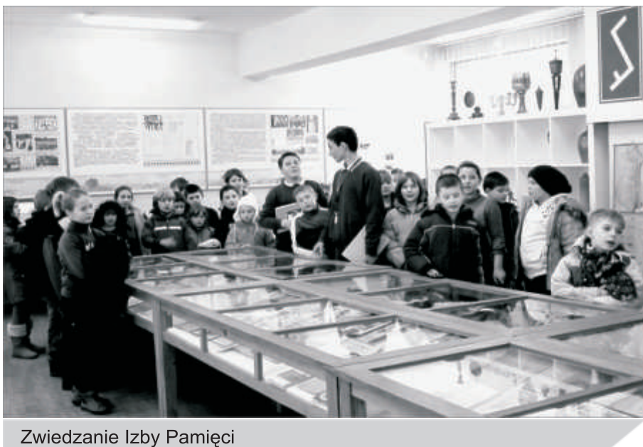
Zwiedzanie Izby Pamięci

10.02.2012r. Spotkanie z Policją – Dzielnicowym, pogadanka na temat bezpieczeństwa podczas ferii.