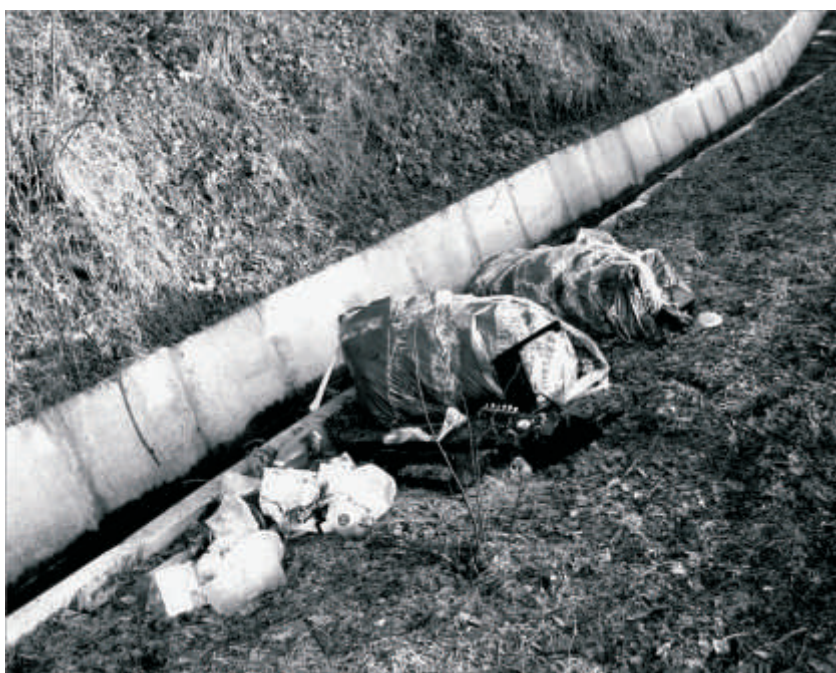
Niestety takich widoków jest dużo więcej

Odpowiedzialnymi są osoby wymienione jako przedstawiciele poszczególnych OSP i organizacji ZHP. Worki zabezpiecza Urząd Miejski.