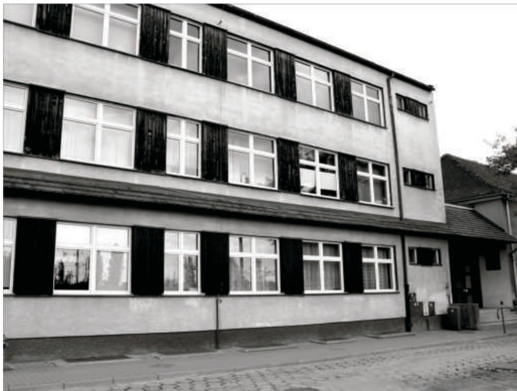
Budynek Zespołu Szkół Technicznych

Zwracając uwagę na ilość miejsc w internacie, pogłębiający się niż demograficzny oraz komunikację PKP i PKS nowa niepubliczna placówka miałaby możliwość przyjęcia oprócz uczniów ZST w Zbąszynku również uczniów z sąsiednich gmin, które nie posiadają internatu, ponieważ połączenie środkami komunikacji ze Zbąszynka jest bardzo dogodne.