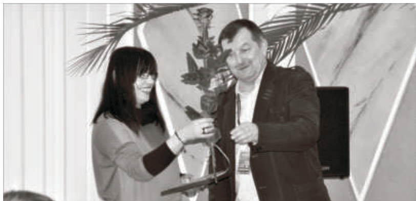
Burmistrz Zbąszynka dziękuje pani psycholog za przeprowadzenie szkolenia

rodziny przez jednego z jej członków przeciwko pozostałym, z wykorzystaniem istniejącej lub stworzonej przez okoliczności przewagi sił lub władzy, godzące w ich prawa lub dobra osobiste, a w szczególności w ich życie lub zdrowie (fizyczne czy psychiczne), powodujące u nich szkody lub cierpienie. Z punktu widzenia prawa przemoc w rodzinie to przestępstwo, którego odmiany określone są w różnych kodeksach i odpowiednio karane. Najczęściej stosowany artykuł 184 kodeksu karnego (w nowym k.k. art. 207) dotyczy znęcania się fizycznego lub moralnego nad członkiem rodziny i przewiduje karę pozbawienia wolności od 3 miesięcy do 12 lat.