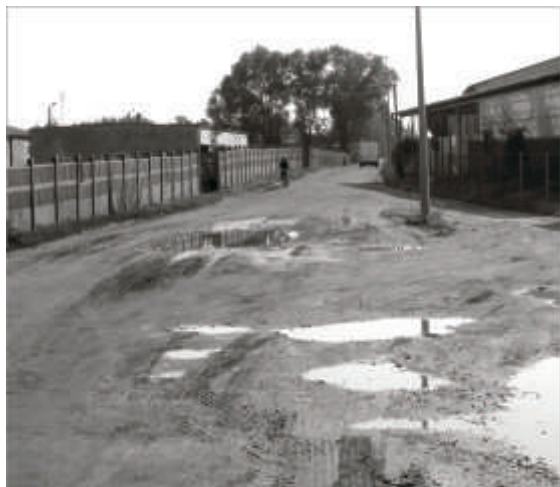
Ulica Czarna Droga

Do końca bieżącego roku będzie można korzystać z nowego, kolejnego już odcinka zmodernizowanej drogi gminnej – ulicy Czarna Droga w Zbąszynku.