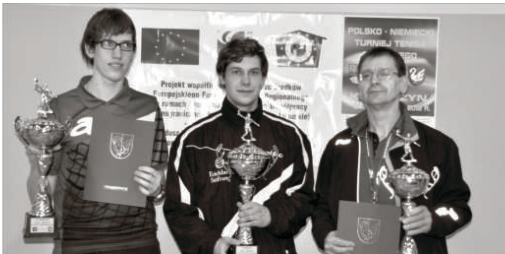
Najlepsza trójka Polsko - Niemieckiego Turnieju Tenisa Stołowego

Projekt „Polsko – Niemiecki Turniej Tenisa Stołowego” jest współfinansowany ze środków Europejskiego Funduszu