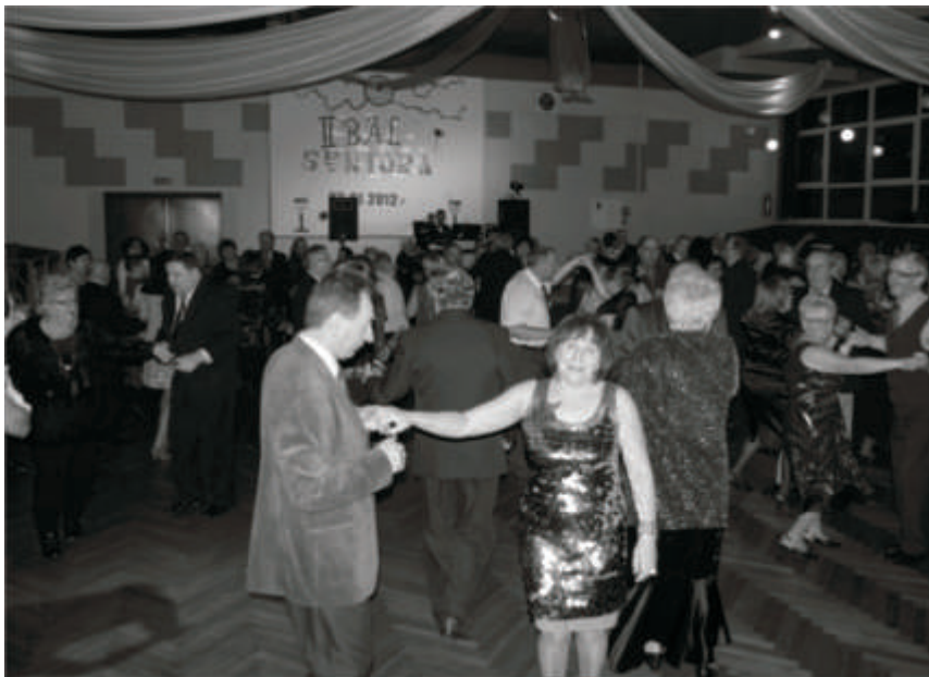
Wesoła atmosfera to standard na Balu Seniora.

Jedni bawili się w Domu Kultury, natomiast inni wspólnie z Burmistrzem na obiektach Ośrodka Sportowo-Rekreacyjnego im. Bogdana Niemca. W Domu Kultury odbył się Bal Sylwestrowy, na którym przygrywał zespół Clex z Gorzowa Wlkp. Atrakcją był pokaz tańców orientalnych. Na środek sali wjechał tort sylwestrowy. Goście bawili się do piątej nad ranem. Burmistrz Zbąszynka tradycyjnie świętuje Nowy Rok wspólnie z mieszkańcami na „stadionie”. To właśnie tam złożył wszystkim życzenia. Chwilę później na niebie rozbłysły światła fajerwerków.