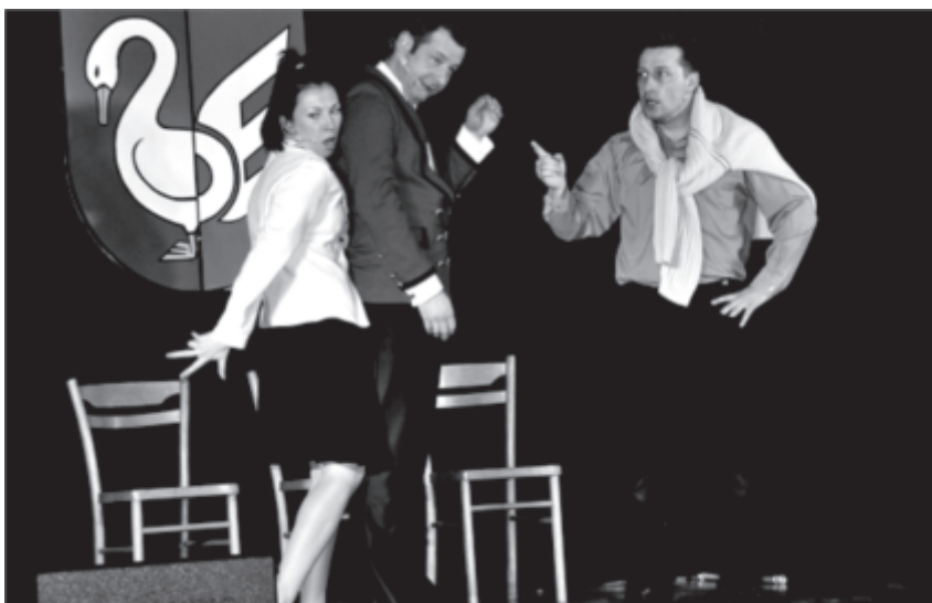
Publiczność płakała ze śmiechu oglądając skecze Kabaretu Nowaki.