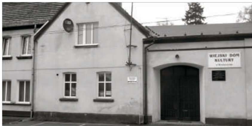
Sala Wiejska w Kosieczynie

wykonanie elewacji, podłóg, instalacji elektrycznej, instalacji c.o. Obiekt otrzyma również nowe wyposażenie. Będą to stoły, krzesła, urządzenia kuchenne, urządzenia audio- video, itp.