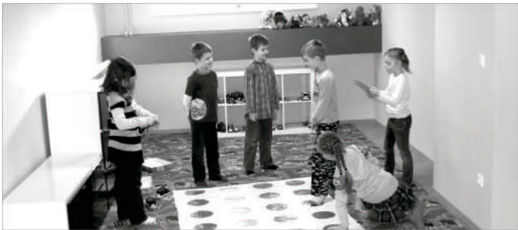
Świetlica w Szkole Podstawowej w Zbąszynku

W Szkole Podstawowej w Zbąszynku oddano do użytku dla dzieci nową świetlicę szkolną. Remont został przeprowadzony w pierwszych miesiącach br. W pomieszczeniach piwnicznych wygospodarowano miejsce przeznaczone na świetlicę dla dzieci. Świetlica została utworzona na prośbę rodziców. Jest to placówka opiekuńczo – wychowawcza, w której utworzono jeden oddział. Korzysta z niej 22 dzieci, które ze względu na czas pracy rodziców, mają tu zapewnione bezpieczeństwo przebywania w szkole przed zajęciami szkolnymi lub po zajęciach. Świetlica nie tylko zapewnia uczniom warunki do odrabiania zadań domowych, ale również wdraża do przyswojenia prawidłowych nawyków uczenia się oraz organizowania i rozwijania własnej aktywności umysłowej.