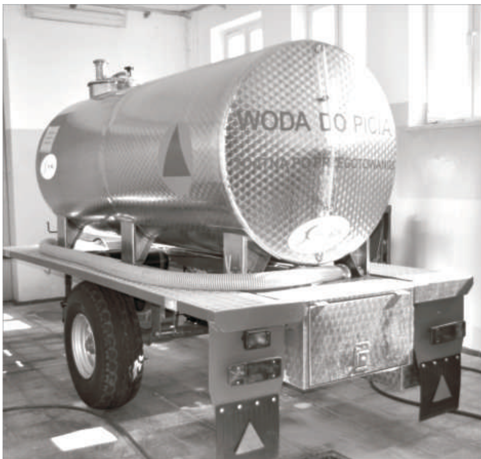
Cysterna z wodą do picia

Samorządowy Zakład Usług Komunalnych w Zbąszynku apeluje do mieszkańców naszej gminy o wyrozumiałość i w podobnych przypadkach o zaopatrywanie się w zapasy wody na Stacji Uzdatniania Wody za boiskiem OKSIR. Punkt poboru będzie obsługiwany przez pracownika SZUK i uruchomiony podczas każdej awarii sieci wodociągowej. Jednocześnie informujemy, że woda dowożona cysterną będzie tylko w przypadku dłuższych awarii sieci.