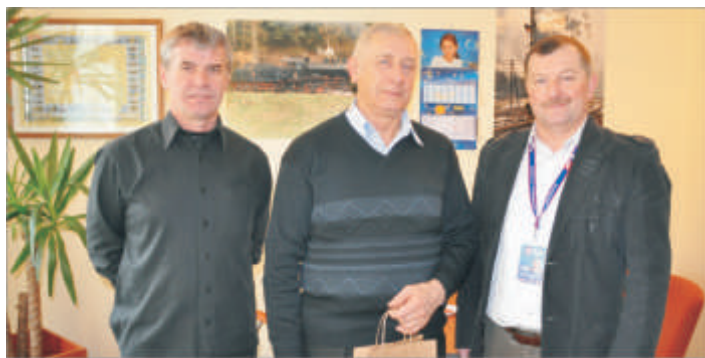
Zwycięzca krzyżówkowej zabawy