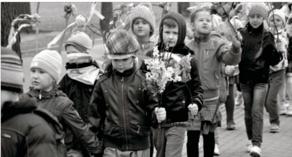
Przedszkolaki witają wiosnę

przedszkolaki nie witały jej z pustymi rękami. Barwny, wiosenny korowód przeszedł ulicami Zbąszynka i zakończył się uroczystym świętowaniem rozpoczęcia wiosny.