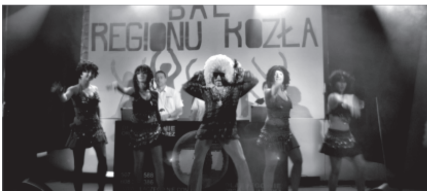
Obecność Dyskoteki Dorosłego Człowieka podniosła atrakcyjność Balu Regionu Kozła