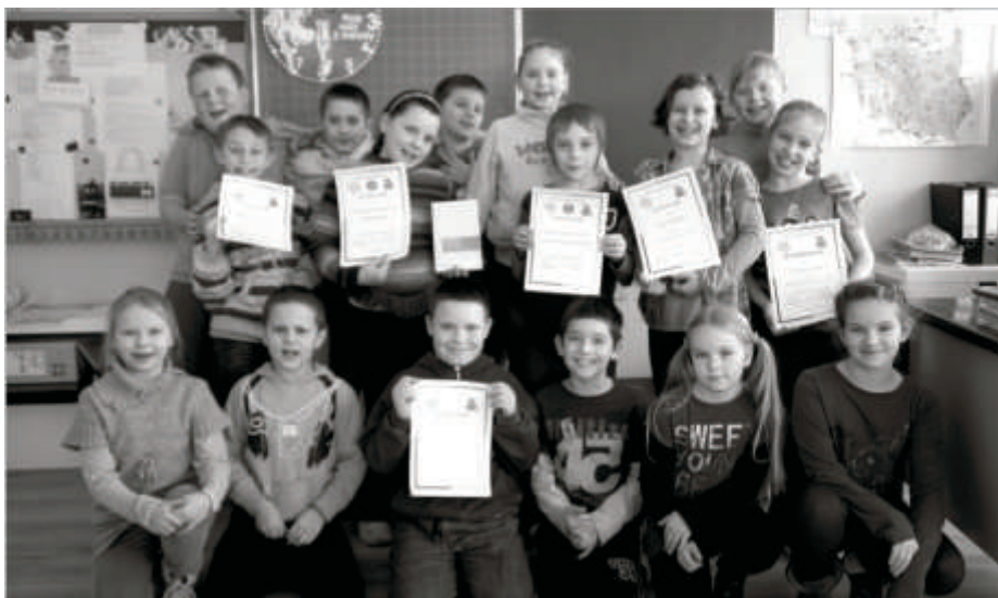
Uczestnicy konkursu ortograficznego klas I-III

dziewczęta z Kosieczyna ponownie były wśród najlepszych. Tym razem „łupem” padły medale srebrne i brązowe pośród „dwójek” oraz srebrne w „trójkach”. W styczniu starsze siatkarki zajęły II miejsce w bardzo silnie obsadzonym Ogólnopolskim Turnieju Minisiatkówki w Poznaniu, zaś młodsze zaprezentowały się bardzo udanie w rywalizacji indywidualnej w turnieju siatkarskich singli w Szlichtyngowej, gdzie najlepsze dziewczęta zajęły dwa dolne miejsca na podium. 9-10 marca